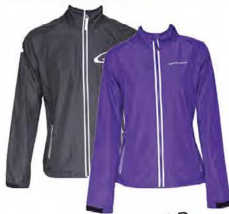
LÉTTIR JAKKAR VERÐ NÚ: 2500 KR -TIL Í 4 LITUM