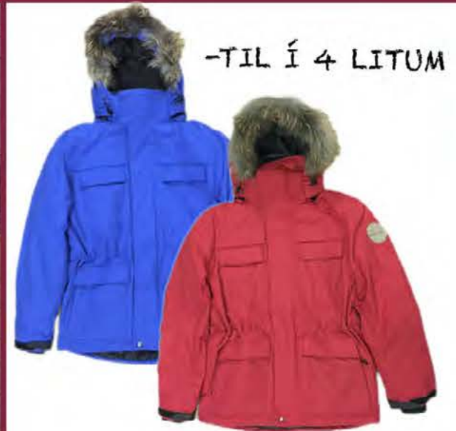
PARKA ÚLPA VERÐ NÚ: 12998 KR