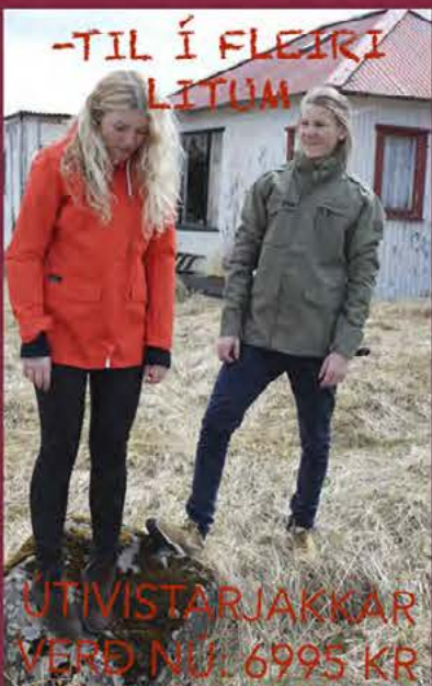
ÚTIVISTARJAKKAR VERÐ NÚ: 6995 KR