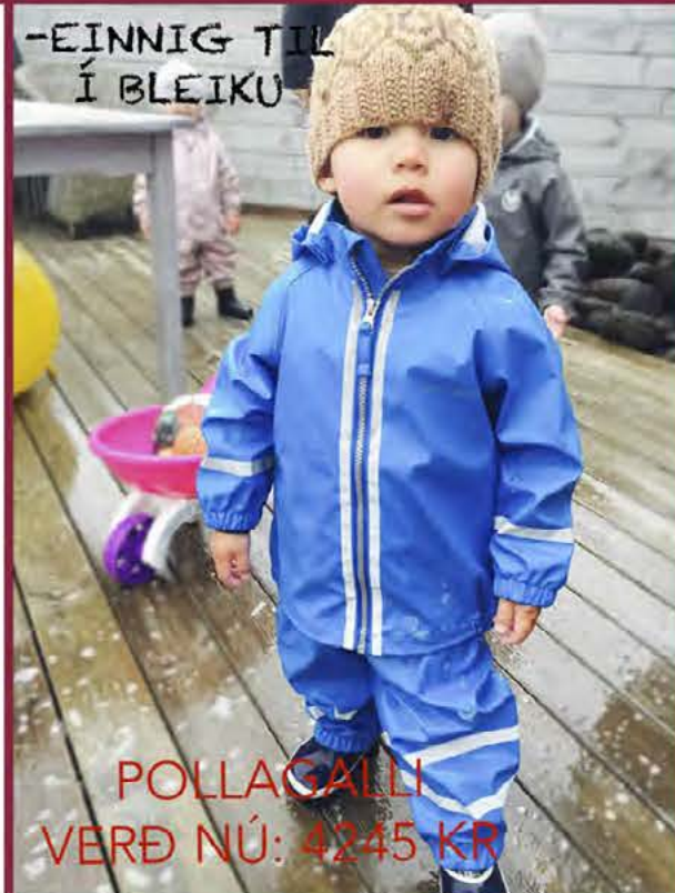
POLLAGALLI VERÐ NÚ: 4245 KR