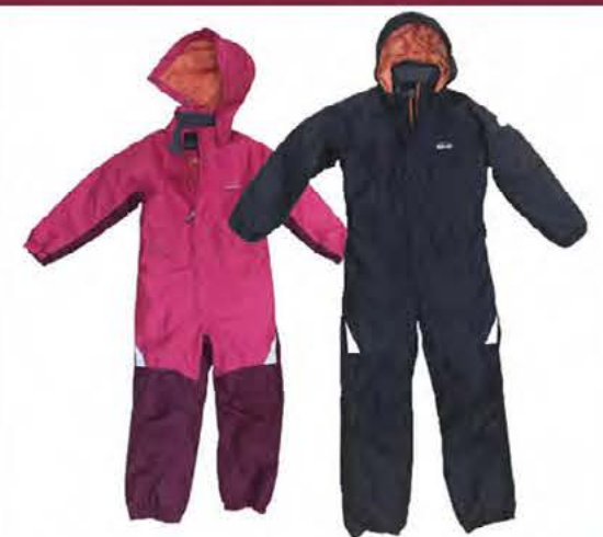
KULDAGALLI VERÐ NÚ: 6998 KR