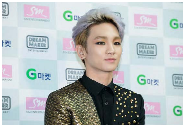
Key, sem er í SHINee, notar oft andlitsfarða.

» Snyrtivörunotkunin hefur ekkert með kynhneigð að gera. Suðurkóreskt samfélag er almennt íhaldssamt og hefðbundin kynhlutverk eru föst í sessi.