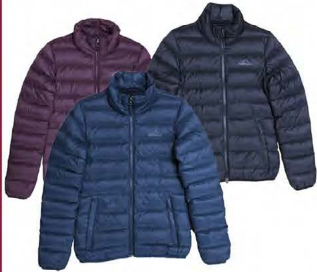
DÚNJAKKAR VERÐ NÚ: 9495 KR

-við sendum hvert á land sem er! s.483-4517