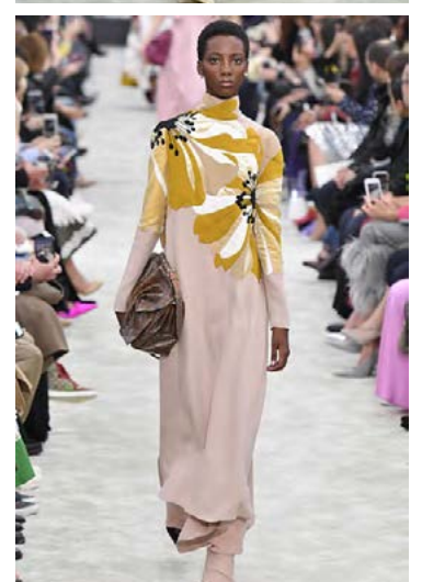
Það er gaman að sjá hvernig tiskuhönnuðir hjá Valentino raða saman litum.