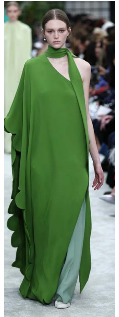
Kjólarnir frá Valentino sem konur eiga að klæðast haust og vetur 2018-2019 eru efnismiklir og litríkir.