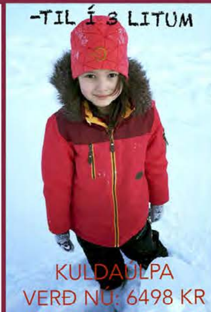
KULDAULPA VERÐ NÚ: 6498 KR