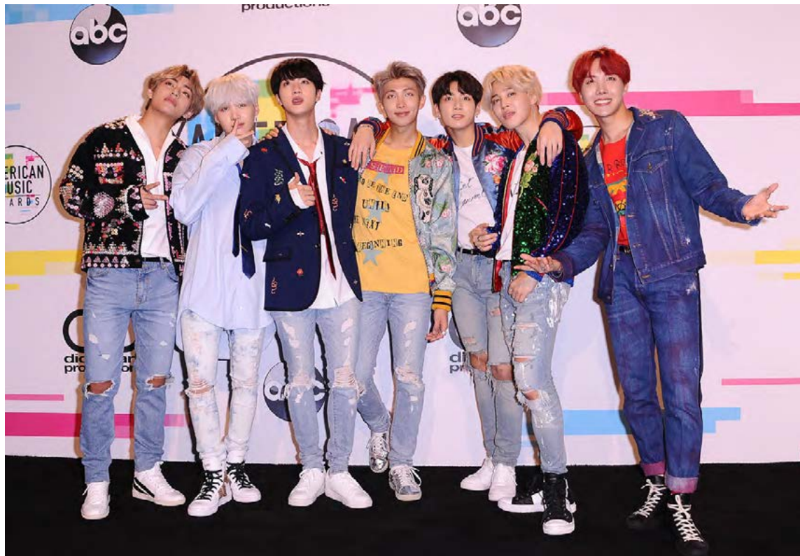
K-pop hljómsveitir eins og BTS hika alls ekki við að friska upp á útlitið með alls kyns snyrtivörum.

Snyrtivörunotkunin hefur ekkert með kynhneigð að gera. Suðurkóreskt samfélag er almennt íhaldssamt og hefðbundin kynhlutverk eru föst í sessi. Snyrtivörunotkun karla er hins vegar orðin svo algeng og almenn að það er meira að segja til sérstök felulitamálning sem fer sérlega vel með