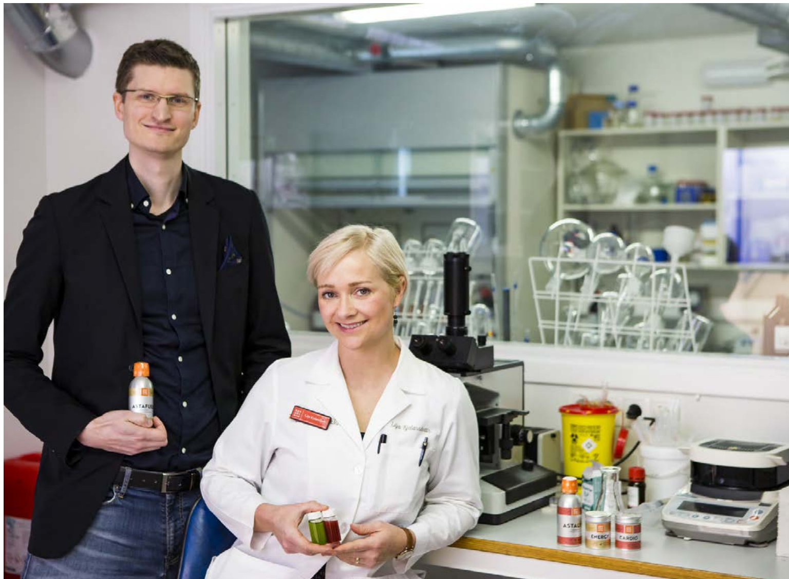
Hjá KeyNatura er lögð mikil áhersla á stuttar boðleiðir og passað upp á að rannsóknir og þróun haldist þétt í hendur við markaðs- og sölumál.