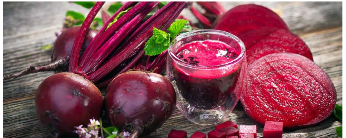
Rauðrófur eru sneisafullar af næringar- og plöntuefnum og innihalda m.a. ríkulegt magn af járni, A-, B6- og C-vitami.

Lífrænu rauðrófuhylkin frá Natures Aid eru 100% náttúrulegt bætiefni og góð fyrir alla sem vilja viðhalda góðri heilsu. Það er mikill hæðarauki fyrir marga að geta tekið inn rauðrófuhylki því ekki eru allir jafn hrifnir af bragðinu af rauðrófunni eða rauðrófusafanum. Viðtökur Íslendinga við Organic Beetroot frá Natures Aid hafa verið ótrúlega góðar og flestir kaupa þessa vöru aftur og aftur vegna þeirra áhrifa sem þeir finna. Margir