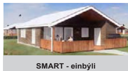
SMART - einbýli

Kíkið á vef okkar: www.huseining.is og sjáið lóðaframboði!