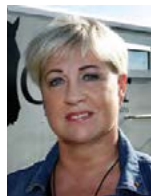
Femarelle skiptir Valgerði miklu máli.