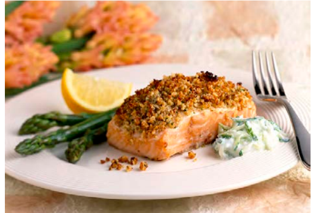
Lax er ljúffengur og vítamínríkur.

heldur 2 msk. af ólífuolíu, safa úr hálfri sítrónu og salt og pípar. Þessu er dreypt yfir laxaflax sem er bakað í ofni við 180°C í um 15 mínútur. Gott er að setja grænan aspas með í ofnskúffuna og hafa hann sem meðlæti en aspas er einmitt ríkur af A-, C-, E-, K- og B6-vítamíni. Lax er ríkur af D-vítamíni, ómega-3 sýrum og próteini, enda oft flokkaður sem ofurfæða.