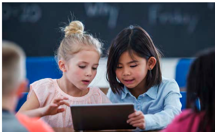
Tölvuleikir gætu skipað stóran sess í menntun framtíðar.

Þeir geta stuðlað að þroska tilfinninga og vitsmuna. Í mörgum leikjum þarf fólk að vinna saman