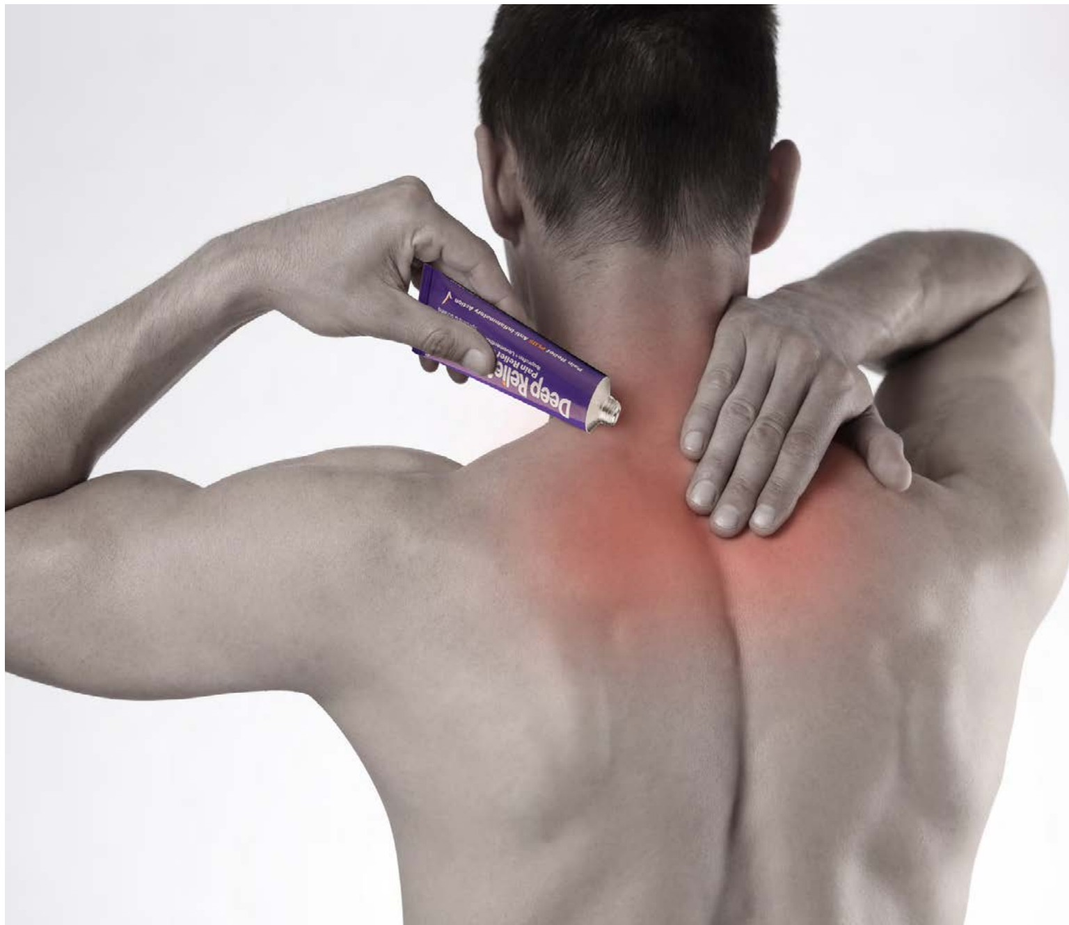
Deep Relief hlaupið slær á verki og bólgur í vöðvum.