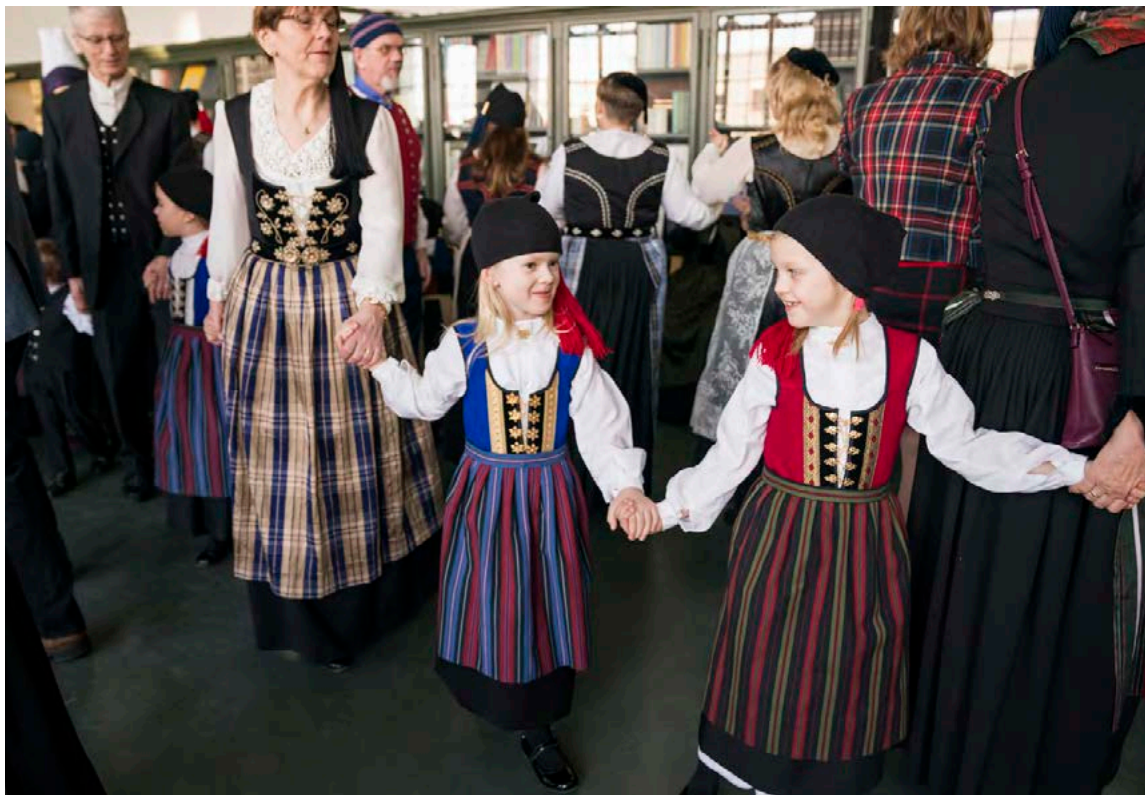
Heimilisiðnaðarfélagið vill hvetja fólk til að nota þjóðbúninga í ríkari mæli.