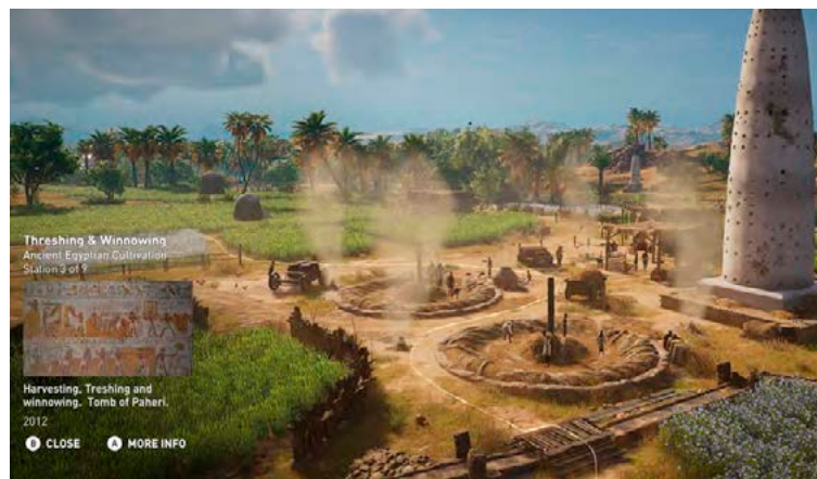
Í tölvuleiknum Assassin's Creed: Origins er hægt að fara í skoðunarferðir um Egyptaland hið forna.

Leikir geta líka gefið fólki æfingu í alls kyns erfiðum eða hættulegum aðstæðum án ótta við afleiðingarnar. Dæmi um þetta eru leikir sem setja spilara í flókna síðferðislega stöðu sem þeir þurfa að vinna úr eða flughermar sem