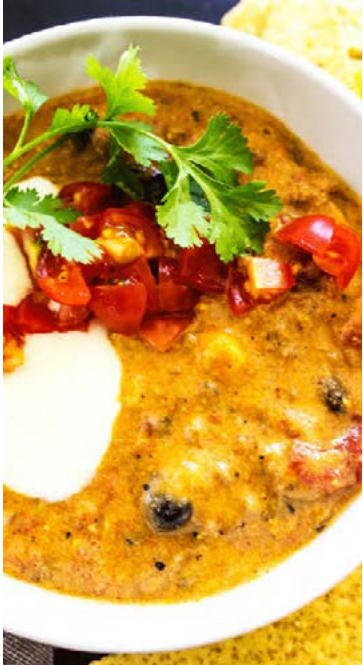
Geggið idýfa með snakkinu.