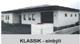
KLASSIK - einbýli