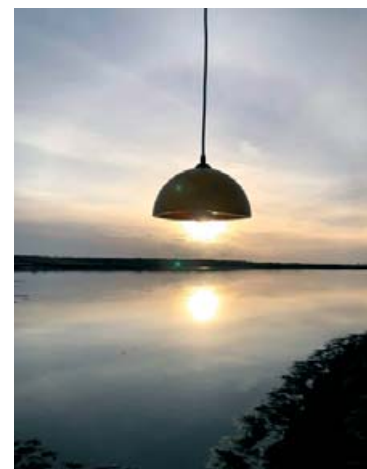
Loftljós úr flotkúlu sem mengaði fjöruna en strákarnir hafa fært í nýjan búning með endurvinnslu um leið og þeir tóku þátt í frumkvöðlakeppni.