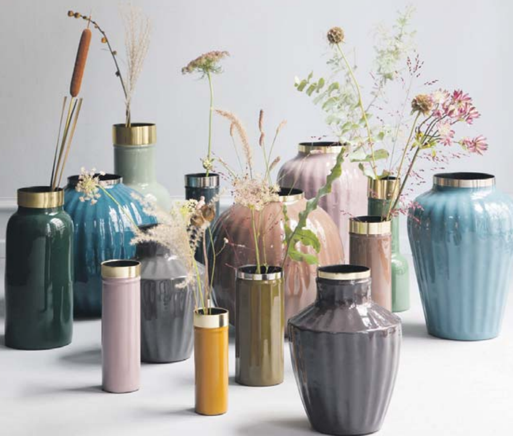
VASAR VERÐ FRÁ KR. 4.400 - 10.800