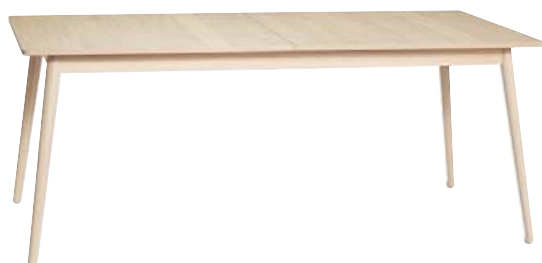
MAIN STÆKKANLEGT BORÐSTOFUBORÐ 94X180/278 CM KR. 164.500