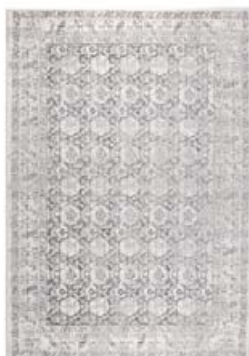
MOTTA 170X240 KR. 116.900