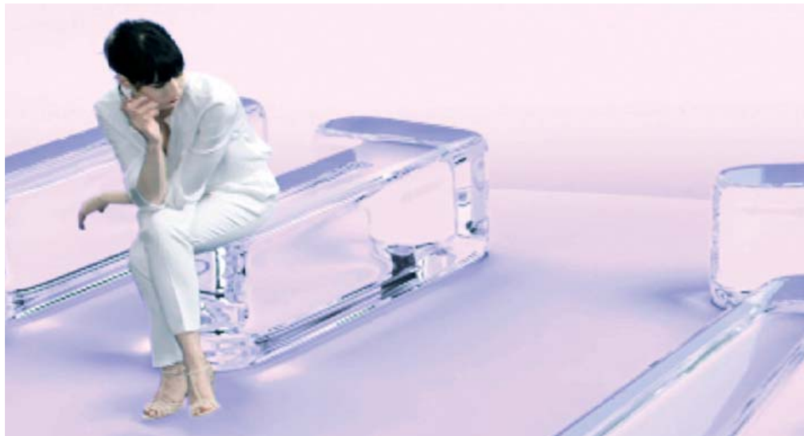
Talið er að um 10-20% almennings þjáist af hægðatregðu og allt að 40% þungaðra kvenna. Ástæður hægðatregðu geta verið mjög margar, eins og t.d. léleg næring, lítið af vökva, óhollur matur, aukaverkanir af lyfjum, veikindi eða stress.