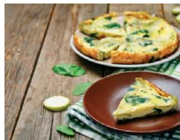
Eggjakaka með spinati, hollur og góður matur.

Þeir sem vilja vera öruggir með að fá nægt K-vítamín ættu að hafa grænkal, rósakál, spergilkál, spinat og aspas á disknum sínum. Allt þetta grænmeti er ríkt af K-vítamíni. Þess utan er allt þetta kál mjög hollt fyrir