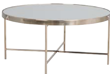
LONDON SÓFABORÐ KR. 35.700