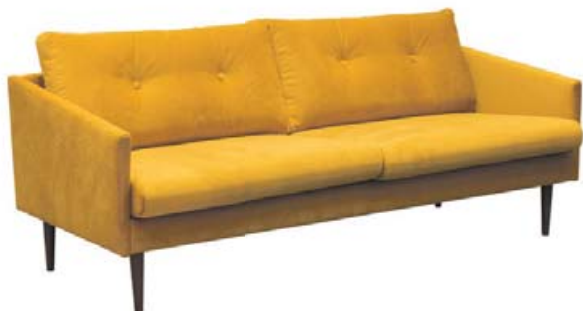
ANTON SÓFI 197 CM - KR. 128.700