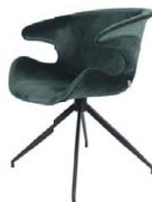
MIA STÓLL KR. 57.900