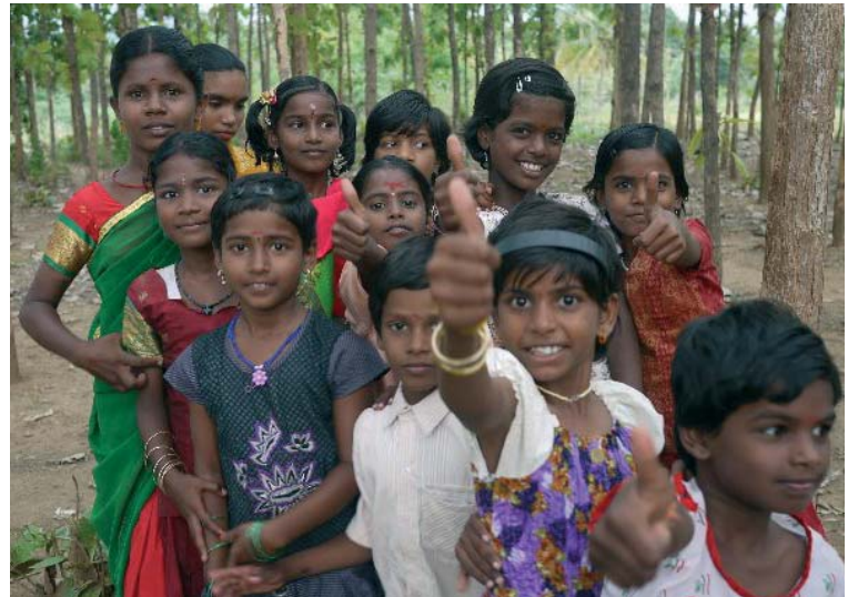
Vinir Indlands styrkja um 600 börn um skólabúninga og skólabúnað á hverju vori en skólaárið á Indlandi hefst í júní. MYND/VINIR INDLANDS

lánnum aðallega konum til að byggja upp starfsemi, sér og sínum til framfærslu."