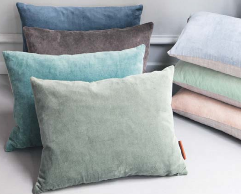
VELVET SOFT PÚÐAR 30X50 KR. 4.700