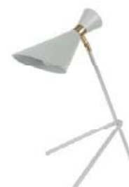
BORÐLAMPI . 23.400