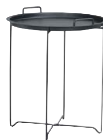
BAKKABORÐ KR. 9.900