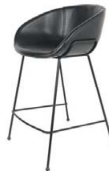
COUNTER BARSTÓLL KR. 58.300