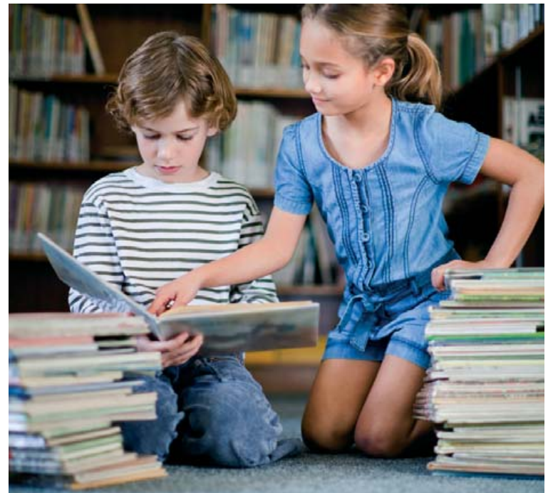
Markmið samtakanna er að styðja við íslenska barnamenningu, stuðla að auknum lestri barna, auka menningarläsi barna og hvetja þau til sköpunar.