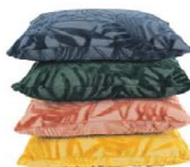
PÚÐAR KR. 6.400