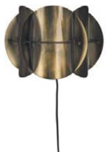
VEGGLJÓS KR. 12.900