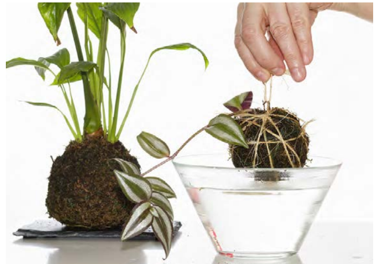
Hvaða tegund blóma sem er má nota í boltana. Þá þarf að vökva vel og til dæmis láta þá liggja í vatni dálitla stund.

hver vill og hægt að vera með fleiri en eina plöntu í sama bolta. Svo má nota litrík bönd til að vefja þá með og hengja þá upp með litríkum borðum. Kokedamabolta er sérstaklega sniðugt að gera með krökkum. Krakkarnir geta drullumallað og mótað utan um plönturnar og foreldrarnir hjálpað þeim