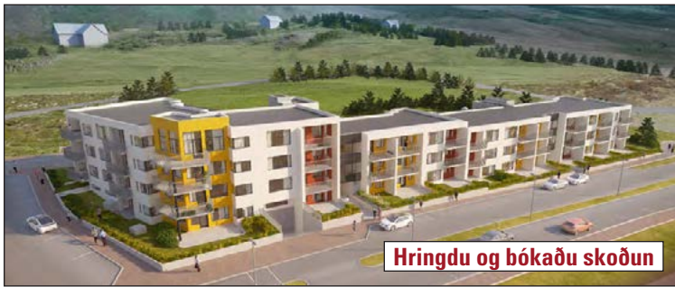
Hringdu og bókaðu skoðun

Nýtt 40 íbúða fjölbýlishús á fallegum útsýnisstað. Vel skipulagðar íbúðir, ásamt bílastæði í bílageymslu, í lyftuhúsi í Helgafellshverfi. Íbúðirnar skilast fullbúnar með innréttingum frá Axis, án megin gólfefna. Gólf í baðherbergjum/þvottahúsum verða flisalagð.