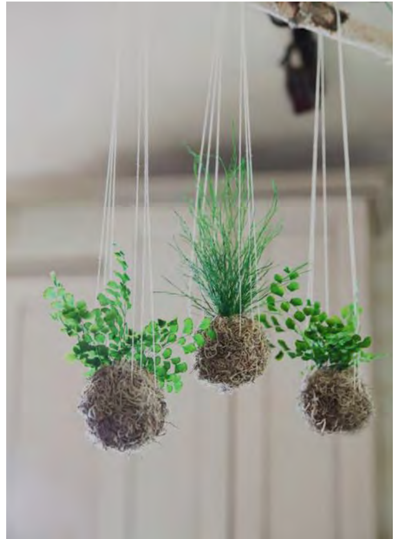
Hengigarðar njóta mikilla vinsælda og prýða heimilin.

„Eins er sniðugt að nota kertastjakana sem ekki eru notaðir yfir sumarið undir boltana eða sérstakar japanskar skálar, sem ætlaðar eru undir mosabolta. Boltarnir geta verið eins stórir og