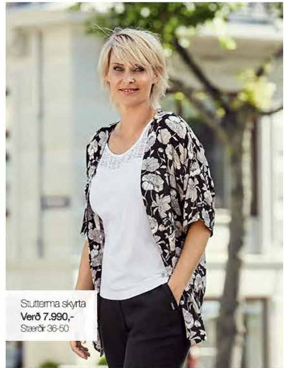
Stuttuma skyrta Verð 7.990,- Stærðir 36-50