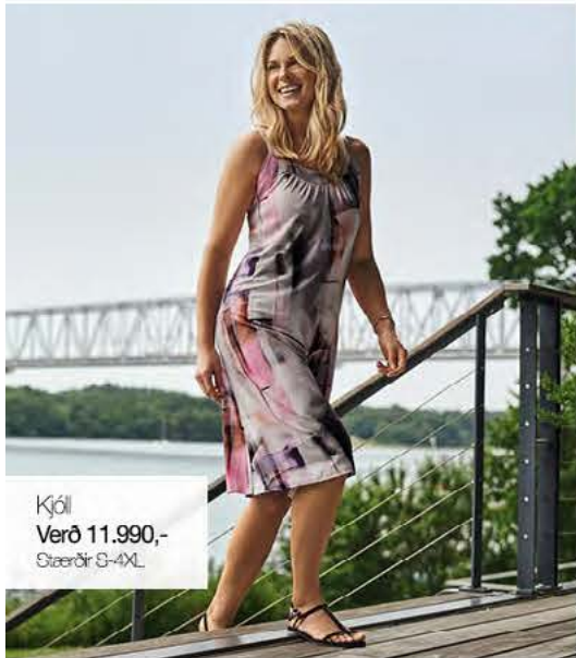
Kjól Verð 11.990,- Stærðir S-4XL