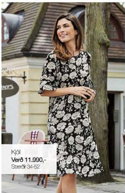
Kjól Verð 11.990,- Stærðir 34-52