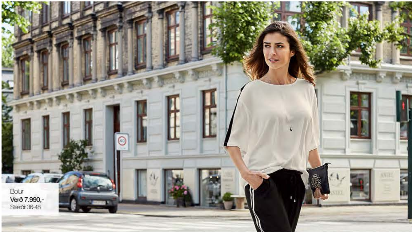
Bolur Verð 7.990,- Stærðir 36-48