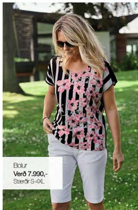
Bolur Verð 7.990,- Stærðir S-4XL