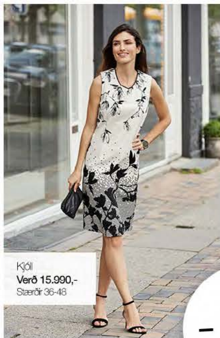
Kjól Verð 15.990,- Stærðir 36-48