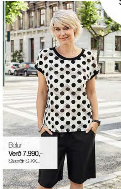
Bolur Verð 7.990,- Stærðir S-XXL