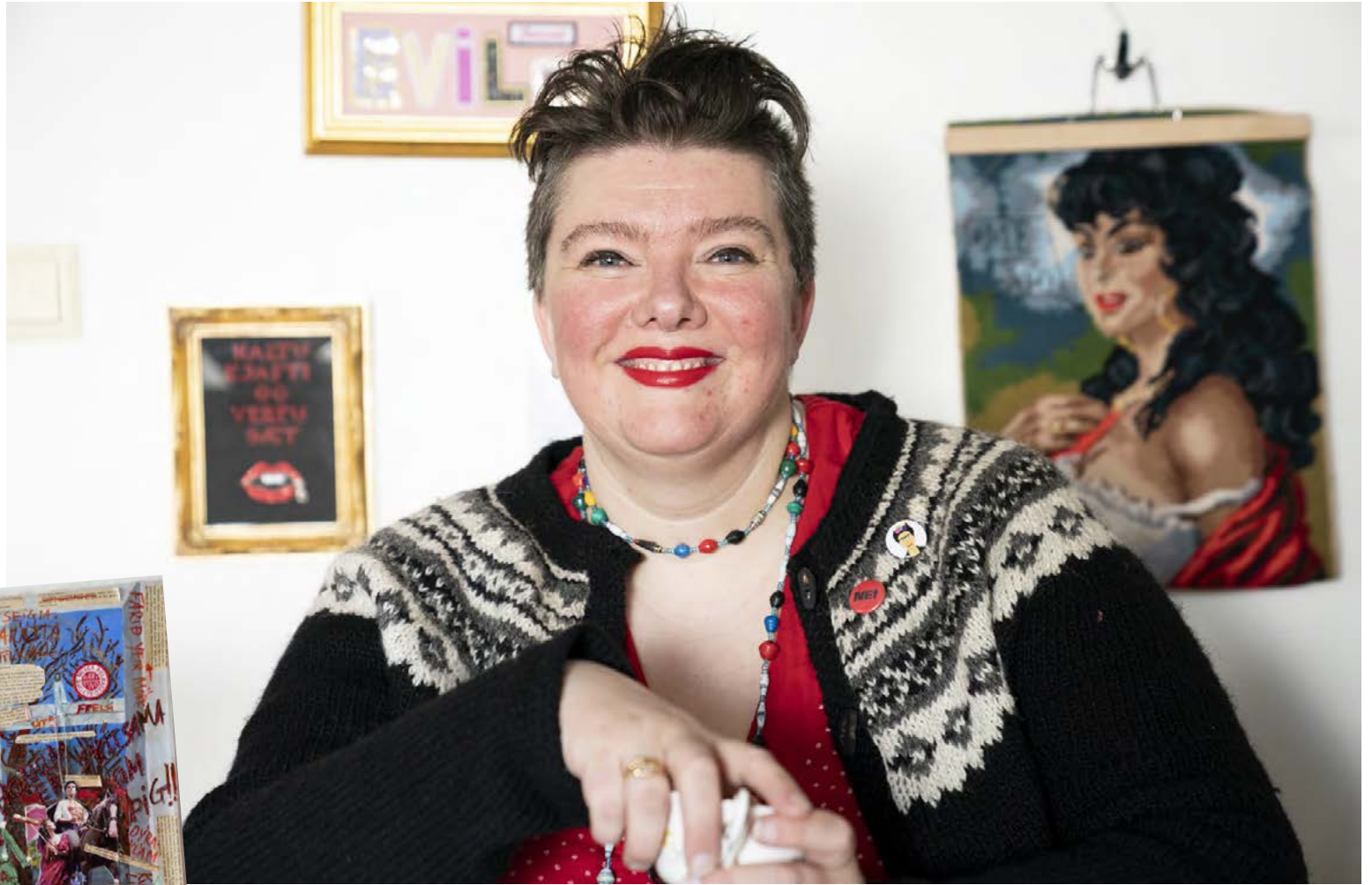
Sigrún segir hannyrðir notaðar í vaxandi mæli til andófs víða um heim.

„Þrátt fyrir listilega unninn útsaum og heimaprjón hafa hannyrðir sem kvennafag sjaldnast verið teknar alvarlega sem listform í karllægum listaheimi, heldur verið álitnar sem dund og dútl kvenna. Hannyrðir eru enn notaðar til að skrasetja söguna og eins og staða heimsmála er í dag, með aukna andúd á ýmsum trúarhópum og þjóðarbrotum, mikla fordóma og