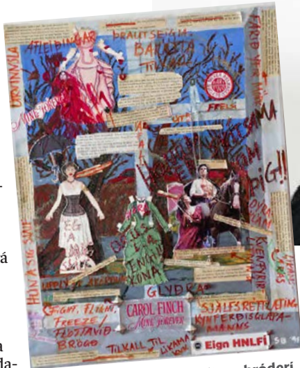
Sigrún tekur gamlar myndir og bróðeri og bætir við það graffi.

þjóðerniskennd, hefur hannyrðapönk orðið rísandi afl til að mótmæla þessu pólitiska reglugerðum um líkama kvenna því í sumum fylkjum má nú fangelsa konur fyrir það eitt að missa föstur. Af sömu ástæðu voru prjónaðar bleikar píkuhúfur til að mótmæla reglugerðum um rétt kvenna til föstureyðingar og getnaðarvarna, en þær mátti líka kalla kisuþúfur vegna þess að sett voru á þær lítil eyru til að gera þær tvíræðar. Þá sauma konur vestra sér búninga eins og sjá má í Handmaid's Tale og mæta í þeim á þingvallana til að mótmæla.“