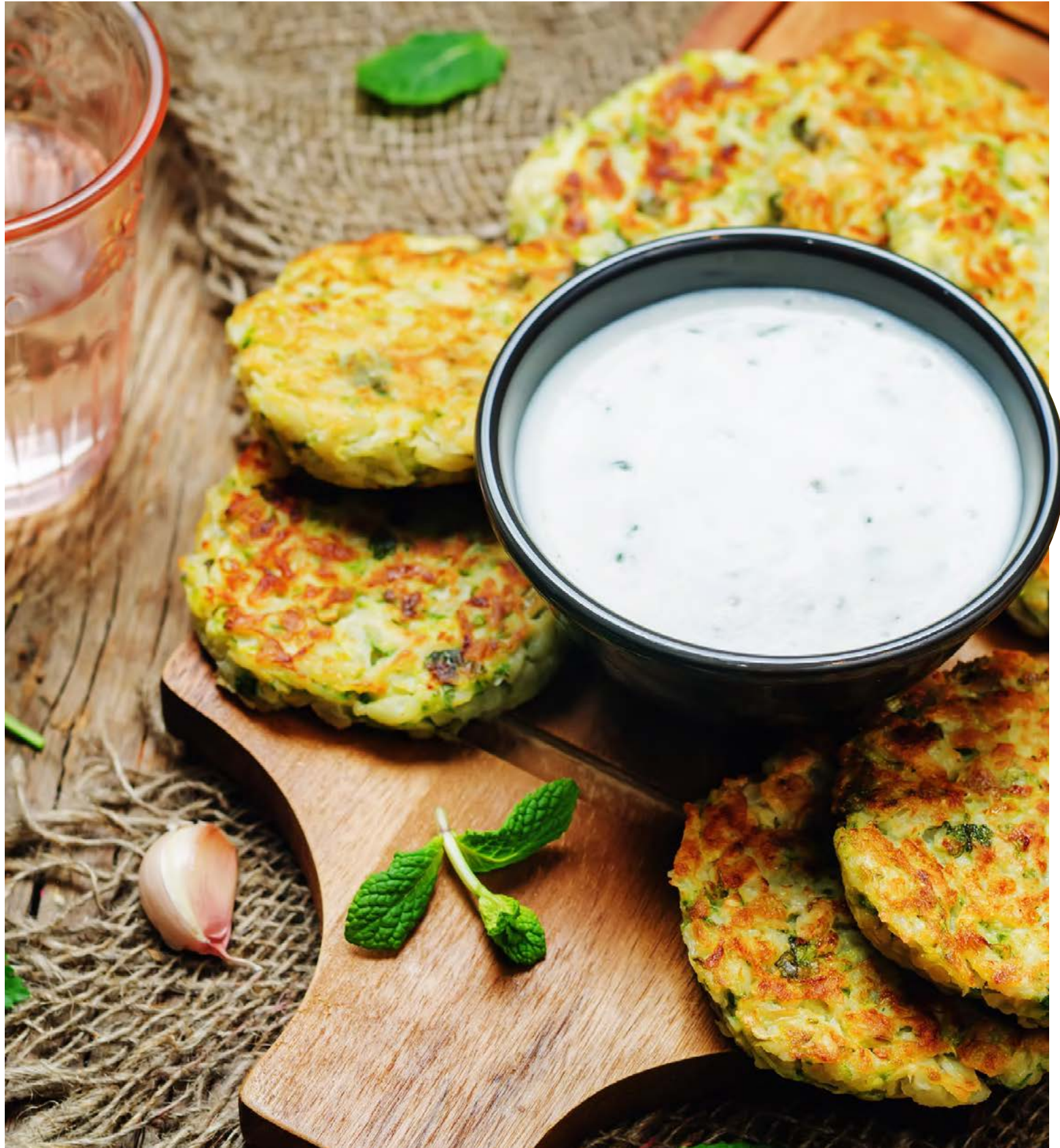
Grænmetisréttur er það sem þarf eftir sukk helgarinnar. Einfalt og fljótlegt á pönnuna.

Hellið jógúrtinni í skál og hrærið mangóchutneyið saman við. Berið klattana fram með spinati eða öðru káli og jógúrtdressingunni. www.taste.com