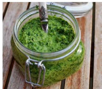
Ilmandi myntusósan hentar frábærlega með grilluðu lambakjöti.

Veltið heilum paprikum, eða bitum, og chilibelgjum upp úr jómfrúarolíu og grillið á blússhita þar til húðin á paprikunum fer að brenna. Eldið eggaldinið með sama hætti. Skerið lauk og hvítlauk afar smátt. Takið brenndu húðina af chilipiparnum og paprikunum og setjið þær í matvinnsluvélina með lauknum. Skafið innan úr eggaldininu og blandið saman við. Blandið að lokum sítrónusafa saman við og smakkið til með salti og pipar.