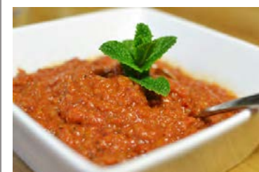
Dásamleg paprikusósa inniheldur m.a. papriku, chili og eggaldin.

Setjið myntu, kóriander og steinselju í matvinnsluvél ásamt grænum chili, hvítlauk og gróft hökkuðu epli. Brytjið vandlega í matvinnsluvélina. Blandið næst hlynsirópi, jógúrt og olíu saman við. Smakkið sósunu til með worcestershiresósu, garam masala og salti og pipar.