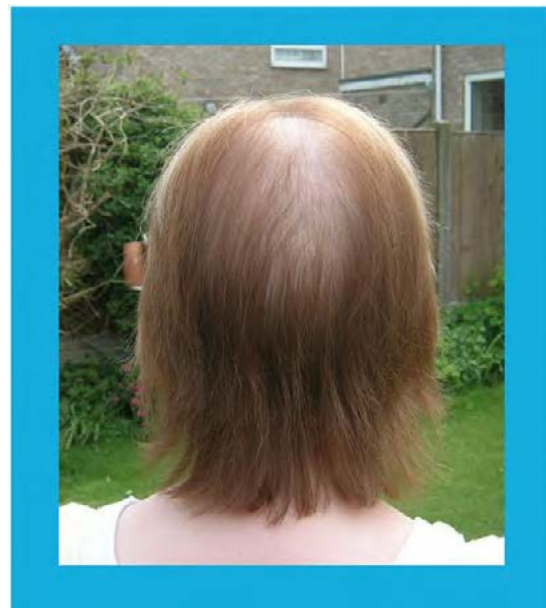
Þessi 63 ára kona fékk hárlos vegna skjaldkirtilsvandamáls. Hér sést árangur eftir 6 mánaða notkun á Nourkrin®.