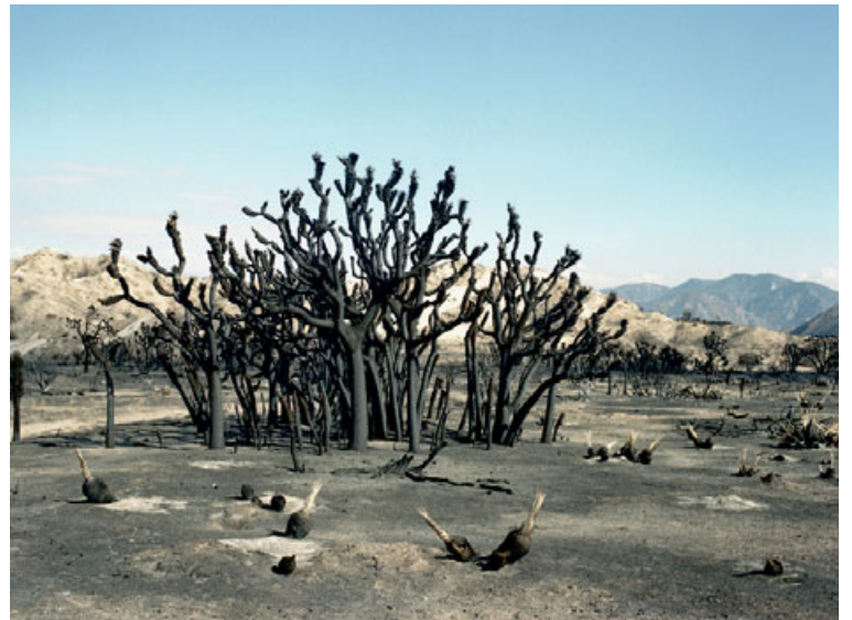
Ein mynda Friðgeirs úr seríunni Sand snjór sem byggir á ljósmyndum úr eyðimörkunum í Bandaríkjunum og frá snjónum á Íslandi.

Sölu menn: Atli Bergmann, atli@frettabladid.is, s. 512 5457 | Jón Ívar Vilhelmsson, jonivar@frettabladid.is, s. 512 5429 | Ólafur H. Hákonarson, olafurh@frettabladid.is, s. 512 5433