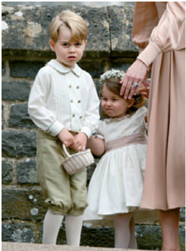
Fallegu konungbornu blómabörnin.