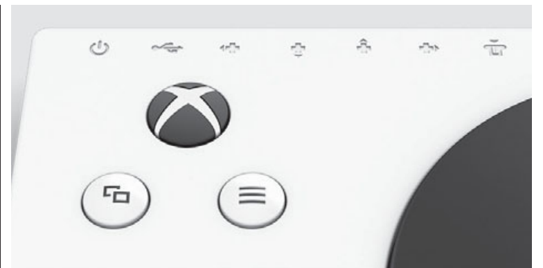
Það er hægt að tengja aukahluti við stýripinnann til að leysa af alla venjulegu takkana.

Það er líka hægt að nota nýja stýripinnann ásamt hefðbundnum stýripinna með því að hafa hluta af stýringunum á þeim nýja og hluta þeirra á hefðbundnum stýripinna, sem er þægilegt fyrir þá sem geta ekki notað báðar hendur.