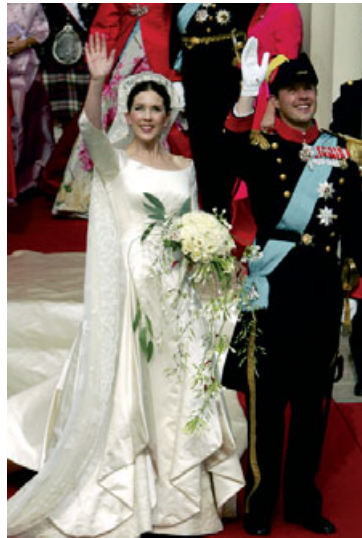
Friðrik krónprins og Mary Donaldson giftu sig 14. maí 2004.

14. maí 2004 í dómkirkjunni í Kaupmannahöfn. Þar með fékk hún nafnbótina krónprinsessa en hún verður drottning Danmerkur þegar Friðrik tekur við af móður sinni. Mary er frá Tasmaníu þar sem hún var alin upp á borgaralegan hátt. Danir hafa ávallt verið