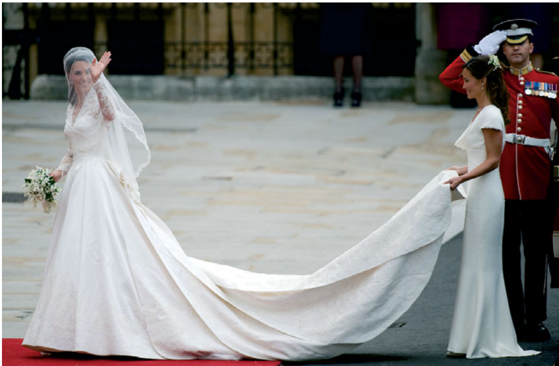
Katrín og Vilhjálmur prins giftu sig 29. apríl 2011.

Friðrik, krónprins Danmerkur, gekk í heilagt hjónaband með Mary Elizabeth Donaldson þann