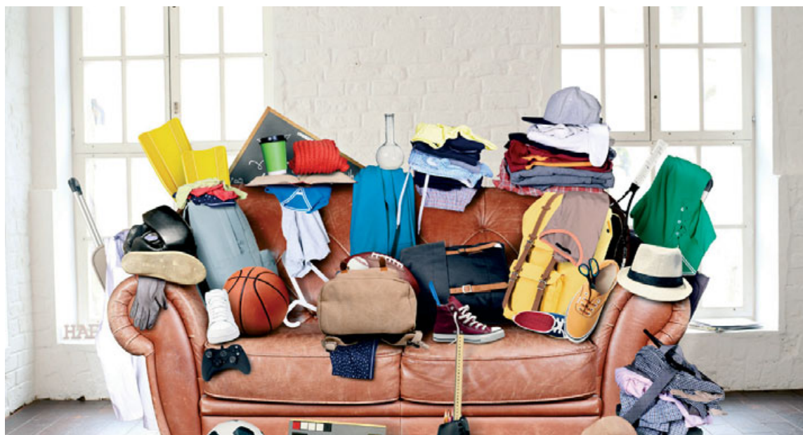
Geymslan er gjarnan full af bráðnaðsynlegum óþarfa.

Hvað dót á að halda upp á og hvað á að losa sig við þegar tekið er til í geymslunni? Það getur verið snúið að finna út úr því en ýmislegt er hægt að gera til að spara sér tíma og fyrirhöfn.