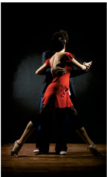
Háskólanemar taka sporið á Sólon á sunnudagskvöldið.

Börn Vilhjálms og Katrínar tóku þátt í brúðkaupi fyrir ári þegar frænka þeirra, Pippa Middleton giftist James Matthews.