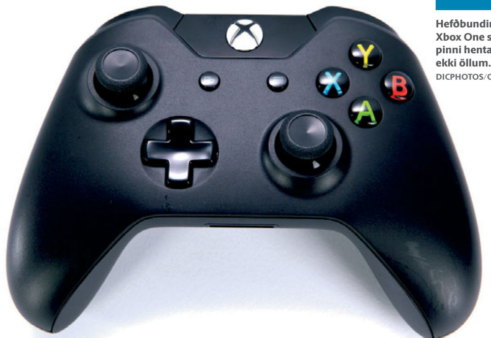
Hefðbundinn Xbox One stýripinni hentar ekki öllum.