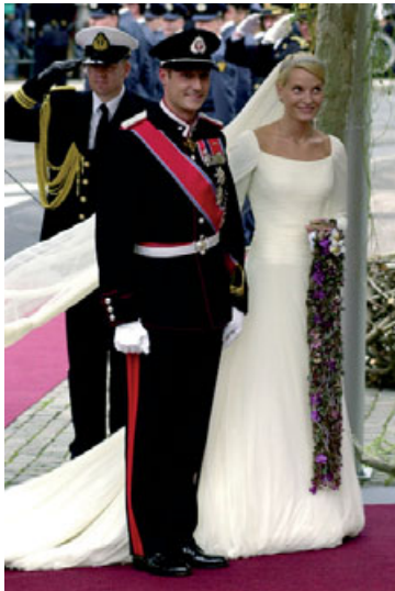
Hákon, krónprins Noregs, og Mette-Marit giftu sig í Ósló 25. ágúst 2001.

14. maí 2004 í dómkirkjunni í Kaupmannahöfn. Þar með fékk hún nafnbótina krónprinsessa en hún verður drottning Danmerkur þegar Friðrik tekur við af móður sinni. Mary er frá Tasmaníu þar sem hún var alin upp á borgaralegan hátt. Danir hafa ávallt verið