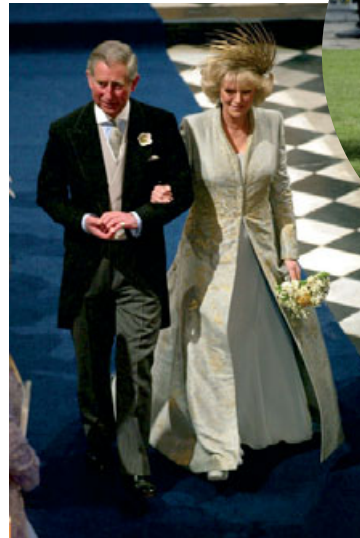
Karl prins og Camilla Parker Bowles giftu sig 9. apríl 2005.

ánægðir með val Friðriks en þau Mary eiga fjögur börn. Viktoría krónprinsessa í Svíþjóð giftist Daniel Westling 19. júní 2010. Þau kynntust þegar hann var einkabjálfi hennar. Daniel fékk nafnbótina prins þegar hann kvæntist Viktoríu og var gerður að