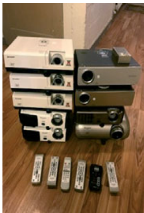
Til sölu Sharp og Toshiba skjávarpar. S. 869 9766