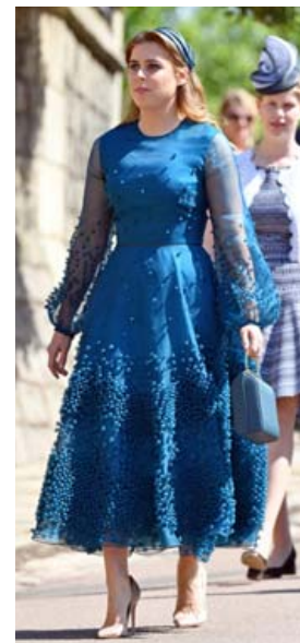
Beatrice prinsessa var í glæsilegum og sérstökum kjól frá breska tiskuhúsinu Rokanda.