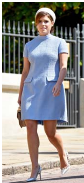
Eugenie prinsessa, dóttir Andrews Bretaprins, mætti á svæðið í glæsilegum sérhönnuðum Gainsburg kjól.