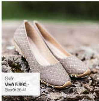
Skór Verð 5.990,- Stærðir 36-41