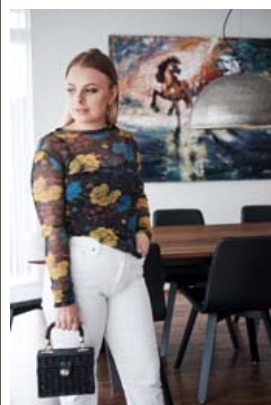
Bolurinn er úr Zara og buxurnar frá Uniqlo. Veskið er einnig úr Zara.

trendum segist hún fylgjast með Instagram og skoði Pinterest af og til. „Af því sem ég hef séð verða sumarlegir kjólar með blómamynstri áberandi á næstunni. Það verður líka vinsælt að blanda saman gömlum rokkbolum og finni flikum. Svo er ekki spurning um að glær veski, hlébarðamynstur og rautt og bleikt kombó verður í tisku í sumar," segir hún.