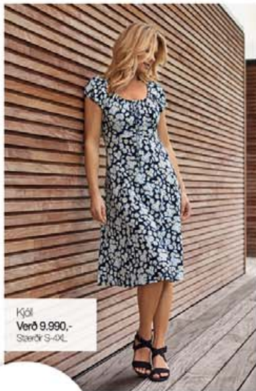
Kjól Verð 9.990,- Stærðir S-3XL