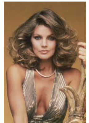
Glæsileg með blásið hári og stórar krullur á diskótímabilinu.