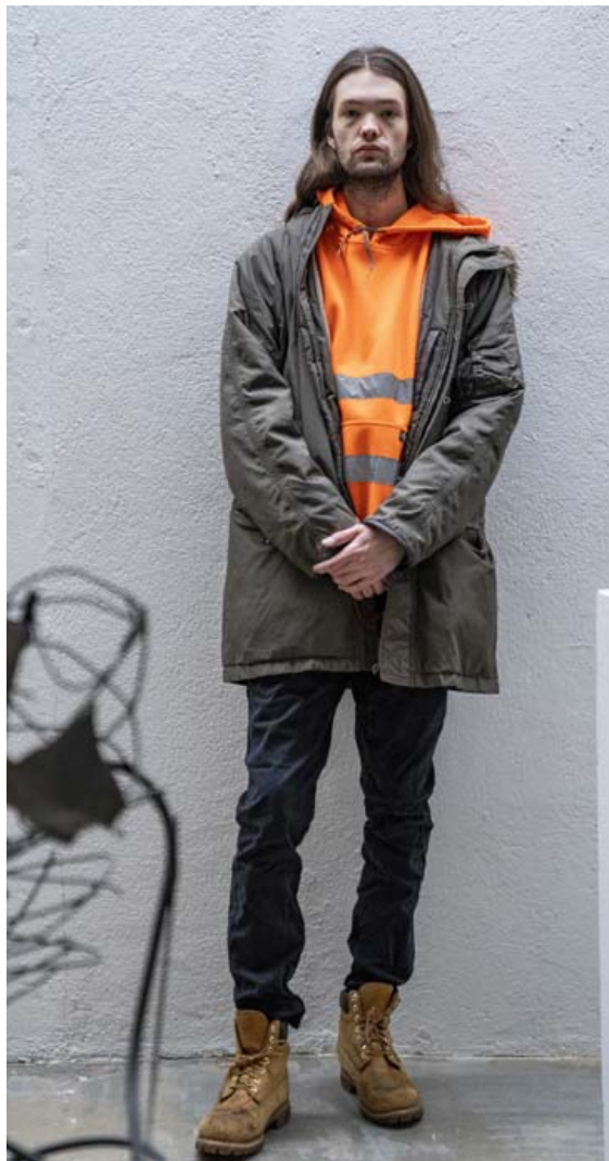
Appelsínugula peysan er ein af uppáhalds hettupeysum Þórðar, Dickies-peysa sem hann keypti í vinnufatabúðinni á Karl Marx Strasse í Berlín. „Þeir sem vinna við að þrifa Berlínarborg klæðast svona appelsínugulum fötum með endurskinsmerkjum. Mér fannst þetta svo gott lík að ég varð að stela því. Skórnir eru augljóslega Timberland-skór. Ég ætti kannski að þrifa þá en það er samt smá hluti af lífkinni.“

Ef ég kaupi eitthvað nýtt þá er það vanalega á flóamörkuðum eða í gegnum netið.