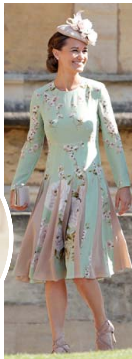
Pippa Middleton, svilkona brúðgumans var í kjól frá The Fold tiskuhúsinu sem minnti einhverja gárunga á umbúðir utan um grænt iste.