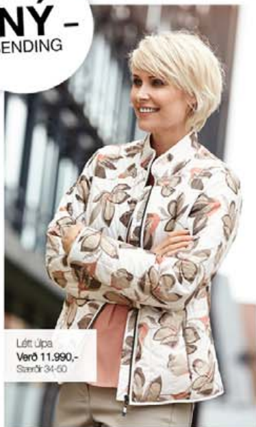
Létt Úpa Verð 11.990,- Stærðir 34-60