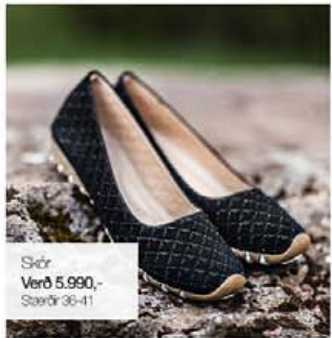
Skór Verð 5.990,- Stærðir 36-41