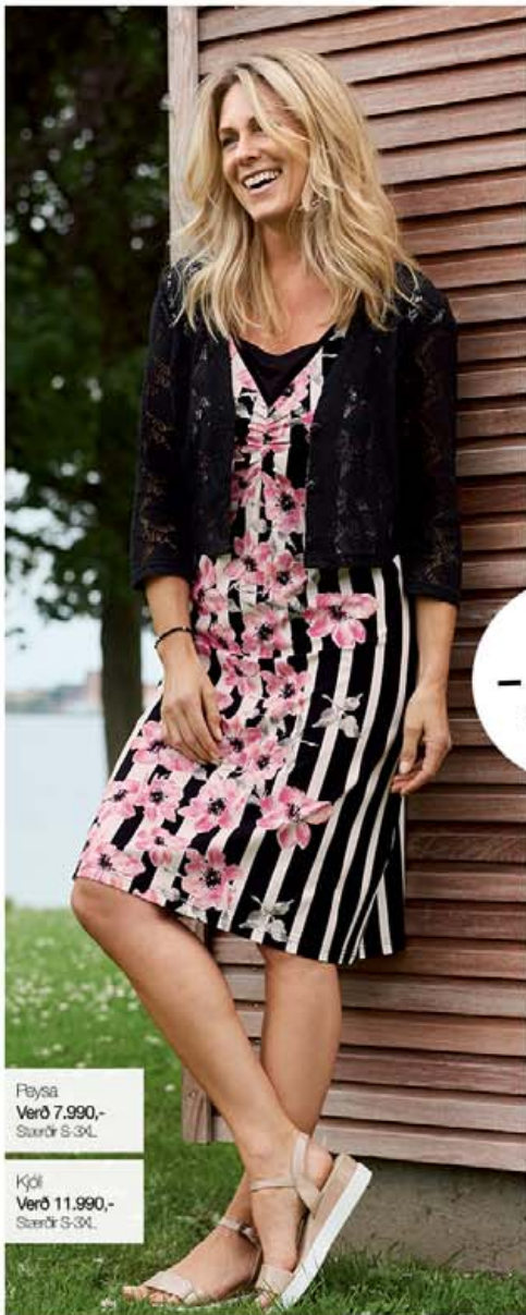
Flysa Verð 7.990,- Stærðir S-3XL