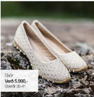
Skór Verð 5.990,- Stærðir 36-41