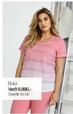
Bolur Verð 6.990,- Stærðir 38-56