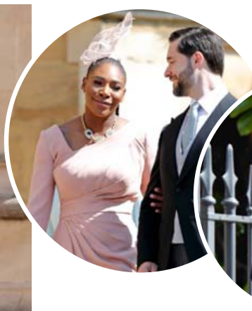
Tennisstjarnan Serena Williams er vinkona brúðarinnar og glæsileg á hverjum þeim velli sem hún leggur undir sig. Antíkleikur var áberandi lítur í brúðkaupinu en þessi tiltekni kjóll er frá Versace og hálsmenið frá Bulgari.