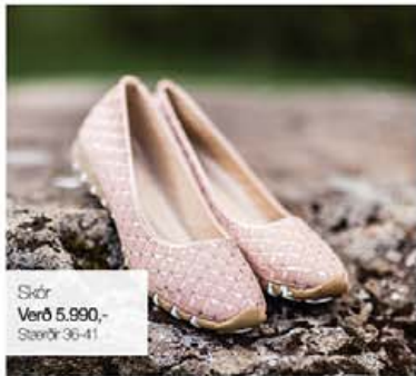
Skór Verð 5.990,- Stærðir 36-41