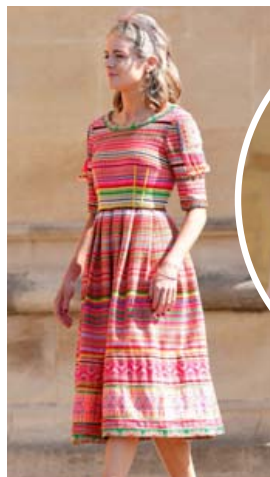
Cressida Bonas, fyrrverandi kærasta Harrys og leikkona, mætti í fallegum kjól frá Eponine London, hönnuði sem einnig er í miklum metum hjá Katrínu hertogaynju af Cambridge.