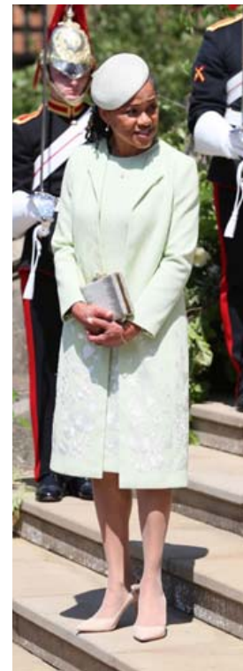
Flestir eru sammála um að móðir brúðarinnar, Doria Ragland, hafi stolið senunni með tignarlegri rösem og innri ljóma og sigldur kjólinn frá Óscar de la Renta spilti ekki fyrir.