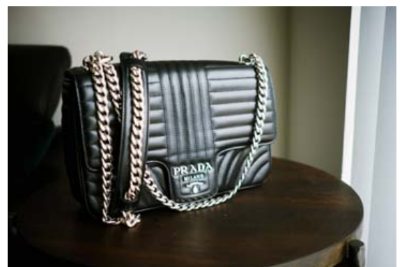
Guðný fékk þessa fögru tösku í Prada í Los Angeles.