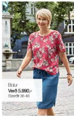
Bolur Verð 5.990,- Stærðir 36-48