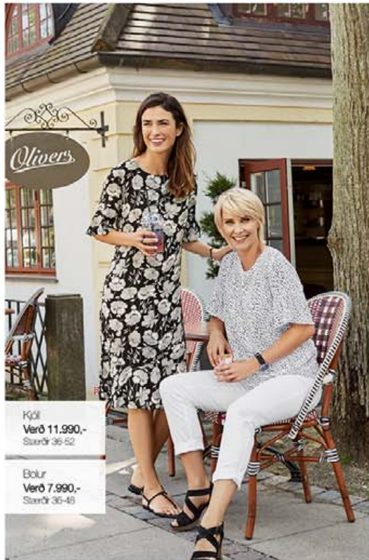
Kjól Verð 11.990,- Stærðir 36-52