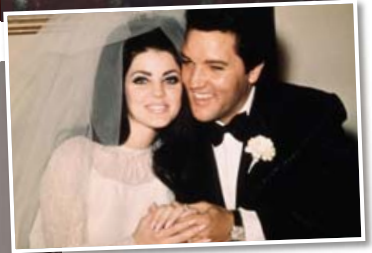
Priscilla og Elvis Presley á brúðkaupsdaginn, 1. maí 1967. Takið eftir tisku sjöunda áratugarins í hári, fórðun og brúðarskarti Priscillu.