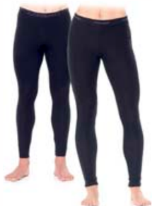
Everyday leggings dömu/herra 9.990 kr.