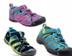
Frábærir KEEN barna sandalar 7.690 kr.

KEEN Evofit One herra/kvenna Góður stuðningur, lokuð tá 17.990 kr.