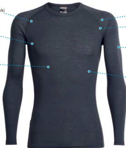
Everyday Crewe síðerma herra frá 9.990 kr.

100% Merino ull Bolir, húfur, jakkar, sokkar, vettlingar, leggings, nærföt