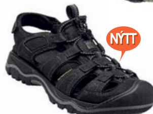
KEEN Rialto herra Leður, stillanlegt hælband og lokuð tá 21.990 kr.