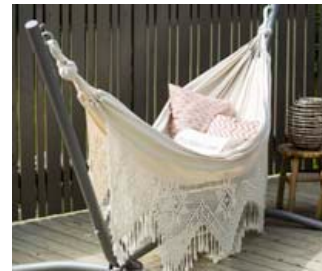
Soffia Dögg á tvö börn sem hafa mikið yndi af hengirúminu.