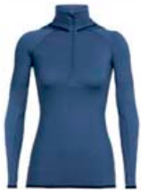
FluidZo hálfrennd með hettu 19.990 kr.