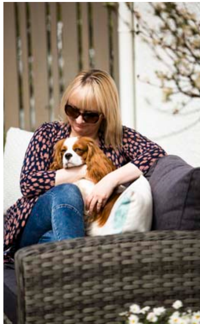
Hundurinn á heimilinu er ekki síður ánægður með nýja pallinn en aðrir í fjölskyldunni. Hann getur valseð áhyggjulaus um enda er þetta lokað svæði.