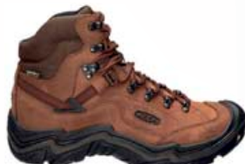
KEEN Galleo herra gönguskór með góðan stuðning 26.990 kr.