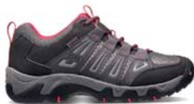
KEEN Oakridge kvenna lágir og fjölhæfir gönguskór 15.990 kr.