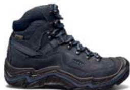
KEEN Galleo kvenna gönguskór með góðan stuðning 26.990 kr.