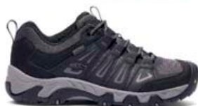
KEEN Oakridge herra lágir og fjölhæfir gönguskór 15.990 kr.