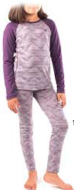
Oasis barnasett 10.990 kr.