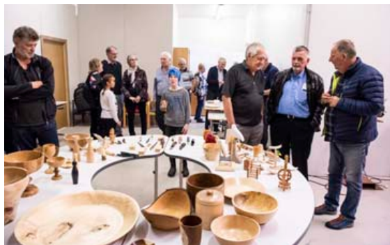
Margt var um manninn við opnun skúrsins í Hafnarfirði 1. júní síðastliðinn.

Karlar í skúrum er í Helluhrauni 8 í Hafnarfirði. Opið þriðjudaga frá klukkan 14 og fimmtudaga frá klukkan 10. Nánari upplýsingar hjá Herði á hordur@redcross.is