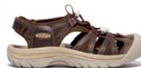
KEEN Venice II kvenna stillanlegt hælband, lokuð tá 15.990 kr.