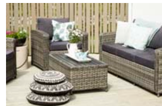
Soffia keypti sófasettið í Rúmfatlagernum og er mjög ánægð með þau kaup.