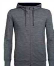
Shifter rennd með hettu herra 21.990 kr.