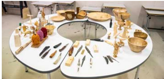
Margt fagurra muna er að finna í vönduðu handverki karlanna í skúrnun.