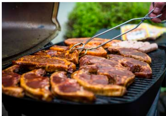
Kryddaðar lambatvirrifjur og lambalærisseiniðar eru vinsælastar á grillið frá SS.

SS kemur frá bændum á Suður- og Vesturlandi.