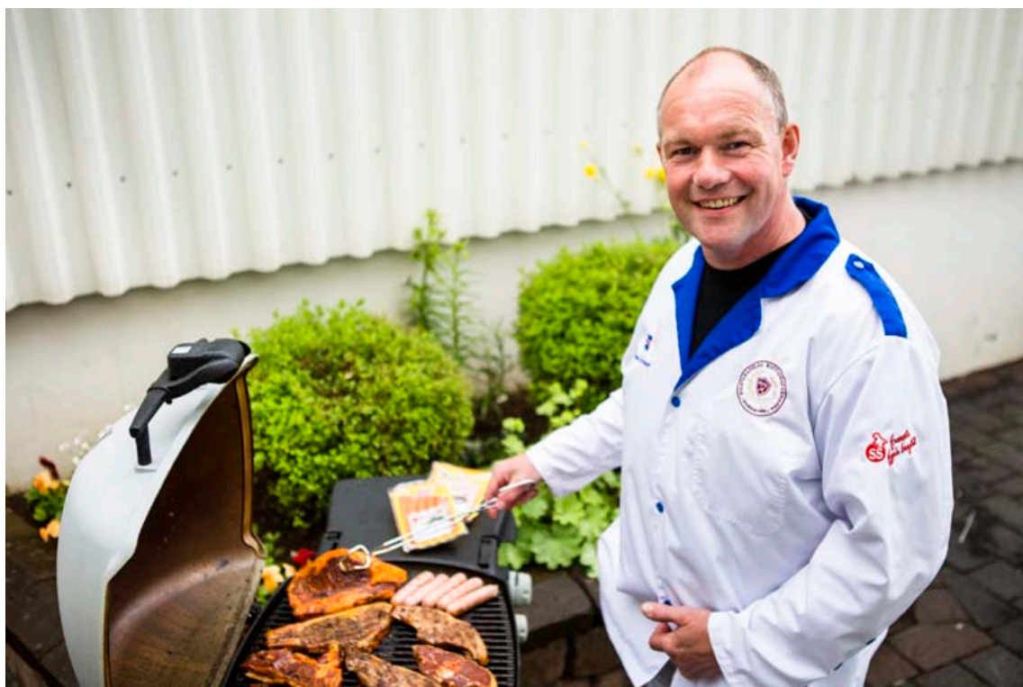
Oddur er hrifnastur af íslensku lambakjöti og nautakjöti á sumargrillið en segir ómissandi að grilla nokkrar SS-pylsur með í forrétt. MYNDIR/ERNIR