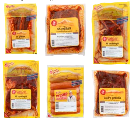
Hér sést hluti af girnilegri grillinu SS eins og hún lítur út í kjöttælum landsins.

„Upphald mitt á grillinu er íslenskt lambakjöt og nautakjöt," segir Oddur sem er annálaður sæl-