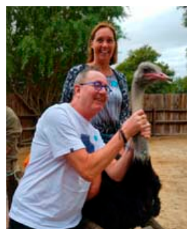
Meðal þess sem fer fram í ferðinni er heimsókn á strútábúgarð.

fluttum við svo endanlega til Suður-Afríku og tókum yfir rekstur á hótelinu og veitingastaðnum.“