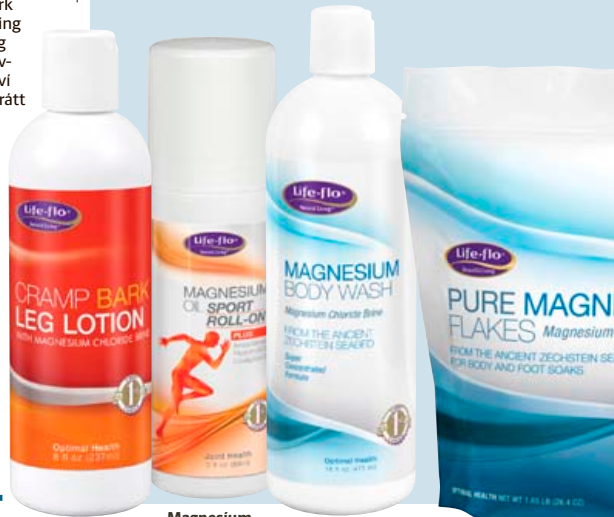
Magnesíum og Cramp bark krem.

Life-flo vörulína fæst í verslunum Heilsuhússins, Apótekinu og á Lyfja.is