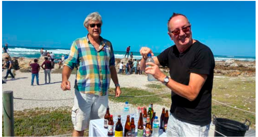
Ferðin er fjölbreytt enda margt að sjá og skoða. Og smakka en hér má sjá bjórsökkun á ströndinni.