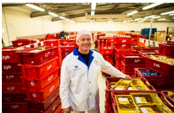
Íslendingar borða fleira en SS-pylsur því Oddur segir þá sólgna í SS-grillkjöt.