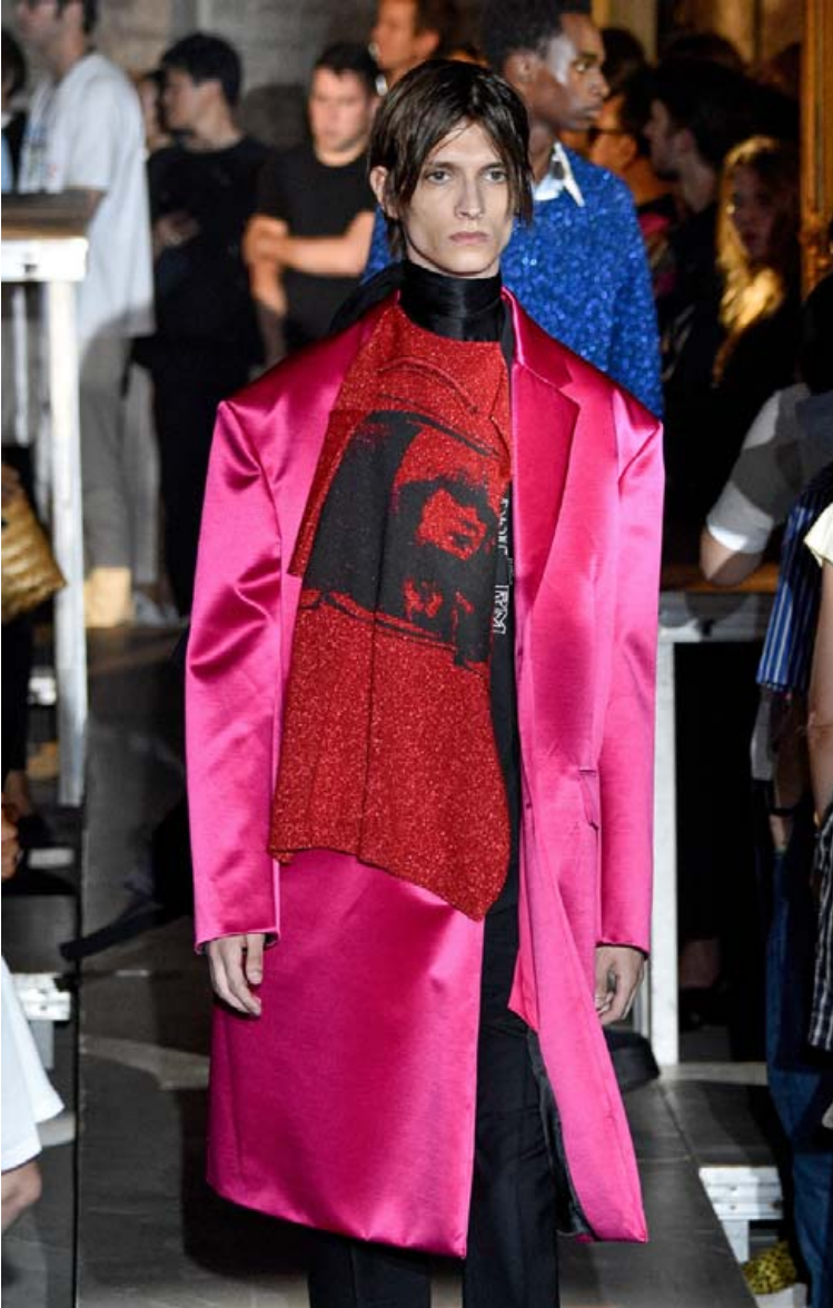
Fatnaðurinn frá Raf Simons var í dramatískara lagi og litríkir kvöldfrakkar úr satínefnum í bland við áprentuð voru áberandi.