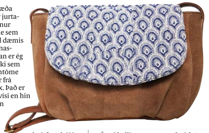
Allar þessar glæsilegu töskur eru unnar án dýraafurða.