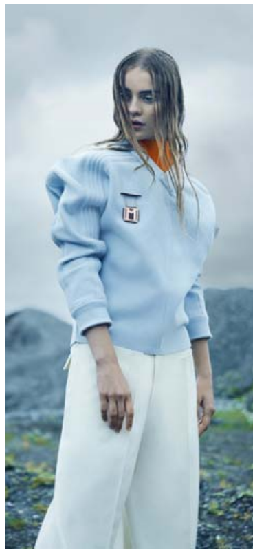
Þetta dress er sömuleiðis úr ArtEZ Mini Collection 2015 frá Sunnu.

flikur og allt sem er hægt að tjá með minnstu smáatriðum í frágangi og efnisvali – alla litlu „núansana“. Ég er mikil áhugamanneskja um myndarsköpun.