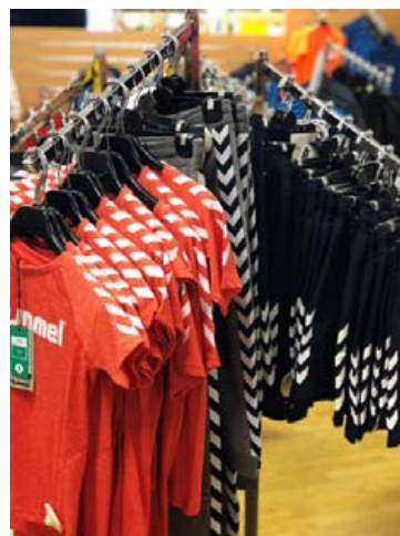
Íþróttafatnaður frá Hummel.

Litrikir og frisklegir íþrótt- og gönguskór fyrir dómuna frá Skechers.