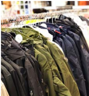
Úlpur og vindjakkar fást í úrvali.

Dórothea sem tekist hefur vel að viðhalda gamla, góða andanum.