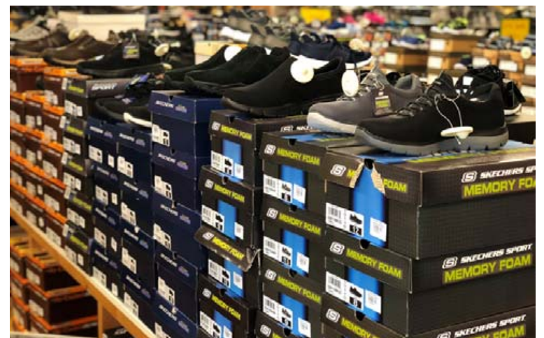
Dásamlega þægilegir gönguskór fást á frábæru verði í Álnavörubúðinni.