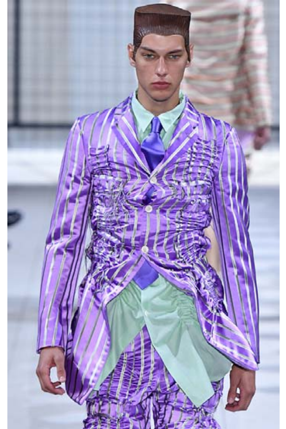
Hönnuðirnir hjá Comme des Garçons leggja áherslu á bjarta pastellití, silki og satín, rómantísk snið.