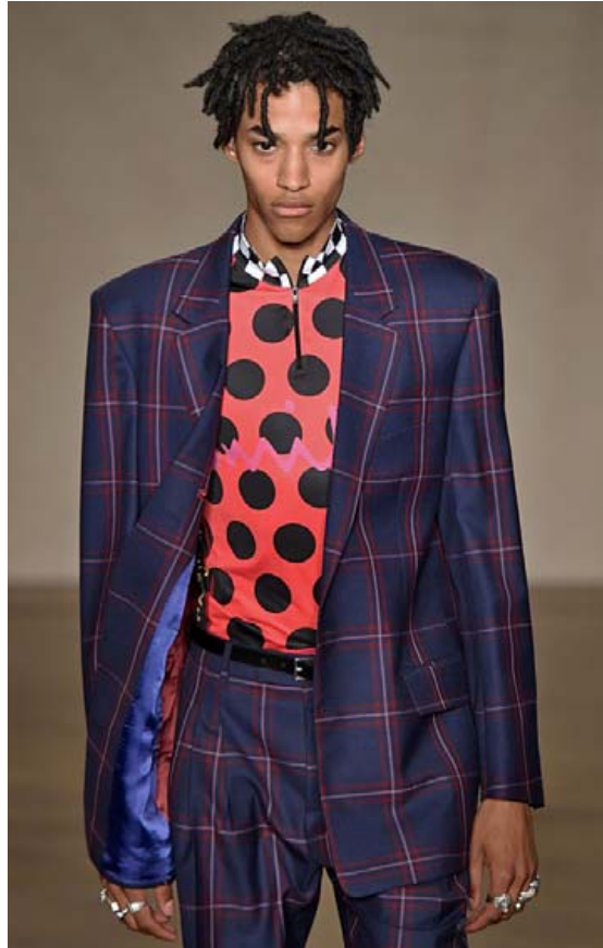
Á Paul Smith sýningunni var áherslan á sigild snið um leið og leikið var með liflega liti og áberandi myndur.