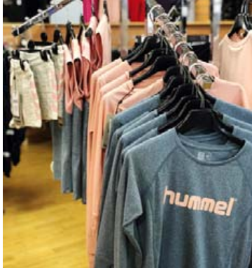
Í Álnavörubúðinni fæst nýjasta tiska á enn betra verði en gerist og gengur.