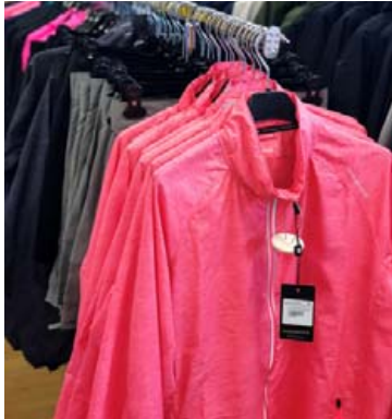
Æfingafatnaður frá Endurance.