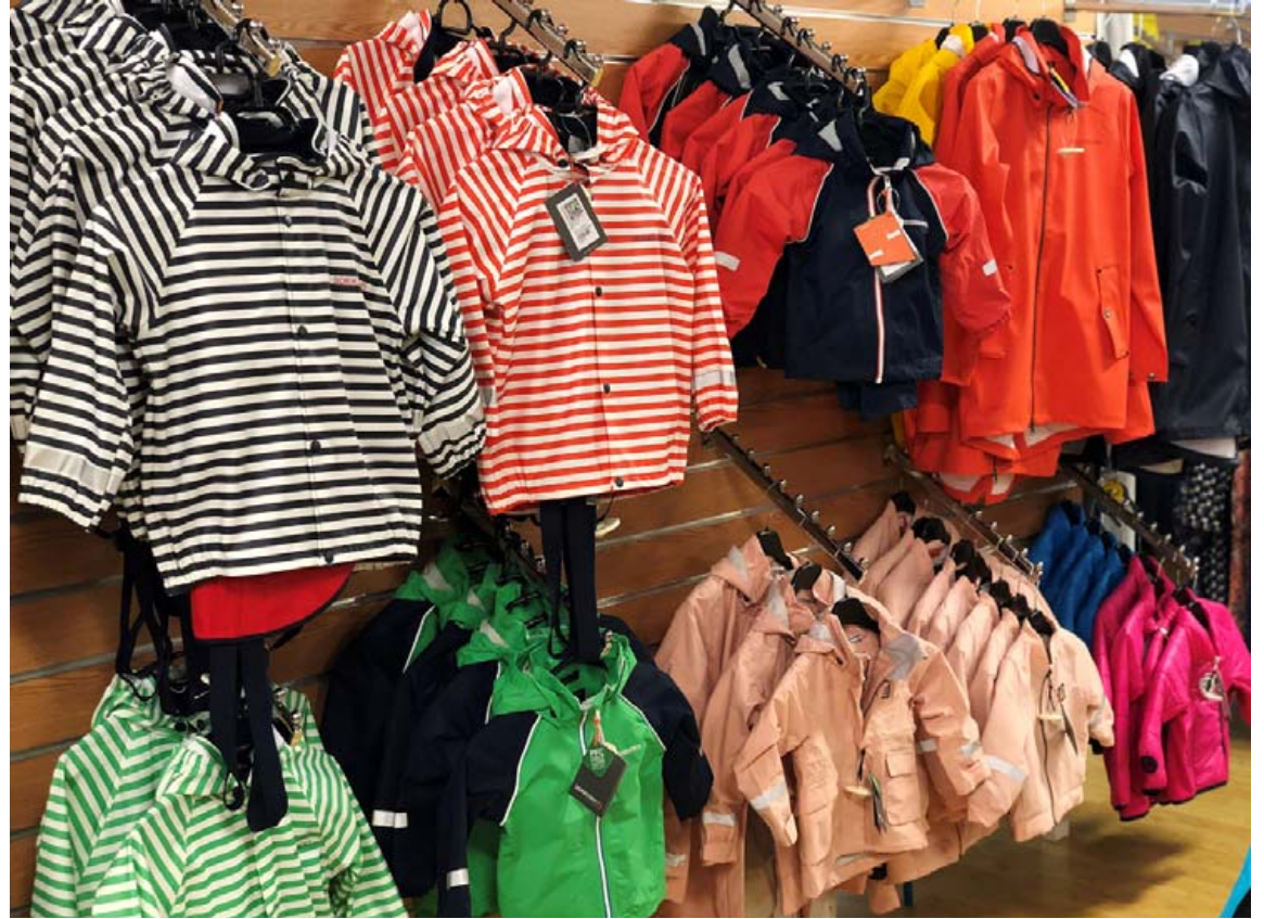
Litrikir pollagallar og hvers kyns útivistarfatnaður fyrir börnin fæst á ómóttstæðilegu afmælistilboði um helgina.

Álnavörubúðin er í Breiðumörk 2 í Hveragerði. Opíð mánudaga til laugardaga frá 10 til 18 og á sunnudögum frá 11 til 17. Sími 483 4517. Sjá nánar á alnavorubudin.is og Facebook.