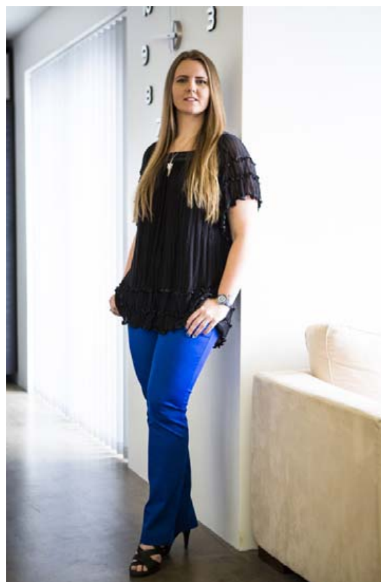
Fylgihlutir gera mikið fyrir heildarútlitið og upplifunin af fatnaðinum breytist við að skipta þeim út, að sögn Ólafar,