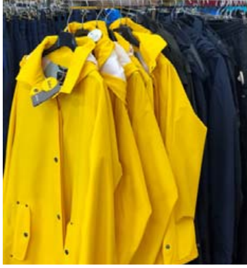
Didrikson-regnkápur á fullorðna.