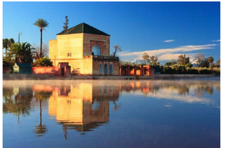
Marrakesh á sér langa og merka sögu og þar er að finna sögulegar minjar allt frá miðöldum því snemma var byrjað að vernda hana fyrir eyðileggingu.

Fimmtudaginn 5. júlí mun Fréttablaðið í samtarfi við Ungmennafélag Íslands gefa út aukablaðið