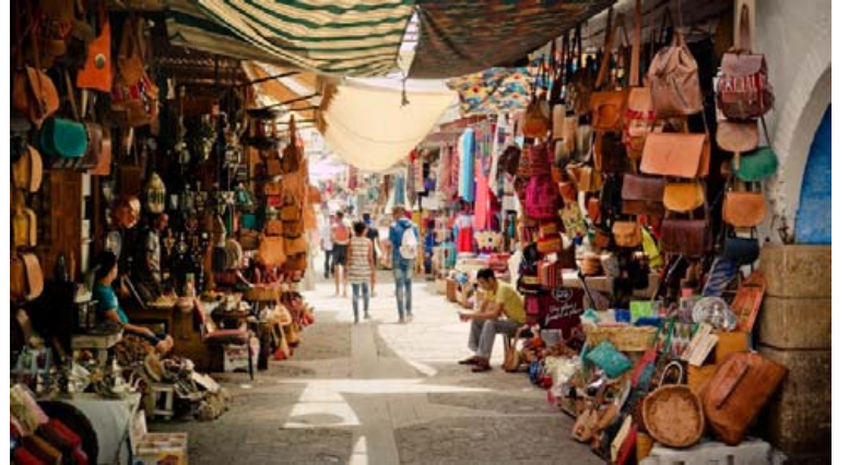
Arabískur risamarkaðurinn á Jemall el-Fna torginu iðar af mannlífi og þar er hægt að fá allt milli himins og jarðar, eða frá filum og upp í ævagamlar nálar.

Nánari upplýsingar má fá á www.urvalutsyn.is/borgir .