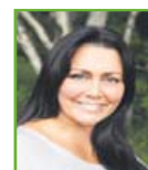
Bryndis GSM: 773 7400

talent@talentradning.is bryndis@talentradning.is Sími: 552-1600