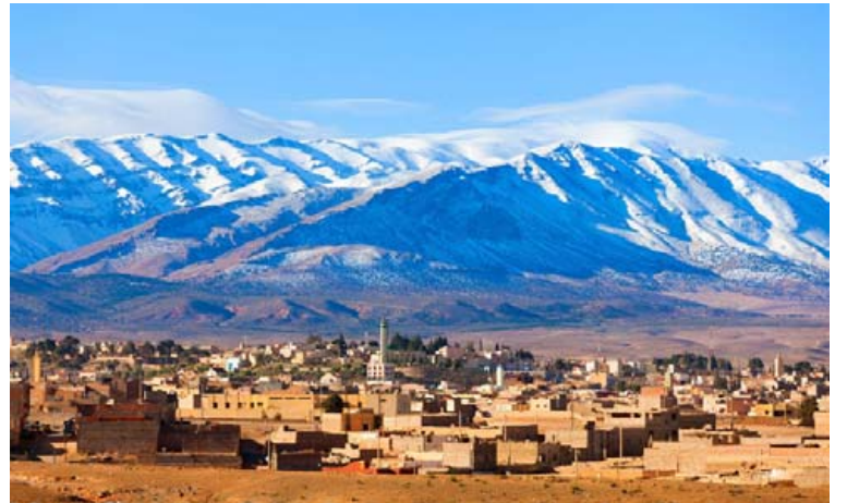
Á ferð um Atlasfjöllin er margt að sjá og upplifa. Heiðar segir að gestir fái einstakt tækifæri til að heimsækja innfædda og þiggja hjá þeim te og braud.