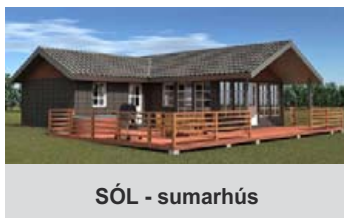
SÓL - sumarhús