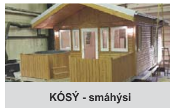
KÓSÝ - smáhýsi

Láttu drauminn um nýtt heimili verða að veruleika með vönduðu og hagstæðu húsi frá Húseiningu.