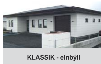
KLASSIK - einbýli