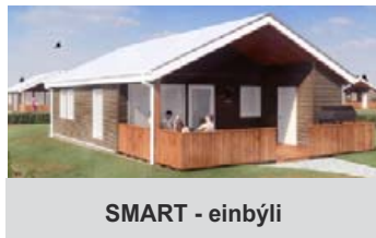
SMART - einbýli

Kíkið á vef okkar: www.huseining.is og sjáið lóðaframboðið!