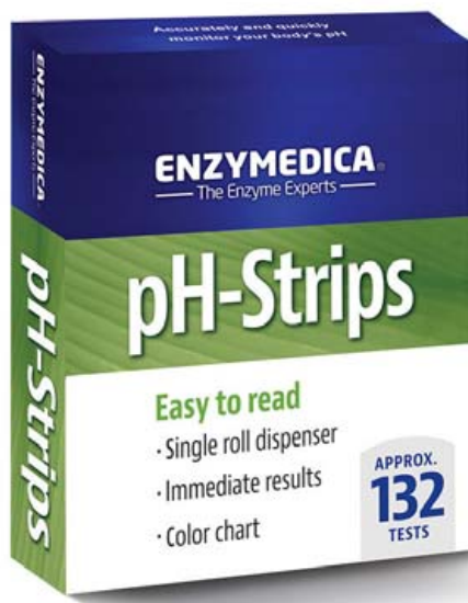
Tekur einungis nokkrar sekúndur að fá niðurstöðu.

Öll efnaskiptaferli líkamans eru háð því að sýrustig líkamans sé rétt og haldist í jafnvægi. Sýrustig í þvagi sveiflast aðeins upp og niður milli daga og einnig innan dagsins en þó er það yfirleitt innan ákveðinna marka. Líkaminn er í raun að halda sýrustiginu í jafnvægi með því að skila frá sér mis súru eða basísku þvagi. Langvarandi súrt (og stundum mjög basískt) ástand getur gefið til kynna undirliggjandi sjúkdóm.