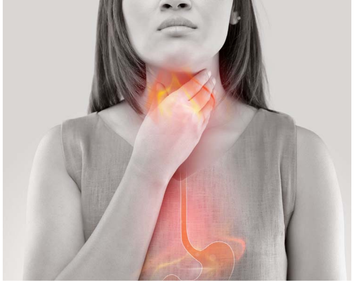
Brjóstsviði, nábitur eða bakflæði í kjölfar máltíða getur verið sársaukafullt. Acid Soothe getur komið í veg fyrir það.

Eins og áður sagði er algengast að slakur hringvöðvi við efra magaop valdi bakflæði (brjóstsviða) en það