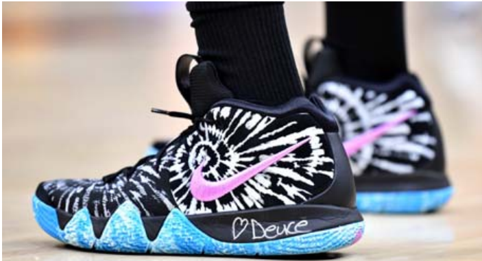
Sannarlega skrautlegir Nike Kyrie 4 skór sem Jayson Tatum, leikmaður Boston Celtics, klæddist í leik fjögur í úrslitum Austurdeildarinnar gegn Cleveland Cavaliers.