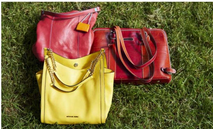
Guðný er mikið fyrir fylgihluti, skó og töskur sem hún á í ýmsum glaðlegum litum.