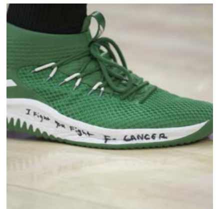
Marcus Smart, leikmaður Boston Celtics, í viðeigandi grænum lit í skóðum frá Adidas gegn Philadelphia 76ers í annarri umferð úrslitakeppinnar.