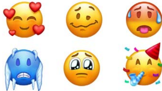
Aukin fjölbreytni verður í tjáknunum frá Apple á þessu ári.

geti síðar á árinu valið fleiri háraliti á tjáknin heldur en áður hefur verið unnt. Flestir snjallsmaeigendur senda einhvers konar tjákn þegar þeir skrifa inn á Facebook, senda sms eða spjalla á Messenger. Tjáknin sýna líðan sendandans. Tjáknin eru mjög góð hjálpartæki í skrifuðu máli því þau segja heilmargt en þau ætti samt ekki að nota í vinnunni. Þau eru til daglegrar notkunar í einkalífínu.