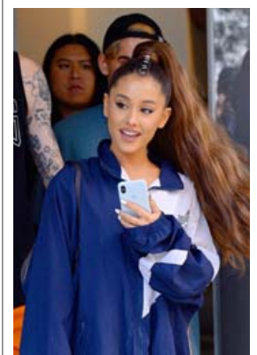
Ariana Grande á labbinu á Manhattan í New York í lok júní.