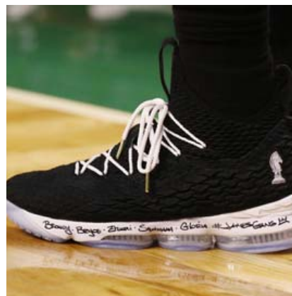
LeBron James, leikmaður Cleveland Cavaliers, klæddist þessum svörtu Nike-skóðum í leik sjö í úrslitum Austurdeildarinnar gegn Boston Celtics.

Skeifunni 8 • 108 Reykjavík • Sími: 517 6460 • www.belladonna.is