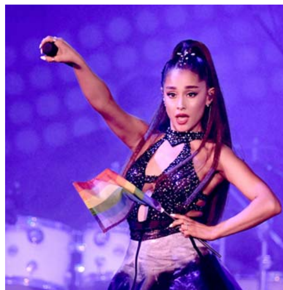
Ariana Grande kom fram á HeartRadio-tónleikum á Banc of California Stadium 2. júní þar sem hún vakti mikla athygli enda flott á sviðinu.

til að minnast hryðjuverkaárásarinnar í Manchester á síðasta ári. Það er meðal laga á nýju plötunni sem kemur út eftir mánuð. Ariana er með 121 milljón fylgjenda á Instagram og kemur hún þar á eftir Kim Kardashian og Beyoncé. Þær tvær síðarnefndu hafa undanfarið tekið upp hárstíl Ariönu en hún er þekkt fyrir að greiða hárið alltaf í hátt tagl. Ariana Grande verður á forsiðu tiskutimaritsins ELLE í næsta mánuði.