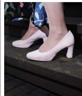
Bleiku skórnir eru iðillfagrir og hægt að spila í þeim líka en bara ef tónleikarnir eru ekki lengri en hálf tími.