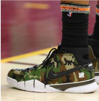
Marcus Morris, leikmaður Boston Celtics, klæddist Nike Kobe 1 Pro skoðum í leik gegn Cleveland Cavaliers.