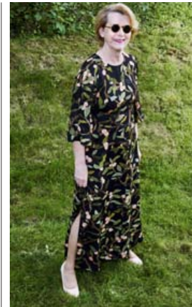
Kjóllinn úr Geysi og skórnir góðu sem fara svo vel saman að eftir er tekið.

Miða má nálgast á tix.is en allar upplýsingar er að finna á Facebook undir Mozartmarabon – tónleikaröð og á heimasíðunni gudnygundmunds.com