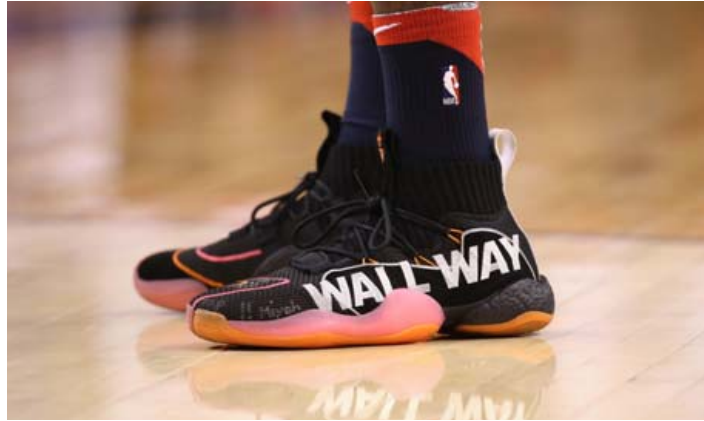
John Wall, leikmaður Washington Wizards, í Adidas-skónum sínum í leik gegn Toronto Raptors í fyrstu umferð úrslitakeppinnar. Wall skrifaði undir risasamning við Adidas í vetur.