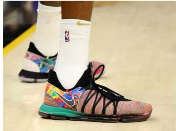
Kevin Durant klæddist þessum litfögru Nike KD 10 í fjórða leik úrslitakeppinnar gegn Cleveland Cavaliers.