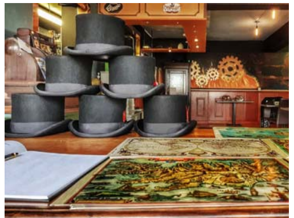
Í gufupönksetrinu í Dularfullu búðinni má kaupa ýmsan varning sem ber keim af síðviktorianska tímabilinu og framtíðarsýn þess.

Aðspurður hvað hafi dregið hann að gufupönkinu segir Ingimar það hafa verið nokkurs konar sagnfræðihugi. „Ég held að ég hafi alltaf verið svolitíð hrifinn af möguleikanum á annars konar sögu, svona ef hlutirnir væru ekki eins og þeir