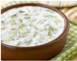
Gúrku má nota á margan hátt.