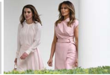
Rania drottning og Melania Trump þegar þær hittust í Hvíta húsinu í lok júní.