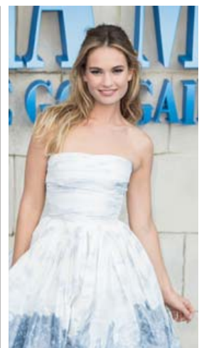
Lily James fer með hlutverk Donnu á yngri árum og fær góða dóma.

Það eru liðin tíu ár frá því fyrri myndin var frumsýnd og eignaðist milljónir aðdáenda. Heil tía ár frá því löginn Dancing Queen, Take a Chance on Me og Super Trouper lifnuðu víð á hvíta tjaldinu. Í nýju myndinni syngur Cher hið þekktu lag Fernando til Andy Garcia og hann tekur undir. Þau þykja fara á kostum. Aðdáendur Abba fá að heyra mörg lög í þessari nýju mynd og margar minningar vakna hjá þeim hópi sem upplifði hljóm-sveitina á áttunda áratugnum.