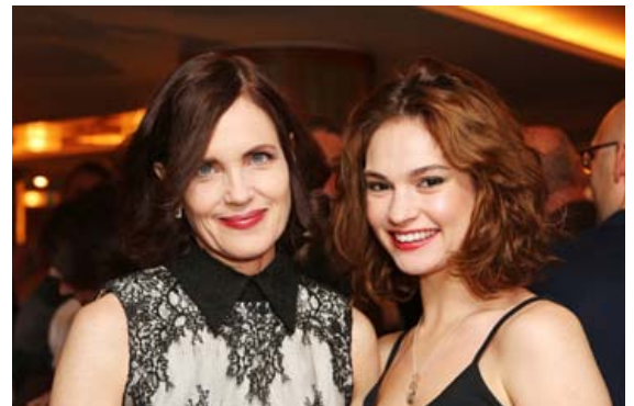
Elizabeth McGovern og Lily James í partí sem haldið var til heiðurs þáttunum Downton Abbey. Þær eiga báðar áttíð að reykja til Bandaríkjanna.

Samkvæmt gagnrýnanda CNN kemur Lily með ferskan andblæ inn í kvikmyndina ásamt Cher,