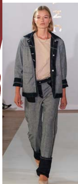
Denim on denim, gallajakki og buxur þar sem efninu er snúid við.