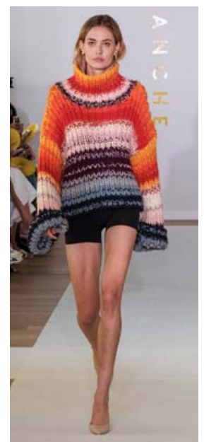
Stórglæsileg þrjónapeysa í fallegum litum ætti vel við íslenskt sumar.