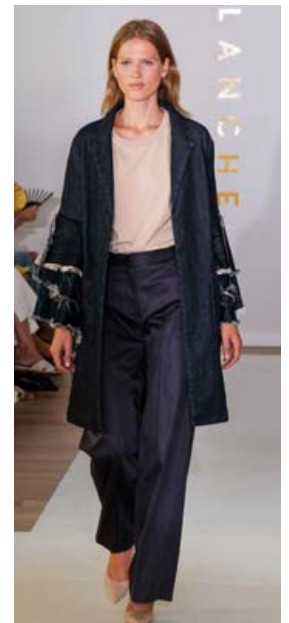
Hólkviðar gallabuxur og kápa í stíl