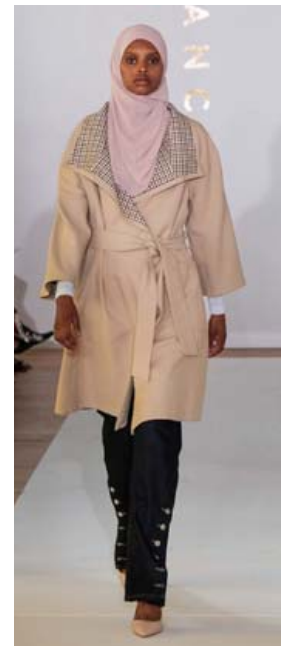
Klæðileg kápa sem ætti að falla vel í kramið hjá nútíma kjarnakonum.