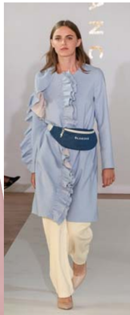
Pifur setja sparilegan svip á þennan sumarlega kjól.

Blanche var sett á laggirnar fyrir einungis einu ári. Það þykir fara afar vel af stað.