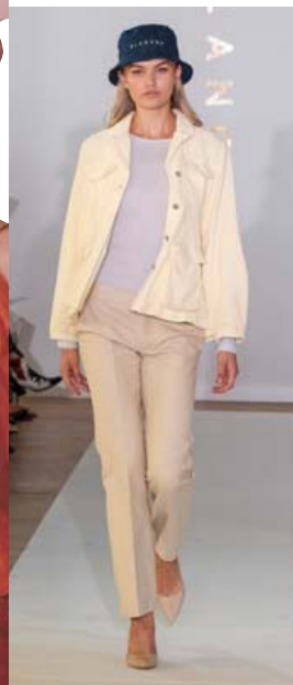
Lífrænt og umhverfisvænt eru einkunnarorð hönnuða Blanche.