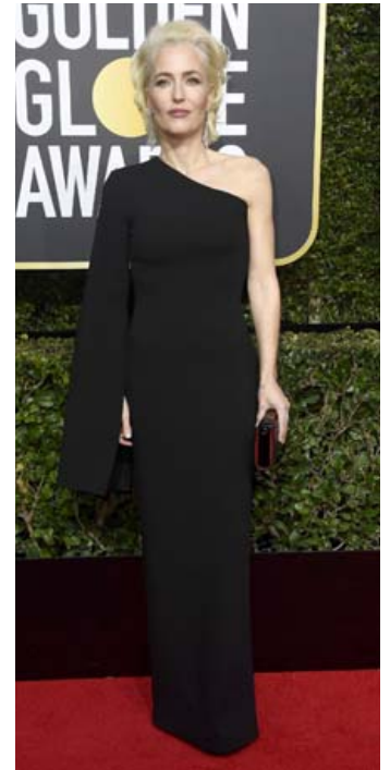
Anderson var glæsileg í kjól frá Solace London á Golden Globe verðlaunahátíðinni í janúar.