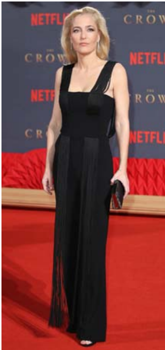
Töffari í svörtum samfestingi frá Galvan á frumsýningu The Crown í fyrra.