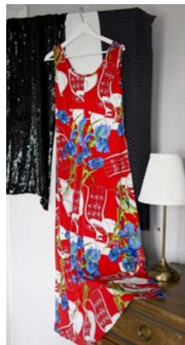
Edda segist vera litaglöd og hrifst af fallegum og vel sniðnum kjólum.

„Gegnum árin, þó ég sé löngu hætt að selja kjóla, þá stent ég ekki fallegan kjól. Ef ég sé einhverja lekkera kjóla þá kaupi ég þá.“