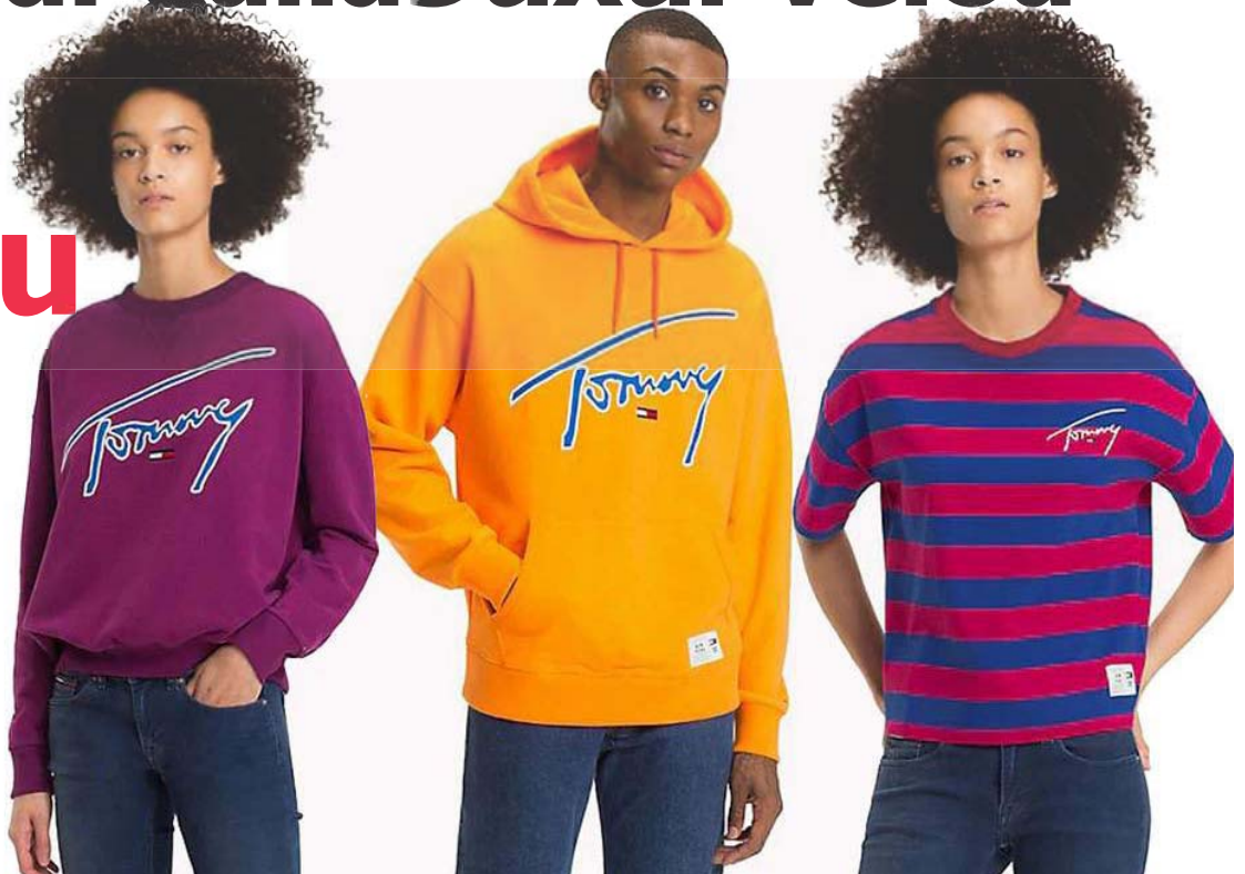
Hluti af Tommy Jeans Xplorers snjallfatalínunni sem verðlaunar hvorn þann sem klæðist henni með tónleikamiðum og vildarvinaveislum.

Tommy Hilfiger setti um daginn á markað snjallfatalínuna Tommy Jeans Xplore þar sem hægt er að safna punktum og gögnum en aðeins með því að ganga í fötum úr línunni.