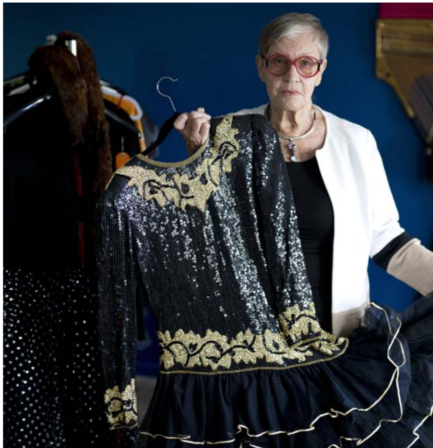
Edda segist lítið skeyta um merki eða hönnuði heldur segir hún að fallegur kjóll standi alltaf fyrir sínu.