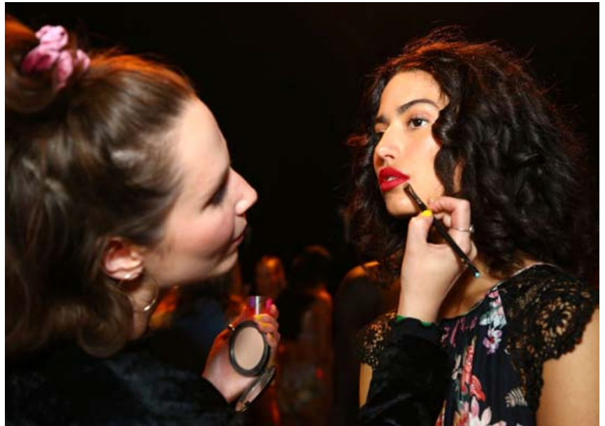
Hamagangur baksviðs á sýningu ástralska tiskuhússins David Jones í Sídney í vikunni.