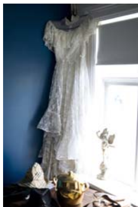
Þessi fallegi brúðarkjól verður falur á kjólamarkaðinum á sunnudaginn.

þeir koma víða að. „Ég man ekkert hvar ég fékk alla þessa kjóla en voða marga hef ég keypt í búðum með notuð fót og á mörkuðum. Tengdamamma sonar míns hefur verið að finna kjóla fyrir mig í Maryland þar sem býr mikið af ríku fólki og svo var þar líka góðgerðaverslun með notuð fót og þar var fallegum kjólum safnað saman fyrir mig og ég fékk svo að bjóða í þá áður en þeir voru settir fram í búðina.“