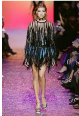
Þessi Elie Saab kjóll úr diskólinunni 2017 fæst leigður í fimm daga á innan við tíu prósent af kaupverði.