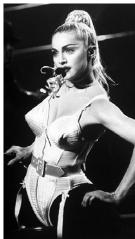
Madonna hannaði þennan fræga búning með Jean Paul Gaultier.

„Þegar ég kom fyrst til Malaví sá ég svo ótal mörg börn yfirgefin og munaðarlaus vegna alnæmis. Varnarleysi þeirra snart mig mjög og að sjá foreldra þeirra og fjölskyldumeðlimi liggja fyrir dauðanum, en geta ekkert gert til að breyta því. Á sama tíma dáðist ég að hamingju þeirra og gleði, þrátt fyrir mikinn missi, sorg og allsleysi. Það var lærdómsríkt, og þótt ég hefði komið til Malaví til að hjálpa sem mest ég mátti, voru það börnin sem hjálpuðu mér að þekkja þakklæti.“ segir Madonna sem hleypit af stokkunum húðlinunni MDNA Skin sem inniheldur endurnærandi jurt sem vex um alla Afríku. Stór hluti tekna af húðvörnum rennur beint til hjálparstarfs í Afríku, í menntun stúlkna, skólabyggingar, heilsgæslu og til barnalækna.