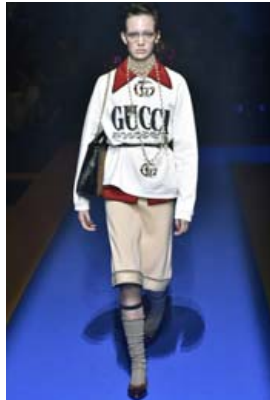
Þessi Gucci peysa úr vorlinunni 2018 er meðal fatnaðar sem hægt er að leigja hjá tiskuleigum eins og Front-Row.

umhverfið varða. Hægt var að leigja dýran hátískufatnað og fylgihluti fyrir aðeins brot af raunverði um jólaeytið sem er mikil veislutíð í Bretlandi. Flestir leigðu sér eitthvað tvennt og meðalleigutíminn var aðeins eitt kvöld. Karlar voru aðeins viljugri til að leigja sér veislufatnað en konur en samkvæmt könnunum