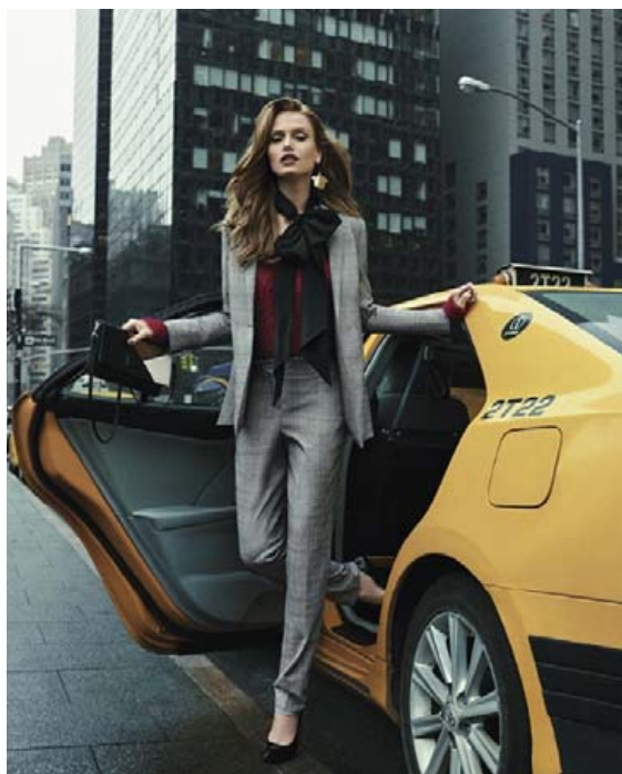
Comma kynnrir nýja haustinu í verslun sinni í Smáralind í dag. Af því tilefni verður viðskiptavinum boðið upp á léttar veitingar.

Alltaf er hægt að finna eitthvað nýtt og skemmtilegt í verslun