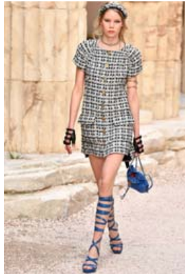
Þessi kjóll er úr lystisnekkjulínu Chanel 2018 og er til leigu í fimm daga fyrir 30.000 krónur sem eru tíu prósent af söluverði úr búð.

Því hafa æ fleiri horft til möguleikans á leigutísku. Westfield-verslunarmiðstöðin í Bretlandi gerði tilraun með að opna tiskuleigu í nokkra daga til að athuga hvort sé möguleiki væri raunhæfur og niðurstöðurnar voru jákvæðar fyrir þá sem láta sig