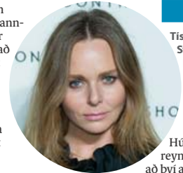
Tiskuhönnuðurinn Stella McCartney hefur áhuga á dýra- og umhverfisvernd.

Tiskuhönnuðurinn Stella McCartney hefur mikil áhrif í tiskuheiminum og hún hefur sýnt umhverfis- og dýravænda áhuga.