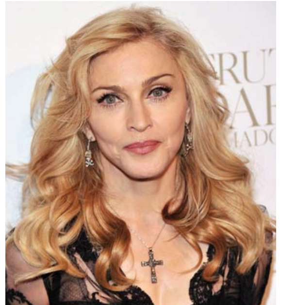
Madonna var fimm ára þegar hún missti móður sína. Henni gekk vel í skóla og dreymdi um að verða nunna. Krossar eru áberandi skart á ferli hennar.

„Það er úrelt og fánægleg hugmynd feðraveldisins að konur hætti að vera skemmtilegar, forvitnilegar, fallegar og kynsandi eftir fertugt. Af hverju ættu karlar einir mega vera ævintýragjarnir,