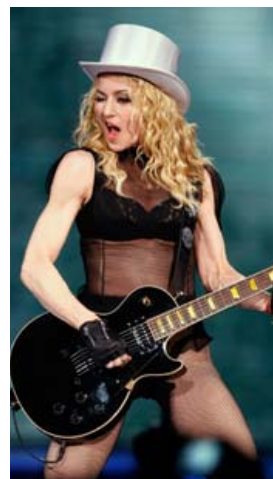
Madonna er gjarnan ögrandi á sviði og sýnir óhikað stæltan kroppinn.