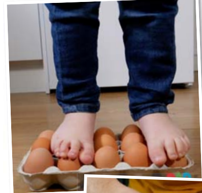
Hægt er að standa á eggjum án þess að þau brotni.

Hér er eitt risaeðlu egg á leiðinni í frystinn.