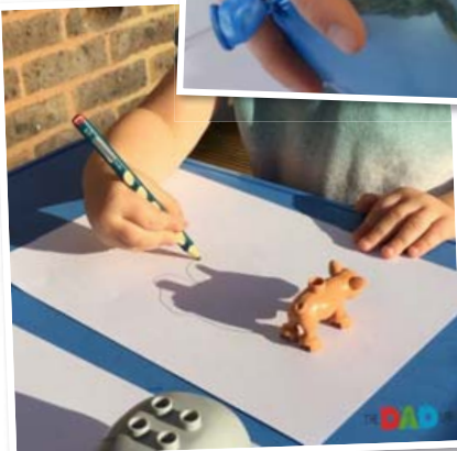
Urban-feðgarnir skemmta sér við alls konar skapandi verkefni. Hér er teiknað í kringum skugga.