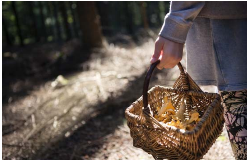
Matsveppir eru ljúffengir og bragðmiklir. Þá má þurrka eða þurrsteikja og frysta til vetrarins.