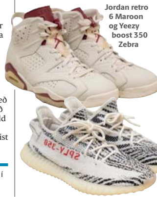
Jordan retro 6 Maroon og Yeezy boost 350 Zebra