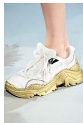
Með gylltum sóla frá N.2. Þessir skór voru sýndir á tiskuvíku í Milanó.