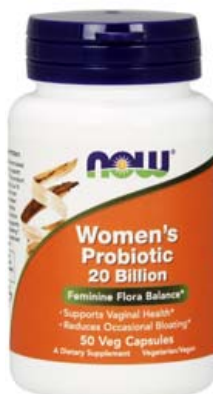
Women's Probiotics. Þrjú mismunandi vinveittir góðgerlar sem eru sérstaklega góðir fyrir konur. Gerlarnir taka sér bólfestu á viðkvæmum svæðum kvenna og stýja við eðlilegt sýrustig.

Námskeiðið er haldið í fundarsal Icepharma að Lynghalsi 13, Reykjavík Hvenær: Mánudaginn 3. september Tími: Frá 20.00-21.30 Verð: 5.900 kr. Innfalið: Námskeiðsgjald og gjafapoki frá NOW að verðmæti 3.000 kr.