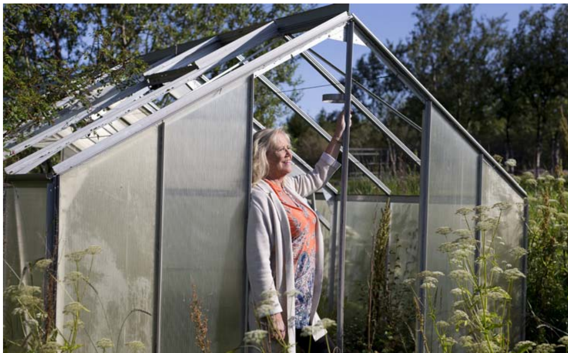
Signý lítur björtum augum til vetrarins sem ber með sér marga skemmtilega tónleika- og vetrafatakláppinn.

„Mér finnst gaman að klæðast fötum sem er bæði hægt að klæða upp eða niður eftir tilefni," segir