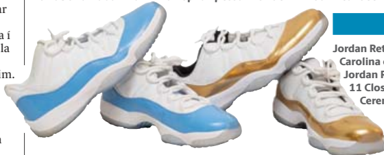
Jordan Retro 11 Carolina og Jordan Retro 11 Closing Ceremony.