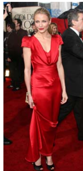
Á Golden Globe verðlaunahátíðinni árið 2010 klæddist Diaz hárauðum síðkjól frá Alexander McQueen.