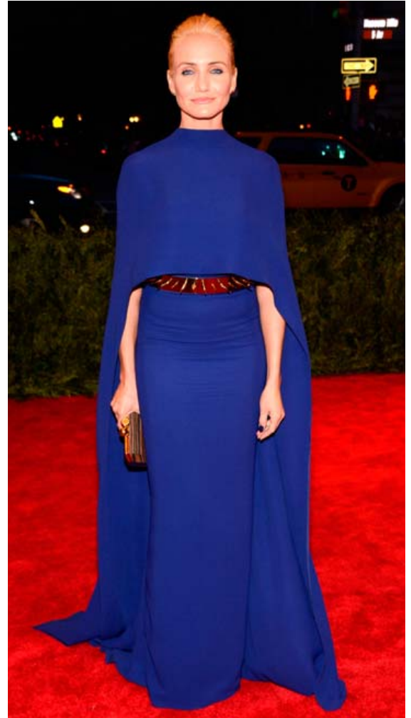
Glæsileg í sérsniðnum bláum kjól með skikkju úr smíðju Stelli McCartney árið 2013. Gaddabeltið vakti verðskuldaða athygli.

Diaz hefur alltaf heillað áhorfendur, samferðafólk sitt og ljósmyndara upp úr skónum. Hér eru rífjuð upp nokkur augnablik á rauða dreglinum.