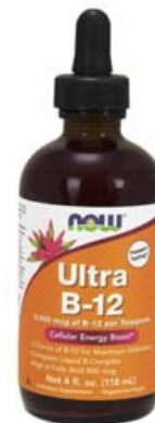
B-12 Ultra er nauðsynlegt við myndun nýrra rauðra blóðkorna og skortur getur valdið blóðleysi, þrekleysi og síþreytu. Ultra B-12 liquid frá NOW inniheldur einnig hin B-vítamínin 1, 2, 3, 5 og 6.