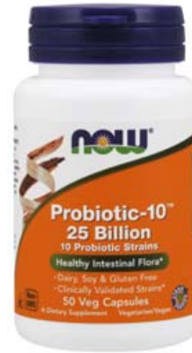
Probiotic-10 25 Billion. Góðgerlablanda með 10 mismunandi vinveittum góðgerlum í miklum styrkleika sem stýja við heilbrigða þarmaflouru og ónæmiskerfi.