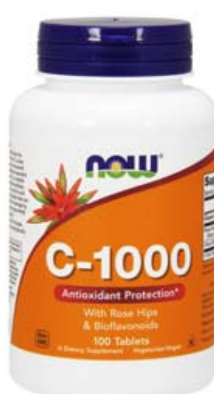
C-1000. C-vítamín er öflugt antioxidanarefni og stuðlar að eðlilegri starfsemi ónæmiskerfisins. Það hjálpar til við að draga úr þreytu og lúða og er talið gott fyrir húð, bein og líði.