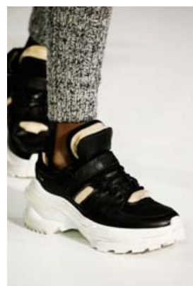
Skór frá Lacoste sem sýndir voru á tiskuvíku í París fyrir 2018-2019.