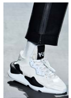
Herraskór frá Y-3. Haust- og vetrartíska fyrir 2018-2019.