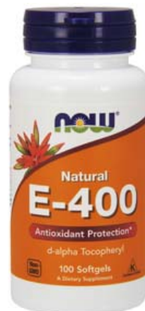
E-vítamín hefur góð áhrif á hjarta og æðakerfi og er nauðsynlegt fyrir eðlilega starfsemi ónæmiskerfisins.