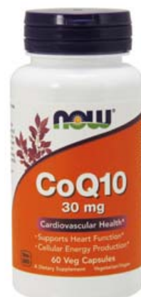
CoQ10 er talið auka blóðflæði og vera styrkjandi fyrir hjarta og æðakerfi. Einnig virðist Q10 virka mjög vel einkennum vefjagigtar.