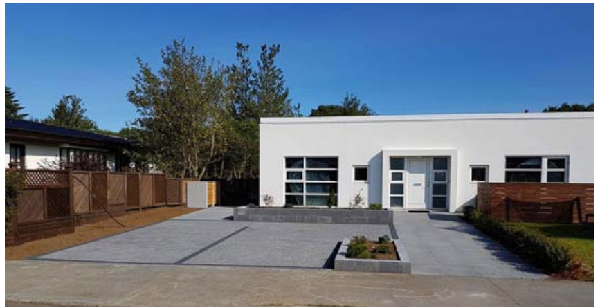
Smekklega hellulög og aðgreind bílastæði ásamt hellulagðri stétt og trjá- og blómabeðum.

Allar nánari upplýsingar má finna á www.garda.is .