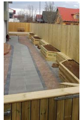
Hellur og beð lifga upp á umhverfið.

Fólk er kynningarblað sem býður auglýsendum að kynna vörur og þjónustu í forni viðtala og umfjallana. Í blaðinu er einnig hefðbundin ritstjórnarefni. Blaðið fylgir Fréttablaðinu daglega.