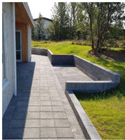
Falleg hellulögn sem brennt miklu fyrir garðinn.

Fæst í fjölmörgum apótekum, heilsuverslunum, í Hagkaup, Fjarðarkaup og Melabúðinni.