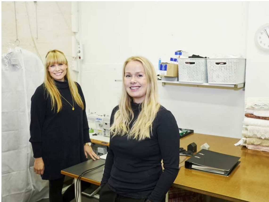
Hjá Klifinu er meðal annars boðið upp á námskeið í tónlist, dansi, visindum, líkamsrækt, fermingarkjólagerð og ýmsu öðru.

Það er einnig góður hópur í kringum badmintonið hjá okkur en við bjóðum upp á leigu á badmintonvöllum, þar geta svo hópar