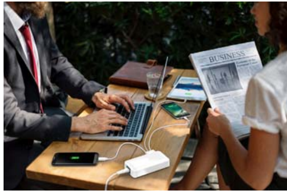
Charging Center One hleðslustöðin leysir öll hleðslutæki á heimilinu af hólm.