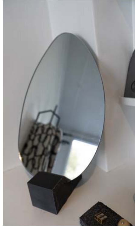
Grágrýtisspeglar Þórunnar vöktu athygli Dezeen, en með þá komst Þórunn í 20 manna úrtak úr 35.000 hönnuða hópi.

Fólk er kynningarblað sem býður auglýsendum að kynna vörur og þjónustu í formi viðtala og umfjallana. Í blaðinu er einnig hefðbundni ritstjórnarefni. Blaðið fylgir Frettablaðinu daglega.