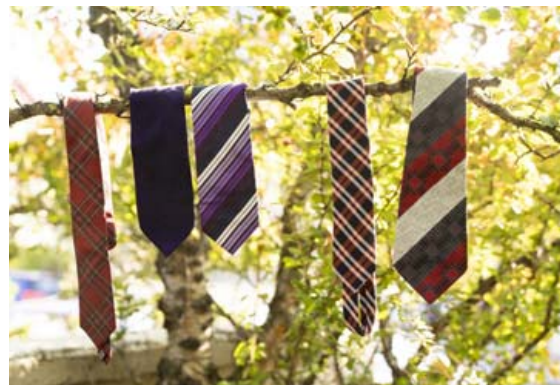
Nokkur misbreið bindi frá ólíkum tímum úr safni trommuleikarans.

tónleikaferðalögum um Evrópu seinna í haust og í vetur. Stefnan er sett á veglega útgáfutónleika hér á landi eftir áramót en þeir eru enn í vinnslu.“