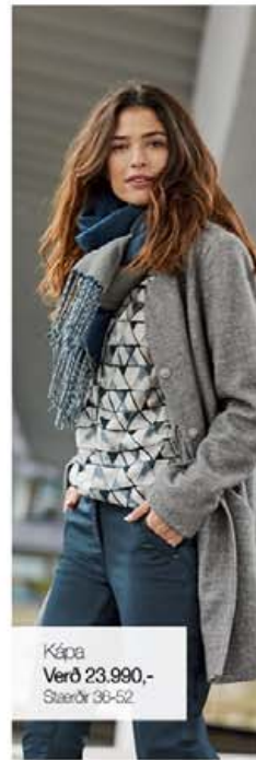
Kápa Verð 23.990,- Stærðir 36-52