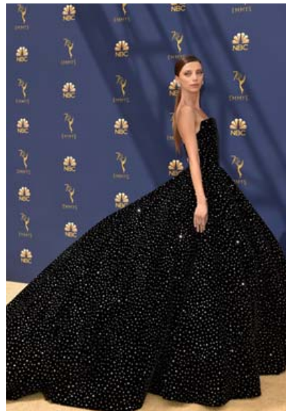
Leikkonan Angela Sarafyan úr dramatisku þáttunum Westworld vakti verðskuldaða athygli í þessum prinsessukjól eftir Christian Siriano. Stjörnum prýddur kjóllinn þótti minna á gamla glamúr tíma í Hollywood.