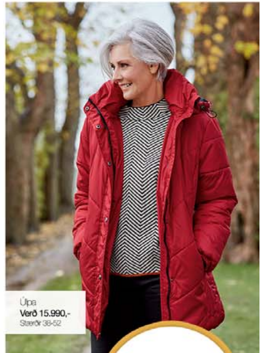
Úpa Verð 15.990,- Stærðir 38-52