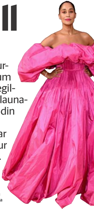
Tracee Ellis Ross, leikkona í gamanþáttunum Black-ish og dóttir Diönu Ross, klæddist þessum íburðarmikla kjól úr hátískulínu Valentino.

Fögur fljóð í undur-samlegum klæðum prýddu rauða dregilinn á Emmy-verðlaunahátíðinni sem haldin var í vikunni. Að venju þóttu sumar leikkonurnar betur klæddar en aðrar.