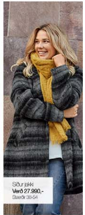
Síður jakki Verð 27.990,- Stærðir 38-54