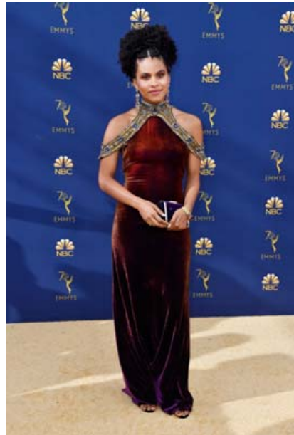
Zazie Beetz var tilnefnd fyrir leik sinn í þáttunum Atlanta. Hún þótti töff í kjól frá Ralph Lauren.