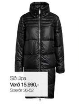
Síð úpa Verð 15.990,- Stærðir 36-52