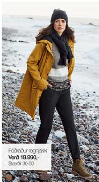
Fóðrabur regnjakki Verð 19.990,- Stærðir 36-50