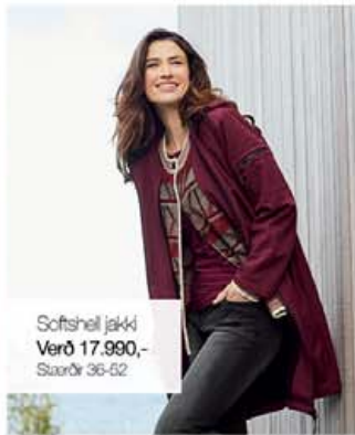
Softshell jakki Verð 17.990,- Stærðir 36-52