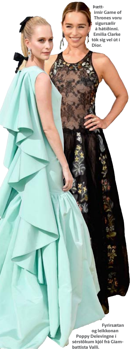
Þættirnir Game of Thrones voru sigursælir á hátíðinni. Emilia Clarke tók sig vel út í Dior.