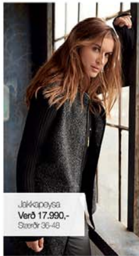
Jakkepeysa Verð 17.990,- Stærðir 36-48