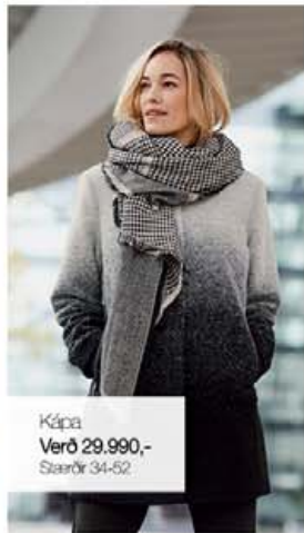
Kápa Verð 29.990,- Stærðir 34-52