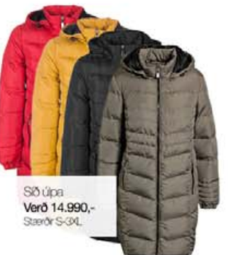
Síð úpa Verð 14.990,- Stærðir S-3XL

Gott úrval af yfirhöfnum í góðum stærðum!