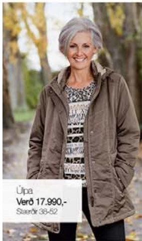
Úpa Verð 17.990,- Stærðir 38-52