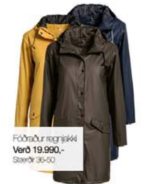
Fóðrabur regnjakki Verð 19.990,- Stærðir 36-50