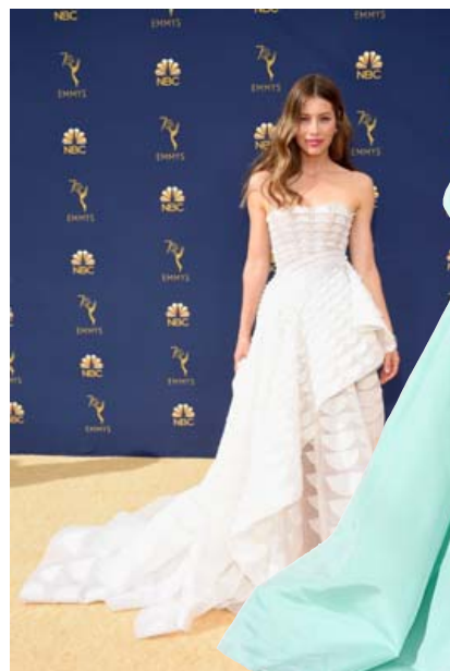
Jessica Biel tekur sig ávallt vel út á rauða dreglinum. Hún steig ekki feilspor í ár í kjól frá Ralph & Russo.