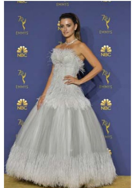
Penélope Cruz skryddist hvítum fjaðrakjól úr smíðu Chanel og bar við hann skart frá Atelier Swarovski.