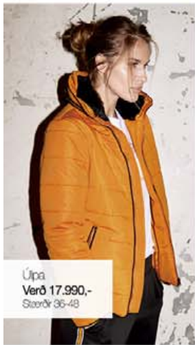
Úpa Verð 17.990,- Stærðir 36-48