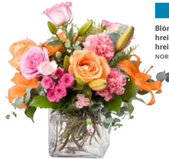
Blóm lifa lengur í hreinu vasa með hreinu vatni.

Úða má vatni á blómin einu sinni til tvisvar á dag ef loftið er þurr. Oftast fylgir næring með afskornum blómum og hún á að lengja líf þeirra. Þá er gott að setja sykurmola út í vatnið og sumir setja skvettu af Sprite út í það til að hressa blómin við.