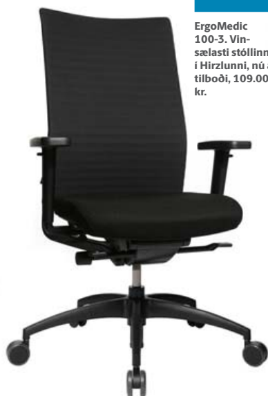
ErgoMedic 100-3. Vinsælasti stóllinn í Hirzlunni, nú á tilboði, 109.000 kr.