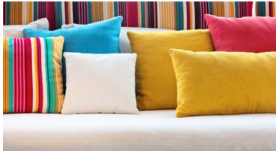
Litrikir púðar bæði lifga upp á heimilið og bjóða upp á notalega stund.

Ef rýmið er litíð er spegillinn nauðsyn. Ef ekki má negla í veggina eins og stundum vill vera í leigu-