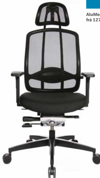
AluMedic 5, nú frá 127.000 kr.