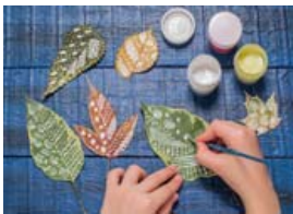
Haustlauf bjóða upp á skemmtilegar skreytingar.