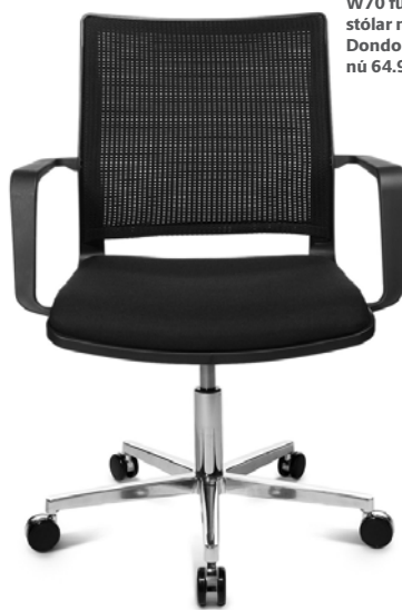
W70 fundarstólar með Dondola. Verð nú 64.900 kr.