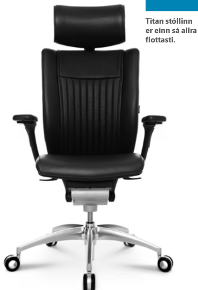
Titan stóllinn er einn sá allra flottasti.