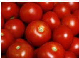
Tómata ætti ekki að geyma í ísskáp.

Nú er haustið svo sannarlega farið að láta til sín taka með fallgustu litapallettu náttúrunnar sem er jafnframt stórkostlega skemmtilegur efniviður í alls kyns handverk og fönður. Hér er náttúrulega átt við haustlaufin sem hrynja nú af trjánum og biða þess að einhver nýti þau til að gera eitthvað fallegt. Haustlaufin getur öll fjölskyldan dundað sér við saman, fyrst við söfnun, svo meðhöndlun en laufin þurfa að vera bæði þurr og þétt til að hægt sé að vinna með þau og síðast en ekki síst sjálfa skreytingagerðina sem eru engin takmörk sett ef myndunaraflíð er með í för. Haustlaufin eru ólík að lit, lögun og áferð og svo er til nóg af þeim svo það er allt í lagi að gera tilraunir með efniviðinn og hver veit nema einhverjar jólagjafir liti dagsins ljós í hauströkkrunu.