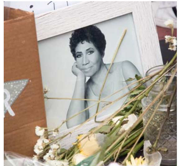
Aretha Franklin var ein vinsælasta söngkona sögunnar.

tónlist og hún vonast til að gefa út eigið efni næsta sumar, þegar fæðingarorlofinu lýkur. „Ég er búin að vera í hljóðveri að taka upp lög. Þetta er aðallega soul-tónlist, R&B í bland við popp,“ segir hún en söngurinn er hennar aðalstarf.