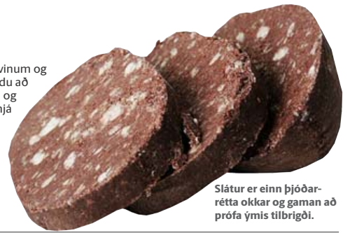
Slátur er einn þjóðarretta okkar og gaman að prófa ýmis tilbrigði.