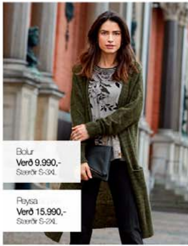
Bolur Verð 9.990,- Stærðir S-3XL