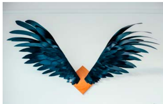
Myrkvi er fuglsauga á mahóni platta. Svart bæs og lakkaðir. Vænghaf er um 95 cm. Vængirnir fást í versluninni Mun.