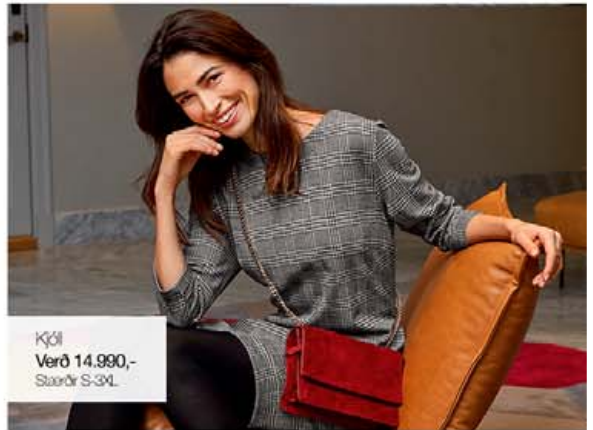
Kjól Verð 14.990,- Stærðir S-3XL

Brandtex hefur sölu á stórglæsilegum náttfatnaði - Forsala er hafin á www.brandtex.is Línan er væntanleg í verslunina á morgun - 11.okt.