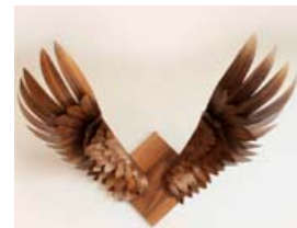
Valkyrja (t.v.) er úr reyktu eik á furuþlatta. Hún fæst einnig í mahóni, hnotu og í svörtum lit. Valkyrja (t.h.) er hnota á hnotuþlatta og fæst einnig í mahóni, reyktu eik og í svörtum lit. Vænghaf er um 60 cm.