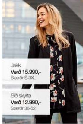
Jakkí Verð 15.990,- Stærðir S-3XL