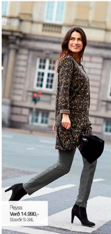
Playsa Verð 14.990,- Stærðir S-3XL