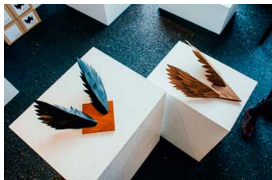
Vargur í svörtu á mahóniþlatta og hnotu á hnotuþlatta.