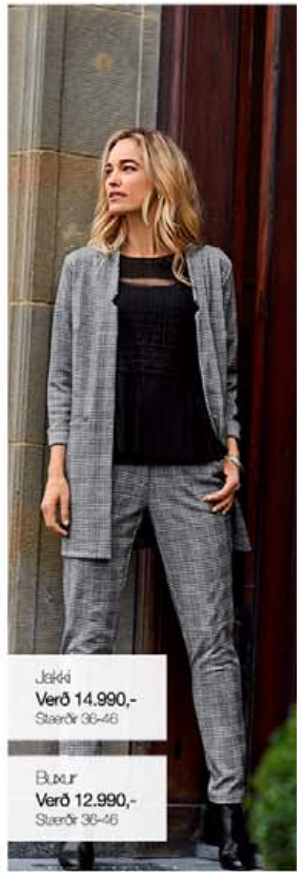
Jakkí Verð 14.990,- Stærðir 36-46