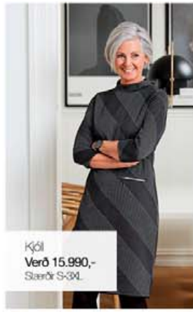
Kjól Verð 15.990,- Stærðir S-3XL