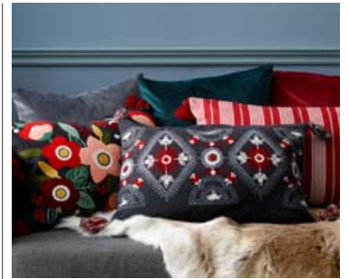
Jólaalitir 2018 eru frekar dökkir og fallegir.

Flleiri sænskar verslanir eru búnar að stilla út jólauskrauti og má þar nefna IKEA og Ellos home en þar eru djúpir, dökkir litir sömu-leiðis áberandi. Það verður spennandi að sjá hvað H&M Home býður upp á þegar þeir opna verslun á Hafnartorgi fljótlega.