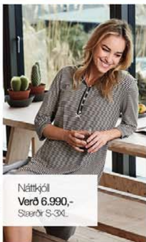
Náttkjól Verð 6.990,- Stærðir S-3XL

Náttfatasett, náttkjólar, velúr gallar, velúr sloppar og baðsloppar í úrvali frá Brandtex