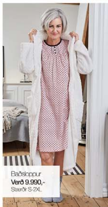
Baðsloppur Verð 9.990,- Stærðir S-2XL