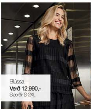
Blússa Verð 12.990,- Stærðir S-2XL