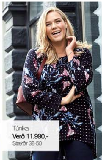
Túnika Verð 11.990,- Stærðir 38-50