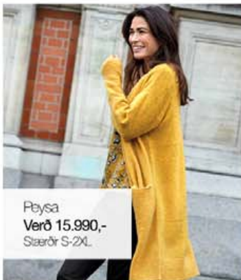
Plýsa Verð 15.990,- Stærðir S-2XL