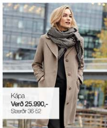
Kápa Verð 25.990,- Stærðir 38-52