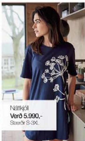
Náttkjól Verð 5.990,- Stærðir S-3XL