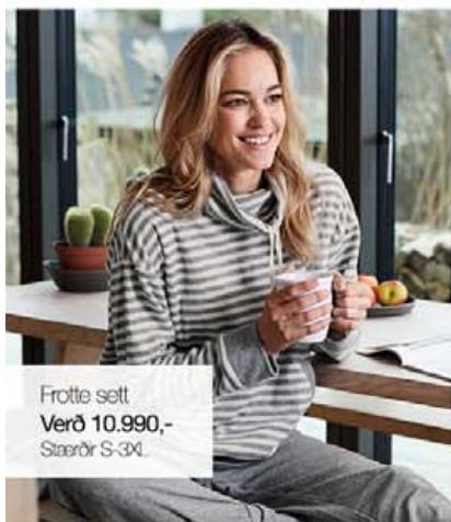
Frotte sett Verð 10.990,- Stærðir S-3XL