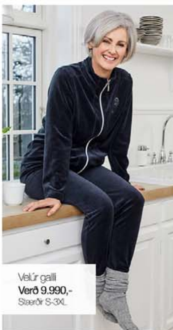
Velúr galli Verð 9.990,- Stærðir S-3XL