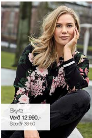
Skyrta Verð 12.990,- Stærðir 38-50