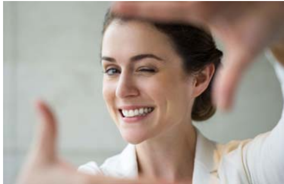
Það er eftirsóknarvert að hafa fallegar tennur.

Activital Sonic Vibration tannburstinn er byltingarkennd hönnun. Hann er notaður eins og venjulegur tannbursti og lítur þannig út líka en hann er engu að síður batterisdrifinn og hefur einstaklega þægilegan titring. Það gerir það að verkum að finu hárin á honum geta fjarlægt allt að 50% meira af óhreinindum á milli tannanna og hreinsað mun