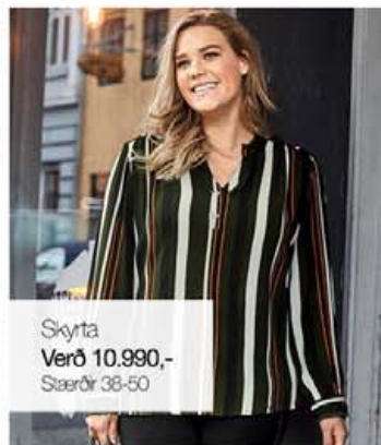
Skyrta Verð 10.990,- Stærðir 38-50