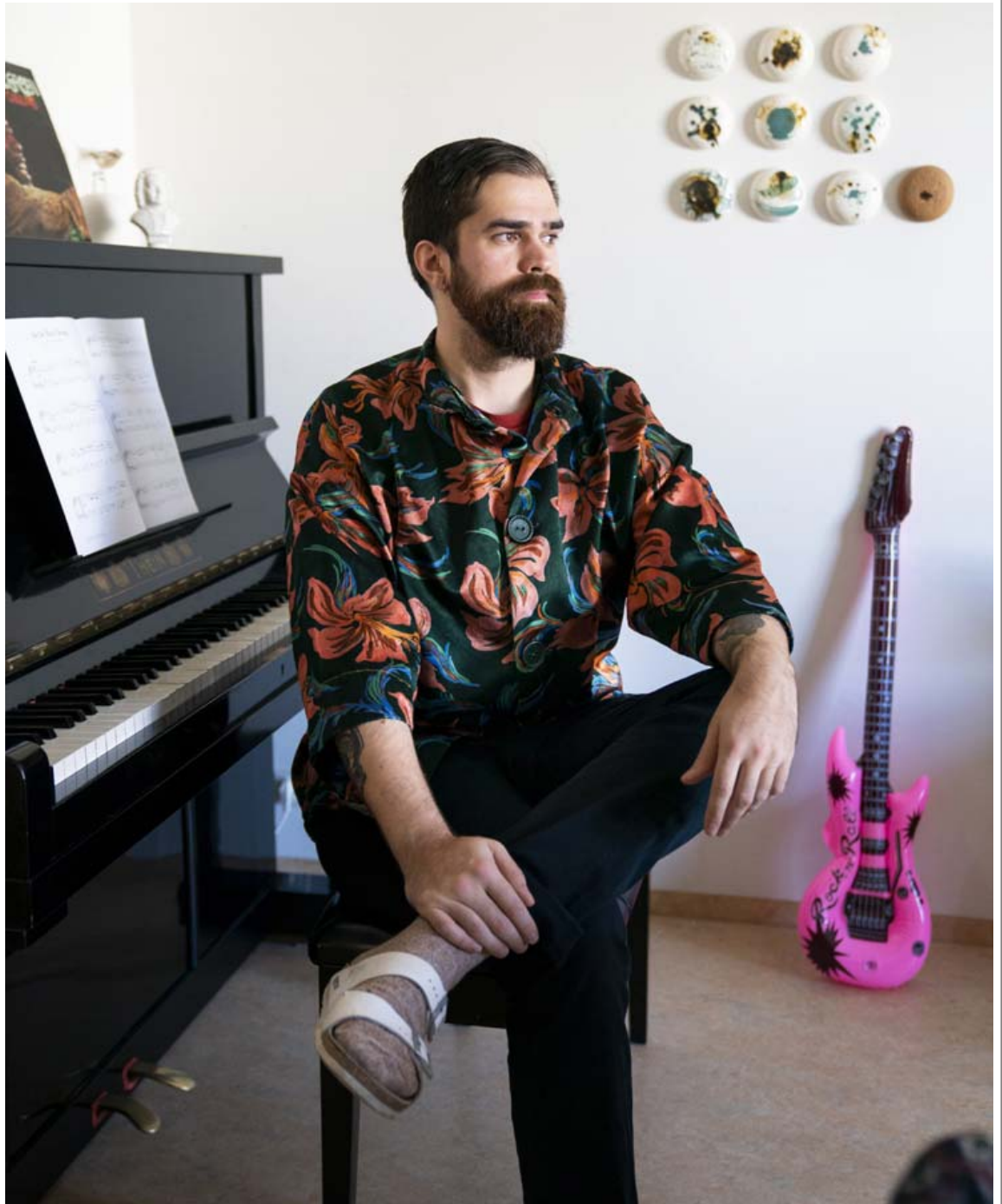
Skrautleg blómaskyrta sem móðir Ara saumaði úr gömlum kimonó áður en Ari fæddist. Ari hefur notað hana mikið undanfarin tvö ár.