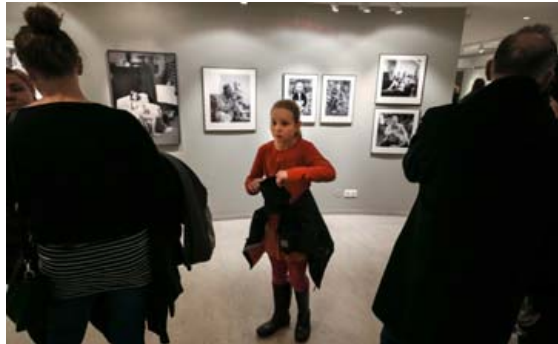
Í Ljósmyndasafni Reykjavíkur er hægt að skoða sýninguna Fjölskyldumyndir.

Á Árbæjarsafni er að finna skemmtilegar og fróðlegar sýningar inni í húsunum. Leikfangasýningin Komdu að leika! í Landakoti er með allra vinsælustu sýningum safnsins og í húsi sem heitir Líkn er að finna búningahorn þar sem hægt er að smella mynd af sér við flottan bakgrunn. Það er ómissandi að kíkja upp á baðstofuflotíð í gamla Árbænum og virða fyrir sér hvernig fólk bjó á árum áður.