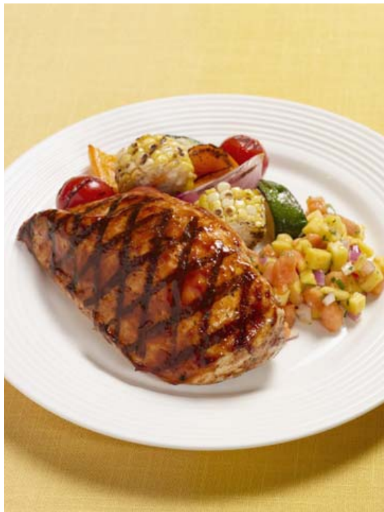
Kjúklingur í mangósósu er mikið ljúfmæti.

Hér er notaður heill kjúklingur. Hins vegar er hryggsúlan skorin burt og kjúklingurinn lagður niður eins og fiðrildi. Það er mjög gott að