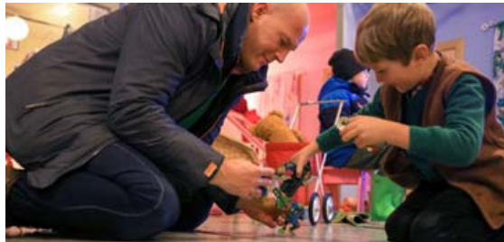
Leikfangasýningin er vinsæl á Árbæjarsafni.

Á Landnáms-sýningunni er hægt að klæða sig upp í vikingabúninga.