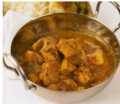
Indverskur kjúklingur er alltaf vinsæll.