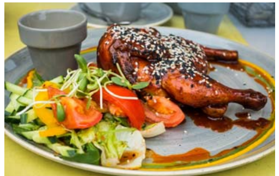
Hægt er að matbúa kjúkling á margvíslegan hátt.

1 msk. valmúafrae 1 msk. kórianderfrae 1 tsk. fennelfrae 1 msk. broddkúmen 3 cm kanilstöng 10 svört piparkorn 3 burrkaðir chili 2 laukar, smátt skornir 5 hvítlauksrif, smátt skorin 1 msk. engifer, rífið 4 msk. ferskt kókós 3 tómatar 1 tsk. túrmerik 1,5 tsk. garam masala Vatn Olía til steikingar 2 dl kókosmjólk