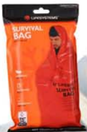
Survival Bag kr. 1.195