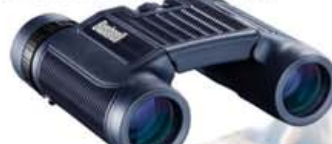
Bushnell H2o 10x25 kr. 13.900