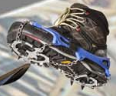
Göngubroddar kr. 7.900