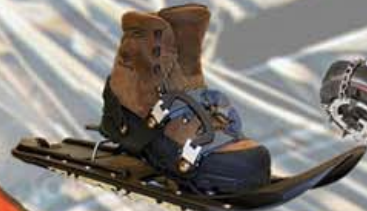
Snjóbrúgur kr. 19.900