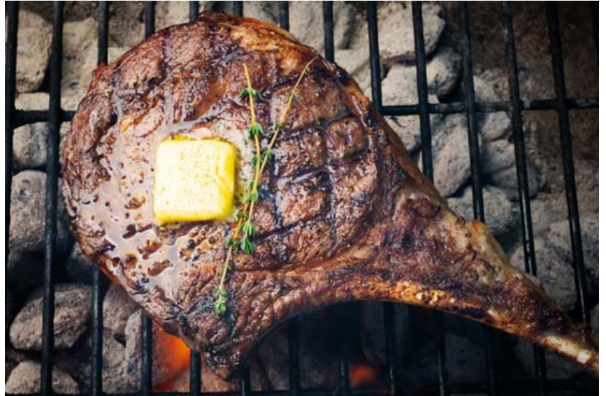
Góð steik er hluti af lágkolvetnafeði. Flestir vilja þó steik daglega þótt hún geti verið mjög góð.

Turbókúrin. Þessi lágkolvetnakúr orsakar hraðara þyngdartap en getur verið erfiðari fyrir líkamann. Þetta er mjög strangur ketómatarækúr. Sumir lifa á eggjum og kjóti en