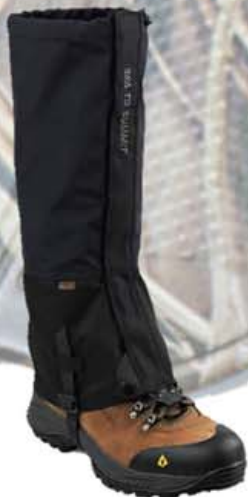
Vatnsheldar legghlífar kr. 9.995