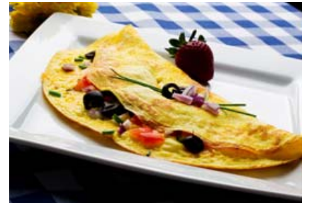
Eggjakaka með lauk, tómata, spinati og feittum osti er sannkölluð ketómáltíð. Góður morgunverður fyrir flesta.

sleppa öllu grænmeti. Aðrir fasta í tvo daga í viku eða fasta í átta tíma á sólarhring.