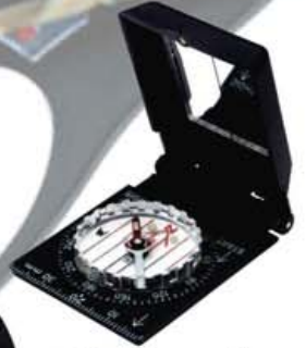
Silva Ranger SL áttaviti kr. 4.900