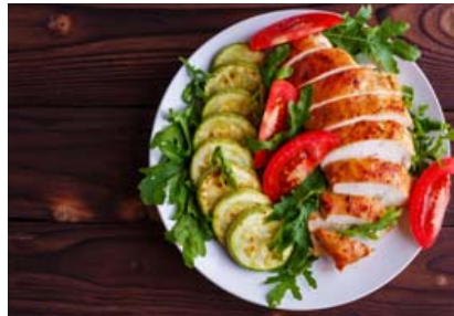
Kjúklingur með kúrbít og grænmeti er góð og holl kolvetnasnauð máltíð. Fólk þarf að vera hugmyndríkt á ketó.