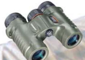
Bushnell Trophy 10x28 kr. 25.900