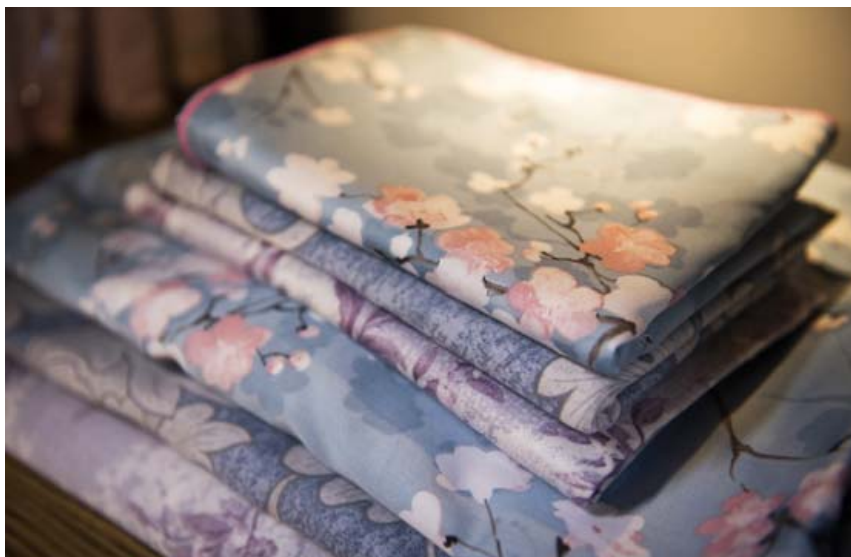
Björn segir Íslendinga eiga skilið að sofa betur og að gæðarúmeföt geti átt stóran þátt í því.