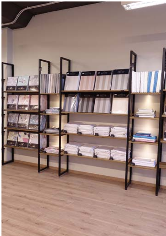
Verslunin er rúmgóð og björt og auðvelt að finna óskarúmefötin.