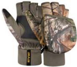
Skotlúffur kr. 7.760