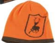
Cumberland húfa kr. 2.200