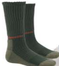
Göngusokkar kr. 1.990