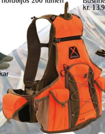
Rjúpnavesti kr. 22.900