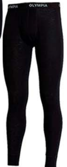
Merino ullarbuxur kr. 5.490