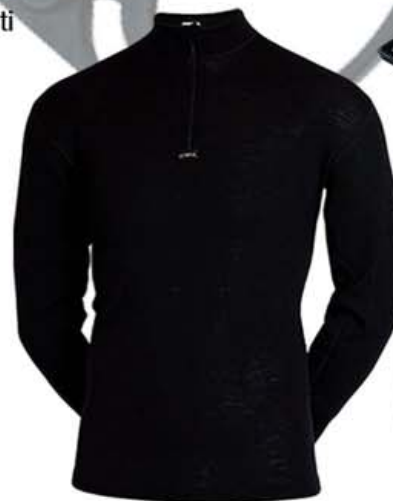
Merino ullarbólur kr. 5.990