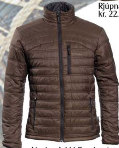
Verdun Jakki Deerhunter kr. 13.900