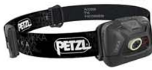
Petzl Tikka höfuðljós 200 lúmen kr. 6.990