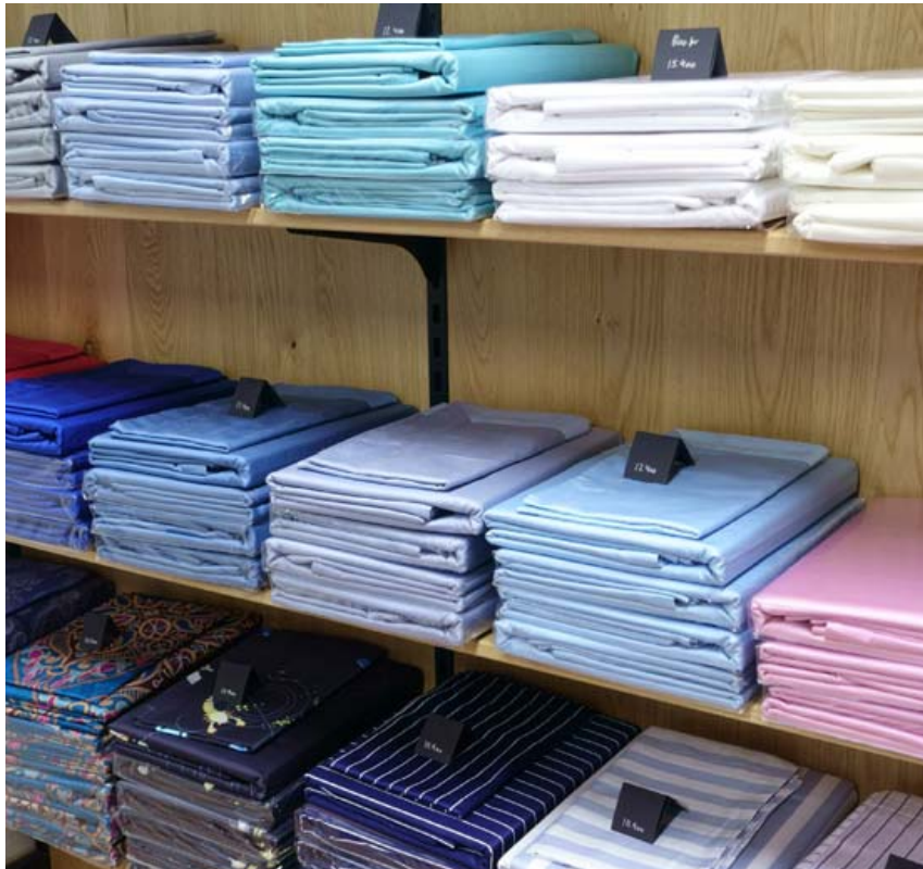
Úrvalið er fjölbreytt, bæði í efnum og litum, og ættu allir að geta fundið rúmeföt við sitt hæfi.