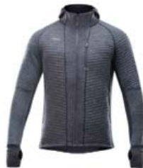
DEVOLD TINDEN SPACER PEYSA STÆRD M-XXL VERÐ 29.995 KR.