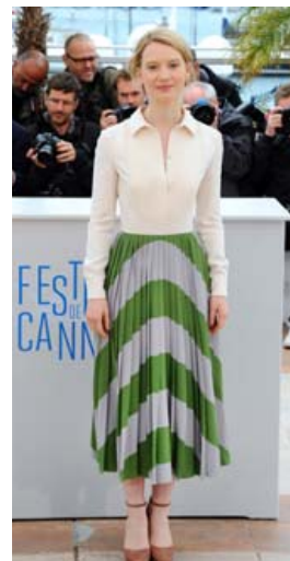
Ljósklædd í grænu pils í kvikmyndahátíðinni í Cannes.