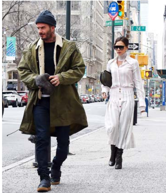
David Beckham vel klæddur í tvöfalda jakka og með húfu á hausnum.