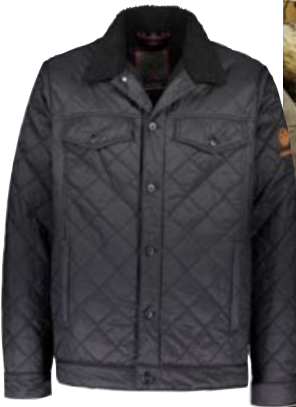
Glymur kostar 19.990 kr.