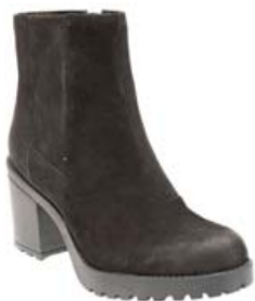
Vagabond Grace 19.995