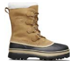
SOREL CARIBOU SLIM STÆRD 37-41 VERÐ 24.995 KR.