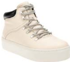
Vagabond Jessie 16.995