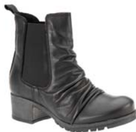
SIXMIX ÖKKLASKÓR EINNIG TIL Í BRÚNU, VÍNRAUÐU OG GRÁU VERÐ 15.995