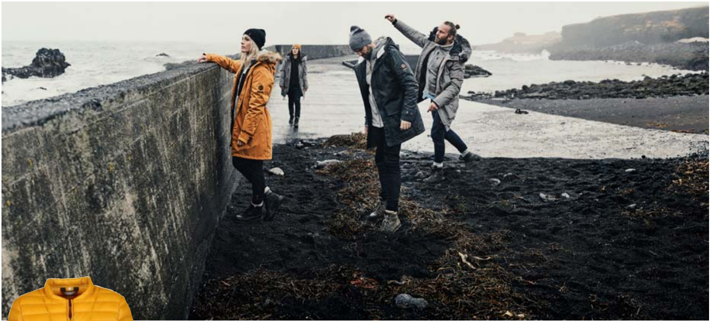
Vetrarflikur ZO•ON eru hannaðar fyrir breytilegt veðurfar hérlandis.