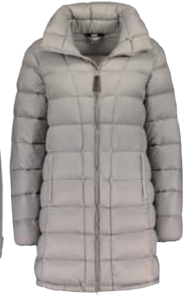
Flatey er á 36.990 kr.