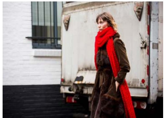
Treflar í yfirstærð eru góð leið til að fá lagskipt útlit. Þeir geta hangið yfir öxlina eða hálsinn eða flætt niður í kringum líkamann.

Treflar í yfirstærð eru góð leið til að fá lagskipt útlit þó að maður sé ekki í mörgum lögum. Því stærri, því betra. Það er hægt að láta þá hanga yfir öxlina eða hálsinn eða láta þá flæða niður í kringum líkamann. Slíkir treflar geta líka bætt aukinni dýpt í lagskipt útlit.