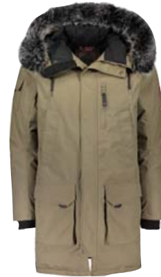
Orri kostar 74.990 kr.