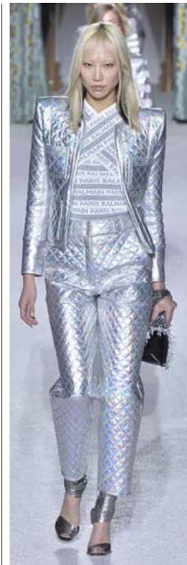
Framtíðin er komin og hún er silfurbjört. Silfur- og málmkennnd efni munu endurvarpa jóla- og norðurljósunum í vetur og ekki verður óalgengt að sjá gangandi diskókúlur léttu svartasta skammdegið, kannski í þessari dásemdardragt frá Balmain.