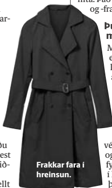
Frakkar fara í hreinsun.

Gott er að eiga nokkrar vetraryfirhafnir til skiptanna, enda er íslenskur vetur oft langur og kaldur. Falleg ullarkápa, hlý dúnúlpur og þykkur jakki eru flikur sem koma að miklu gagni yfir vetrartímann. Yfirhafnir endast almennt betur ef þær fá rétta umhirðu og þvott. Alltaf er best að lesa vel þvottaleiðbeiningar á flikum áður en þeim er skellt