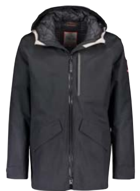
Eldey er á 69.990 kr.