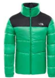
THE NORTH FACE NUPTSE III STÆRD S-XL VERÐ 32.995 KR.