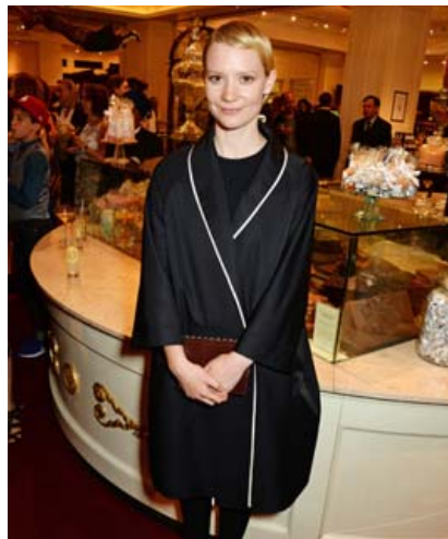
Svartklædd í þægilegum jakka í partii til að fagna frumsýningu Alice Through the Looking Glass í London 2016.