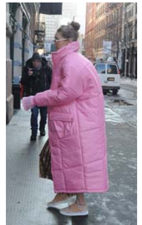
Gigi Hadid fer ekki troðnar slóðir en er örugglega afar hlýtt í þessari bleiku flik.