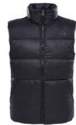
THE NORTH FACE NUPTSE III STÆRD S-XL VERÐ 28.995 KR.