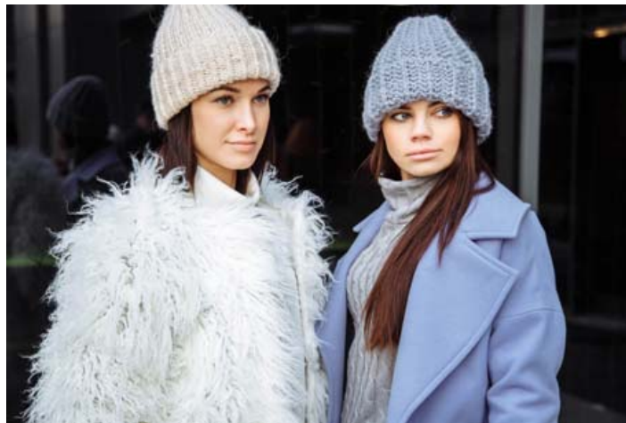
Vetraryfirhafnir fá lengra líf með réttri umhirðu.

Margir eiga góðar dúnúlpur eða dúnvesti en hlýrri og léttari flikur er vart hægt að fá. Mikilvægt er að halda dúninum hreinum, þurrum og léttum en með því móti lengjast lífdagar flikurinnar svo um munar. Það er í lagi að setja dúnúlpu í þvottavélina, þvo við lagan hita og nota sérstakt þvottaefni fyrir dún. Það er einnig í lagi að setja dúnúlpu í þurrkara við lagan hita.