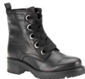
SIX MIX ÖKKLASKÓR EINNIG TIL Í VÍNRAUÐU VERÐ: 18.995