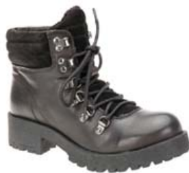
SIX MIX KULDASKÓR EINNIG TIL Í BRÚNU VERÐ 16.995