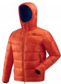
MILLET K DOWN STÆRD S-XL VERÐ 59.995 KR.