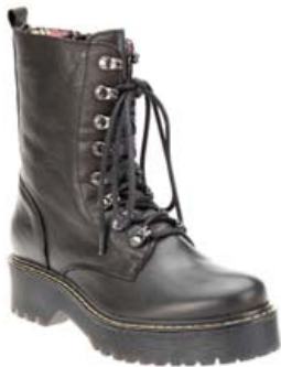
SIX MIX ÖKKLASKÓR EINNIG TIL Í VÍNRAUÐU VERÐ 24.995