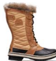
SOREL TOFINO II STÆRD 36-41 VERÐ 29.995 KR.