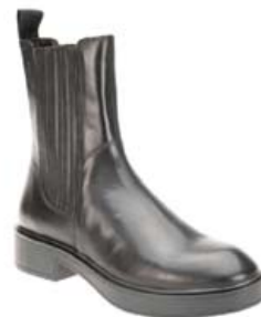
Vagabond Diane 24.995