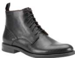
Vagabond Salvatore Herraskór 22.995