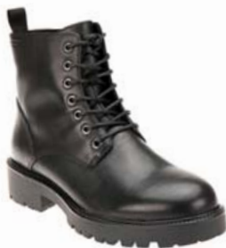
Vagabond Kenova 19.995