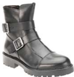
Vagabond Kenova 22.995