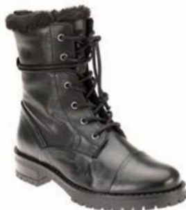
SIX MIX ÖKKLASKÓR VERÐ: 19.995