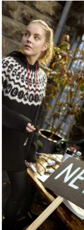
Hér má sjá hluta af nýrri hönnun Védísar sem handavinnufólk getur þrjónað.

lance“ fyrir Ístex og Rammagerðina að hönnun á væðarvoðum og lopapeysum. Ég hef líka hannað fyrir ýmsa handverkshópa, eins og Borgarfjarðarpeysurnar og skagfirsku hestapeysurnar Undir bláhimni og Undir gráhimni. Ég er heilluð af litadýró náttúrunnar og hef frá því í barnæsku brotið upp landslag í liti.“