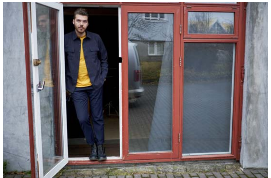
Bolurinn er Urban Outfitters og skyrtan frá Zplish. Buxurnar koma frá Selected.