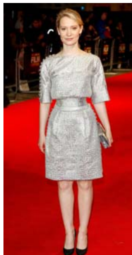
Í silfurlítum kjól fyrir sýningu á Madame Bovary á kvikmyndahátíð í London 2014.