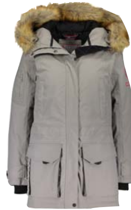
Berjast kostar 59.990 kr.