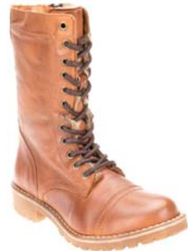
SIX MIX KULDASKÓR EINNIG TIL Í GRÁU OG SVÖRTU VERÐ: 19.995