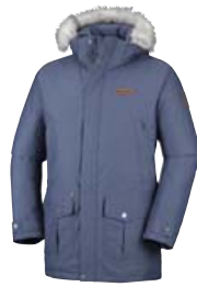
COLUMBIA TIMBERLINE RIDGE STÆRD S-XL VERÐ 39.995 KR.