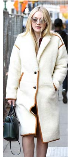
Dakota Fanning er hálf kuldaleg þrátt fyrir mokkakápua hitu.