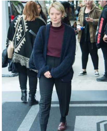
Miu finnst alger óþarfi að punta sig hversdags.