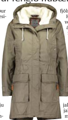
Þrauka, 39.990 kr.