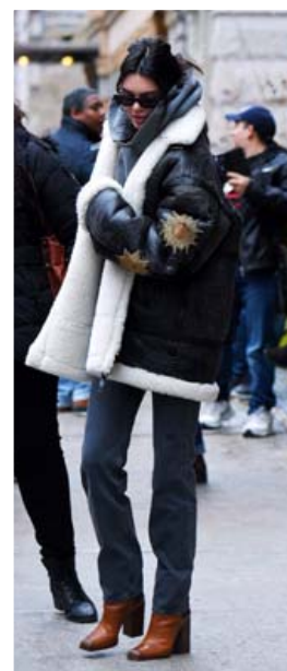
Það væsir ekki um Kendall Jenner í þessum þykka mokkakjakka.