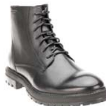
Vagabond Johnny Herraskór 19.995