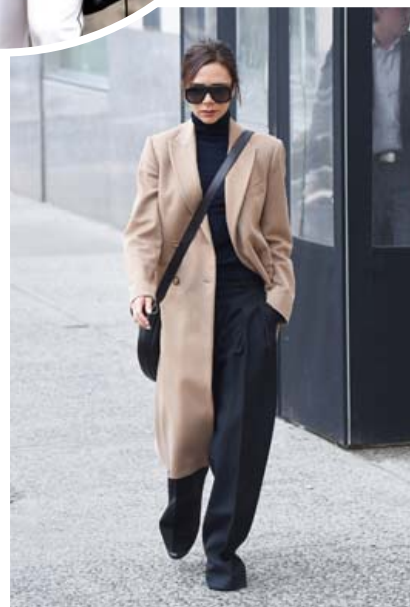
Victoria Beckham er vön kuldannum í New York og lætur yfirleitt nægja að smeygja sér í smart ullarkápu.

CHANEL KYNNING Í SIGURBOGANUM 24.-27. OKTÓBER