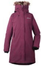
DIDRIKSONS NADINE STÆRD 36-44 VERÐ 29.995 KR.