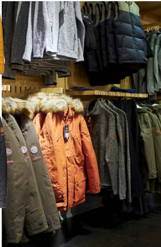
Úrvalið er glæsilegt.