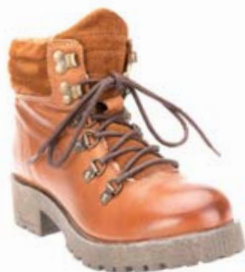
SIX MIX KULDASKÓR EINNIG TIL Í SVÖRTU VERÐ 16.995