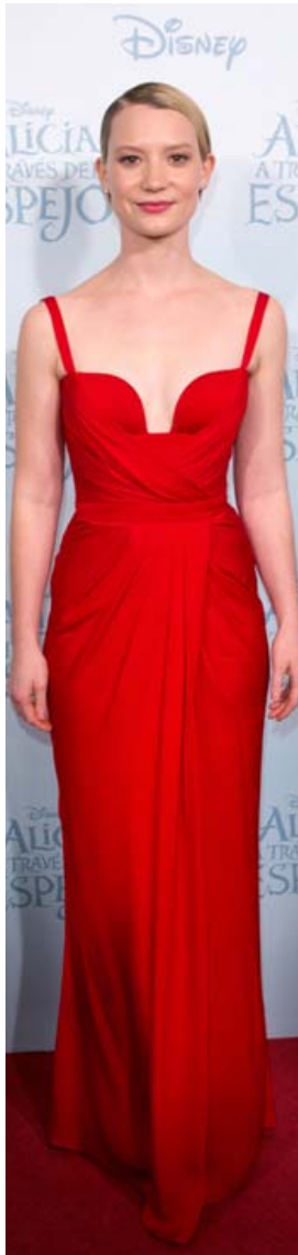
Á frumsýningu Alice Through the Looking Glass í Madrid á Spáni 2016.