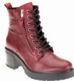
SIX MIX ÖKKLASKÓR EINNIG TIL Í SVÖRTU VERÐ: 19995