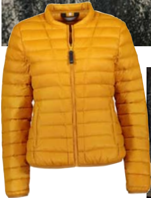
Esja kostar 26.990 kr.