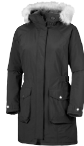
COLUMBIA GRANDEUR PEAK STÆRD S-XL VERÐ 29.995 KR.