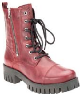
SIX MIX ÖKKLASKÓR EINNIG TIL Í SVÖRTU OG BRÚNU VERÐ 19.995