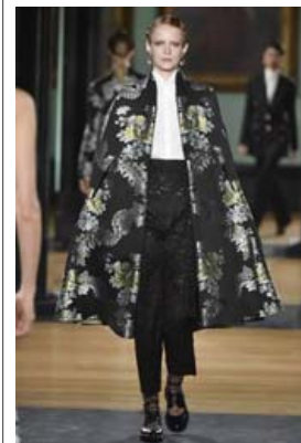
Að slá um sig í slá er góð vetrarskemmtun. Slár eru bæði hlýjar og notadrygar þegar kólna fer, og passa afskaplega vel einmitt yfir leðurjakka eða flottar yfirhafnir sem eru ekki alveg nógu þykkar til að takast á við vetur á norðlægarí slóðum. Þessi konunglega blómaslá er frá Erdem.