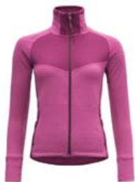
DEVOLD EGGA PEYSA STÆRD S-XL VERÐ 24.995 KR.