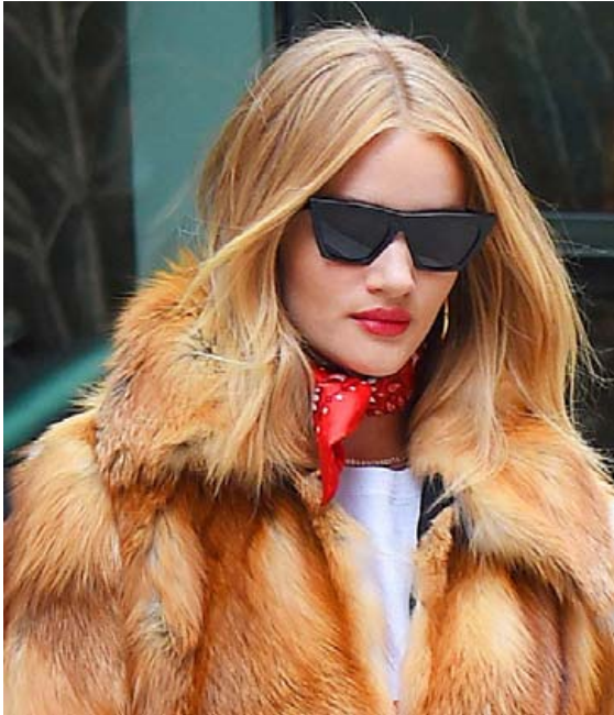
Rosie Huntington-Whiteley tekur sig vel út í þessum fallega skinnjakka.

Vetrarhörkur eru tíðar í New York borg. Stjörnurnar fara ekki varhluta af þeim og þurfa að klæða sig eftir veðri þegar þær spóka sig á götum Manhattan. Eins og með allt annað gera þær það með stæl.