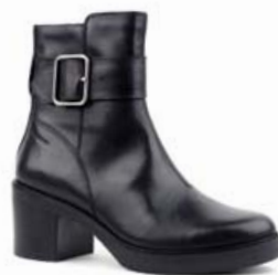
Vagabond Tilda 21.995