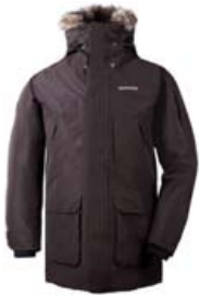
DIDRIKSONS MARCEL STÆRD S-XXXL VERÐ 29.995 KR.