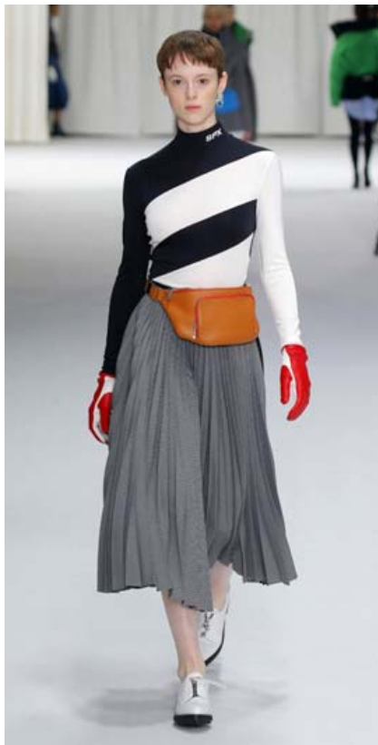
Plíserað er málið í vetur, hnifskarpar fellingar í hné-síðum plísum. Vertu í plíseruðu plísi við buxur, gróf stígvél eða með stórrí, þykkri peysu eins og þessi fyrirseta á sýningarpalli hjá Sportmax.