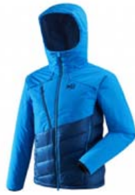
MILLET ELEVATION STÆRD S-XL VERÐ 49.995 KR.