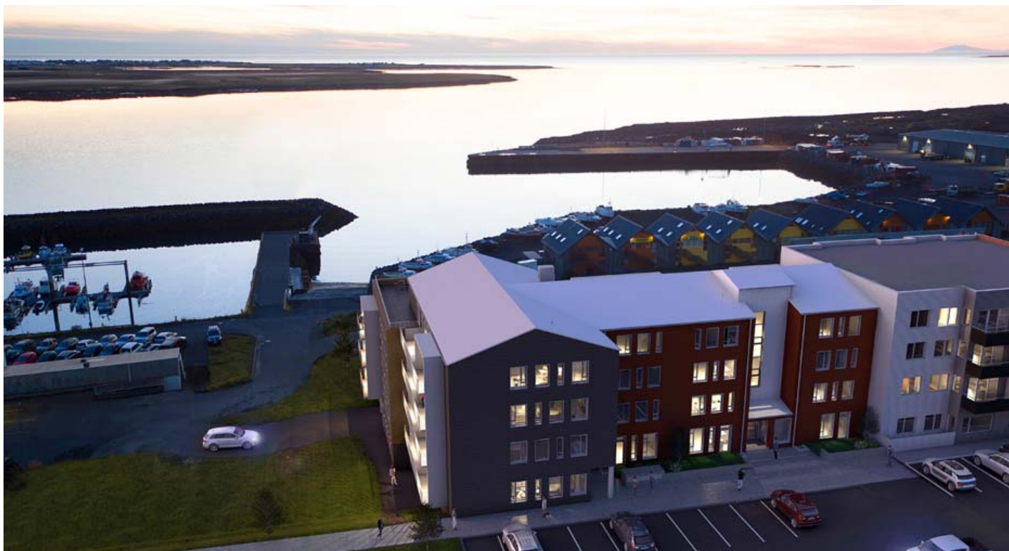
Úr nýju íbúðunum við Hafnarbraut er stórkostlegt útsýni yfir smábátahöfnina, til sjávar og Snæfellsjökuls. Þaðan verður indælt að horfa á sólarlagið frá einstaklega fögrum stað á höfuðborgarsvæðinu.