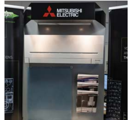
Mitsubishi Electric varmadælan er ein mest selda varmadælan á Norðurlöndum en með notkun á henni næst fram veruleg lækun á upphitunarkostnaði.

Allar nánari upplýsingar veita sölumenn Vörukaupa ehf. en einnig er hægt að finna upplýsingar á vorukaup.is.