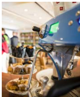
Kaffihúsið hefur fest sig vel í sessi.

Bækur taka um 60% af þeim 700 fermetrum sem verslunin býr yfir enda er boðið upp á mikið úrval innlendra og erlendra bóka.