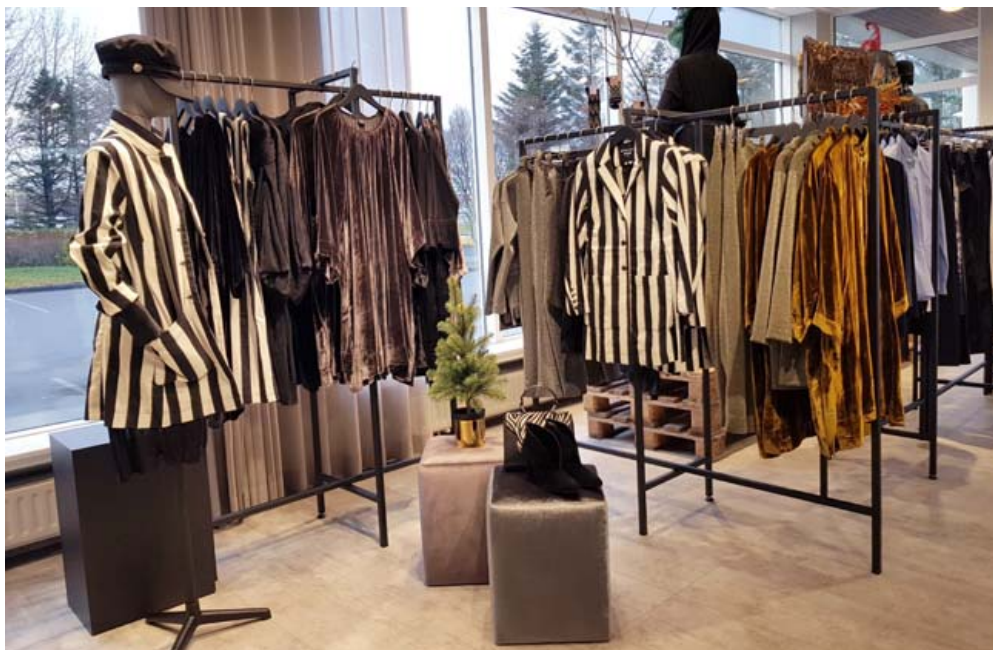
Jólaínan frá BITTE KAI RAND er ein sú allra glæsilegasta þar sem silki, sléttflauel og palliuttur leika lykilhlutverk.