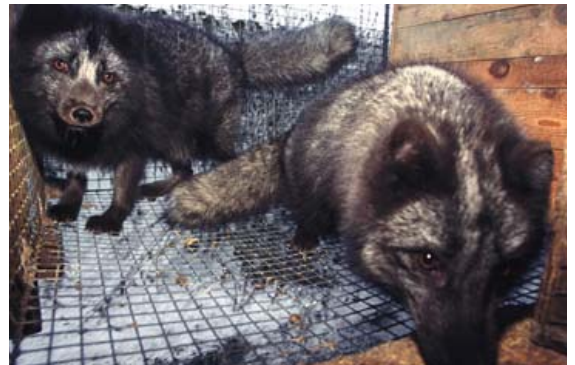
Stella McCartney kallar framleiðslu á dýrafeldi síðlausa, grimmdarlega og ósiðmenntaða og segir að þessi iðnaður nýti sér dauðann.

Feldframleiðsla er ekki fálægur bransi. Ýmsar heimildarmyndir og