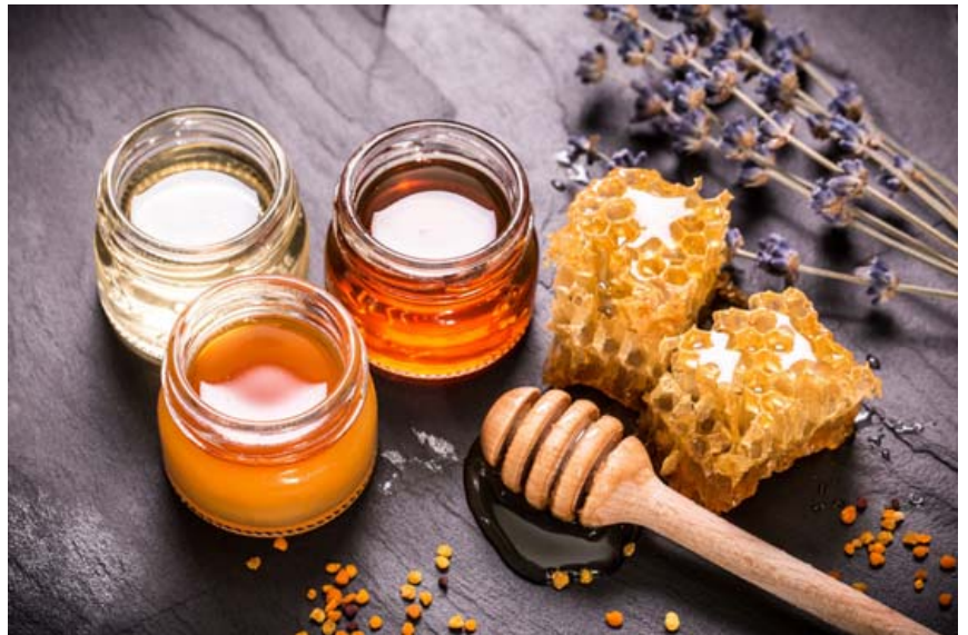
Auk mjólkursýrugerlanna sem eru í Wild Biotic eru örverustofnar sem koma frá frjókornum, drottningarhungangi og öðrum hungangstegundum en flestir þekkja núorðið hversu heilsusamleg innihaldsefni þessara náttúruafurða eru.

rannsakað lif örvera í náttúrunni og þar á meðal eru mjólkursýrugerlar í fjölda plantna sem þeir hafa safnað saman frá óspilltu náttúrusvæði í Mercantour þjóðgarðinum í suðurhluta frönsku Alpanna. Út frá byltingarkenndum rannsóknum sínum, sem eru þær fyrstu sinnar tegundir í heiminum, völdu þeir afbrigði sérstakra örvera (gerla) með það fyrir augum að búa til fæðubótarefni sem inniheldi gerlastofna sem almennt er að finna í meltingarvegi manna. Wild Biotic frá New Nordic er því visindalega þróað fæðubótarefni sem inniheldur mjög fjölbreytta örveruflóru sem samanstendur af meira en 100 gerlastofnum og inniheldur bæði mjólkursýrugerla sem og aðrar örverur sem finnast náttúrulega í meltingarfærum manna.