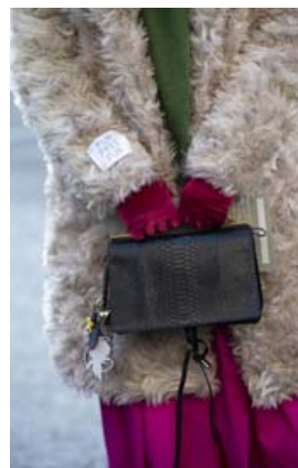
Gestur á tiskuvikunni í París í mars var í þessum glæsilega gervifelds-frakka frá Stella McCartney.

alls kyns fréttatvöngur hefur leitt í ljós hryllinginn sem dýr á slíkum búum þurfa að upplifa. Stella McCartney kallar slíka framleiðslu síðlausa, grimmdarlega og ósiðmenntaða og segir að þessi iðnaður nýti sér dauðann. Það eru ekki ýkjur. Stór hluti af dýrafeldinum sem er á markaði kemur frá búum þar sem velferð dýra skiptir engu máli. Þar að auki fylgir iðnaðinum mikill mengun.