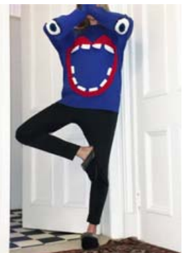
Skrimslopeysurnar eru hálfgerðar einkennispeysur Ýrurari.