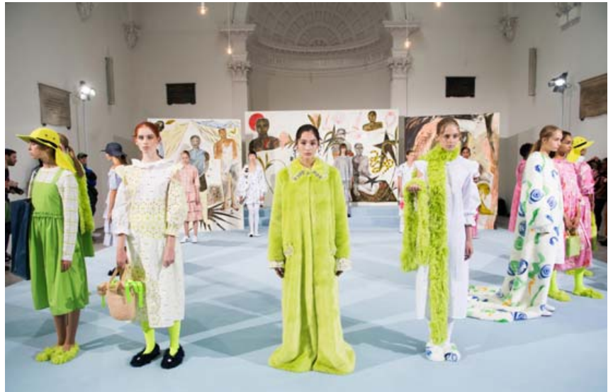
Gervifeldur er í aðalhlutverki hjá breska tiskumerkinu Shrimps. Hér sýna fyrirsætur vörur Shrimps á tiskuvikunni í London 2017. Stofnandi merkisins segir erfitt að færa rök fyrir notkun á alvöru feldi.