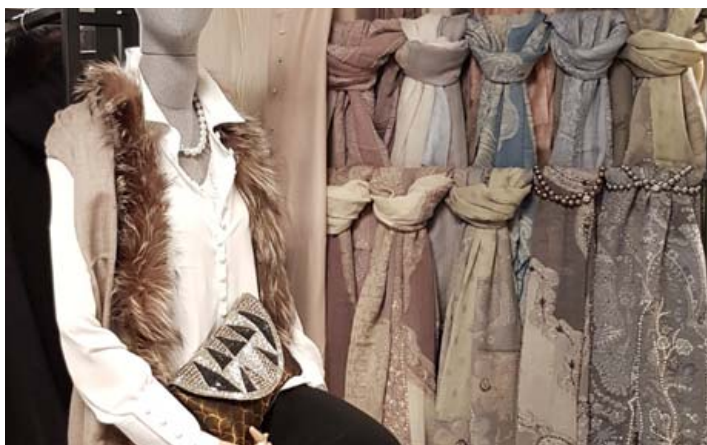
Pasmínur úr ull, kasmír og silki er eitthvað sem allar konur elska.