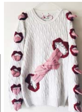
Litfögur sleikpeysa sem vekur athygli.