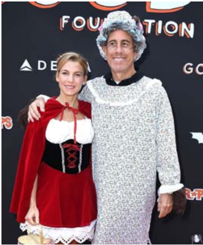
Jerry Seinfeld var úlfur í ömmubúningi og Jessica eiginkona hans Rauðhetta þegar þau tóku á móti gestum í góðgerðahrekkjavökupartii í vikunni.