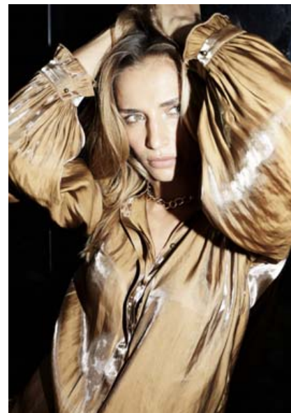
Danska merkið MOS MOSH nýtur mikilla vinsælda um þessar mundir. Fatnaðurinn er elegant og vandaður en ávallt með töffaralegu yfirbragði. Gull, brons, satín og flauel eru lýsandi fyrir jólaínanuna frá Mos Mosh í ár.