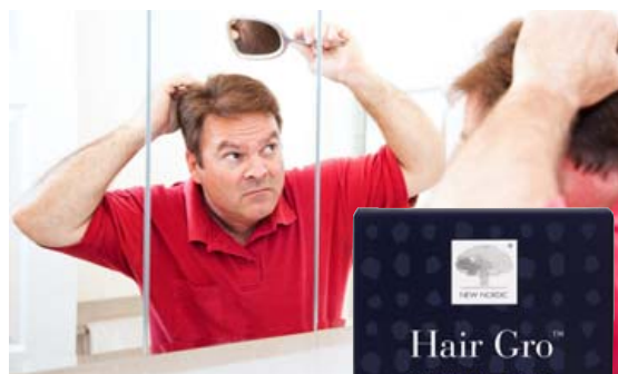
Hair Gro inniheldur tocotrienol, efni úr E-vítamín „fjölskyldunni“.

Hair Gro frá New Nordic inniheldur Procyanidin B2 úr eplum, en rannsóknir hafa sýnt fram á að það eykur hárvöxt. Hair Gro