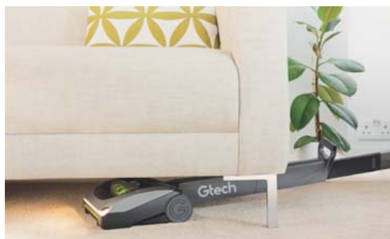
Power Floor K9 og ArRam K9 komast auðveldlega undir sófa og stærri stóla.