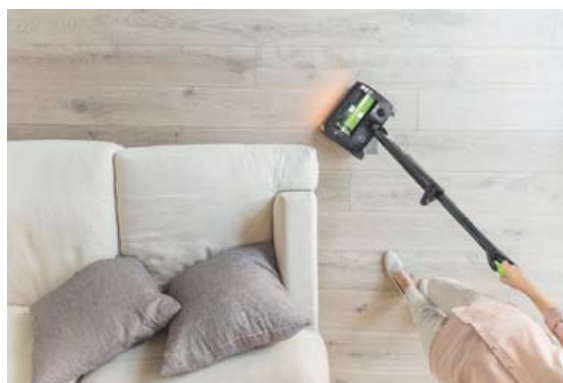
Það er mjög þægilegt að ryksuga með vélinni sem gerir þrífín skemmtilegri.

Það er frábær tilfinning að vera laus við snúruna á rafmagnssláttuvélinni.