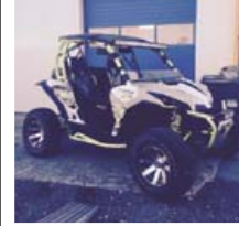
BROSKALLINN!!! '15 CAN-AM MAVERICK TURBO. EK 2 Þ.KM...ÅSETT 4.280P #453087. S: 695 2015

Borgarbilasalan Funahöfða 1, 110 Reykjavík Sími: 580 8900