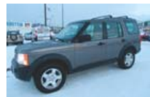
DISCO FRISKÓ!!! '06 LR DISCOVERY 3, EK 220 Þ.KM, DÍSEL, SJÁLFSK...VERÐ 1.680P #472812. S: 695 2015