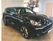
Porsche Cayenne S Hybrid Árgætt 2015, ekin 85 þkm. Loftp.fjórðrun, 21" ofl. Verð kr. 8.900.000