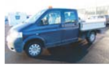
SJÁLFSKIPTI ÞJARKURINN! '09 VV TRANSPORTER 6 MANNA. EK 179 Þ.KM, DÍSEL, SJÁLFSK, ASETT 1.980P #481439. S: 695 2015