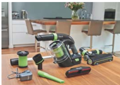
Gott safn aukahluta fylgir Power Floor K9.