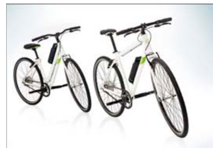
Hybrid-rafhjólin okkar hafa hlotið mikið lof en þau eru ætluð til notkunar innanbæjar og utanvega.