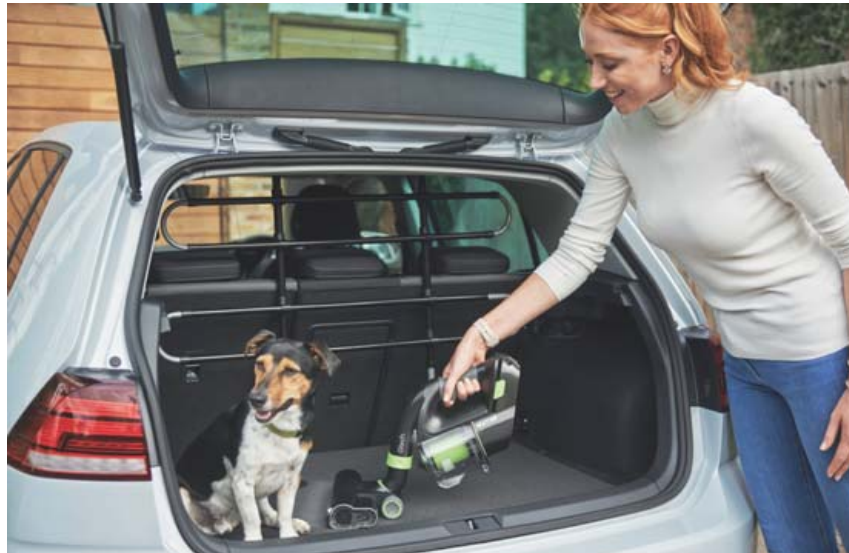
Fjöldi aukahluta fylgir með ryksuginni, t.d. litill haus fyrir áklæði og bílenn sem gerir öll þríf mun þægilegri.

Allar GTECH vörur má kynna sér á gtech.is og kaupa hjá BSV netverslun (bsv.is) og Heimkaupum (heimkaup.is).