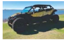
NEYÐARKALLINN!!! '17 CAN-AM MAVERICK TURBO 4 MANNA.VSK ÖKUTÆKI!!! EK 4 KLST... VERÐ 5.980P #454129. S: 695 2015