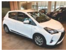
Toyota Yaris Active Hybrid Nýr bill, Sjálfskiptur, bakmyndavél, álfelgur ofl. Tilboðsverð kr. 2.690.000