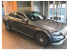
Mercedes-Benz C350e Hybrid Árgætt 2017, ekin 21 þkm. Loftp.fjórðrun, forhitun á miðstöð, 19" AMG Style ofl. Verð kr. 4.990.000

Premium Cars Kletthálsi 1, 110 Reykjavík Sími 415 7000 premiumcars.is