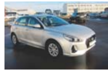
MOLI DAGSINS!!! '17 HYUNDAI I30, EK 48 Þ.KM, BENSIN, BEINSK...ÅSETT 1.980P #454281. S: 695 2015