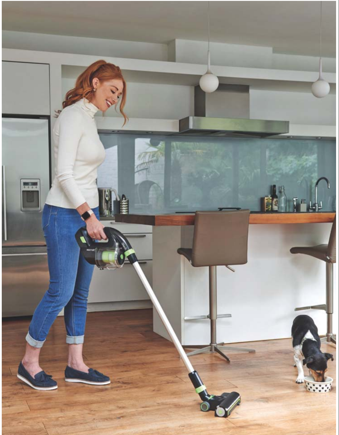
Ein allra vinsælasta vara Gtech er Power Floor K9 ryksugan sem er einstaklega meðfærileg og öflug þráðlaus ryksuga sem ræður auðveldlega við gæludýrahár.