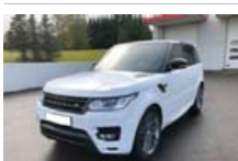
2015 JAGUAR LAND ROVER Range Rover Sport 4x4. Ekin 70 þ.km, dísel, sjálfstýptur-8 girar. Alvöru jeppi með alvöru búnaði! Verð 10.900.000 kr. Rnr.150060.

Betri bílasalan Sími: 571 7166 www.betribilasan.is