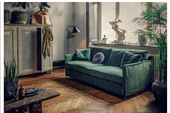
Petito sófi frá Furninova klæddur í Emerald grænt flauelsáklæði.

dagana. Ilmkertin frá VOLUSPA spila þar stóra rullu ásamt vörum frá Cozy Living sem býður upp á dásamlega púða, teppi og margt fleira fallegt fyrir heimilið.“ Allar nánari upplýsingar má finna á www.linan.is .