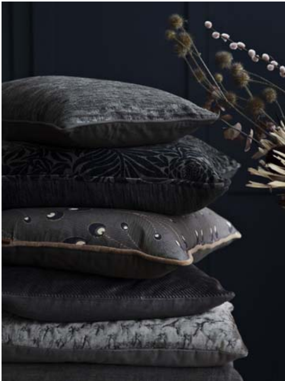
Djúpir litir og munstur einkenna vörulínuna frá Cozy Living þennan veturinn.