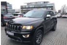
2017 JEEP Grand Cherokee Limited AWD. Ekin 51.000 km, bensín, sjálfstýptur-9 girar. Jeppi er ekki jeppi nema á honum standi Jeep. Verð 7.990.000 kr. Rnr.130064.