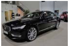
2017 Volvo S90 D5 AWD Inscription ekin 49þ. km. Einstaklega vel útbúinn, þeir verða ekki flottari en þetta! 6.790.000 kr.