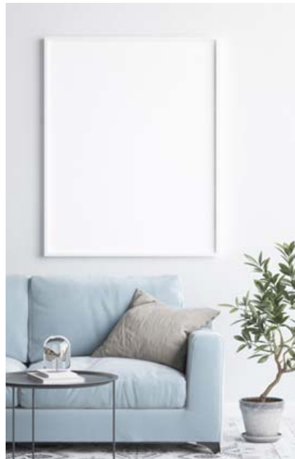
Hafðu veggmyndir í hvítum rómum. Það blekkir augað og lætur rýmið líta út fyrir að vera stærra en það er.

Ef þú velur að hafa sófaborð er gott að hafa tvö litil og annað jafnvel lægra en hitt svo það raðist hálf-