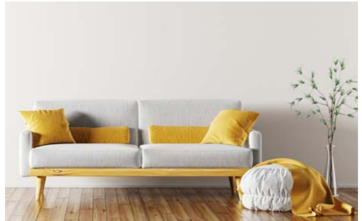
Með því að nota skemil eins og sófaborð öðlast hann tvöfalt notagildi.

Ef þú ert með myndavegg skaltu byrja að raða myndunum alveg upp við loftið og vinna þig skipulega niður. Þannig virkar hærra til lofts. Það má líka blekkja augað með því að hafa sófa sem er stillt upp við vegg með lágu baki. Einnig þannig virkar hærra til lofts.