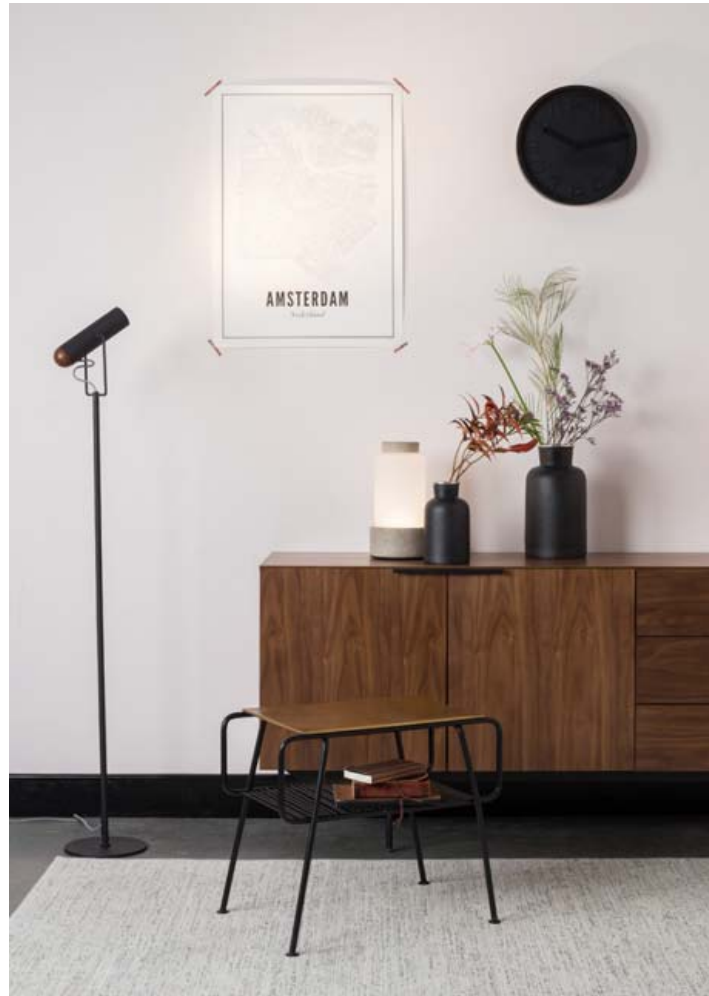
Travis skenkurinn frá Zuiver ber sjarmar sjöunda áratugarins.

Það stýttist í adventuna og segir Hrunn að Línán hafi líklegast aldrei boðið upp á jafn fjölbreytt úrval af gjafavörum eins og fyrir þessi jól. „Við erum í óðaönn að taka upp vörur og kom þeim fyrir þessa