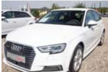
2017 Audi A3 e-Tron (Hybrid) ekin 20þ. km. Premium útgáfan. Fer hratt á þessu verði. 3.599.000 kr.