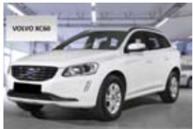
Volvo XC60 D4 AWD Einn af vinsælustu jeppingum landsins, hringdu núna! 5.290.000 kr.

Betri bílakaup ehf. Sími: 511 2777 www.betribilakaup.is