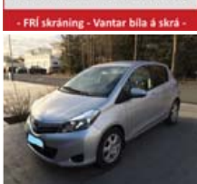
2013 TOYOTA Yaris. Ekin 75.000 km, dísel, 6 girar. Frábær smábíll sem hefur reynt Íslendingum einstaklega vel. Verð 1.350.000 kr. Rnr.110213.