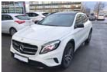
2014 MERCEDES-BENZ GLA 250 4x4 Urban Off-Road Panorama. Ekin 34.000 km, bensín, sjálfstýptur 7 girar. Ótrúlegt verð á eðal jeppling! Verð 4.350.000 kr. Rnr.150004.