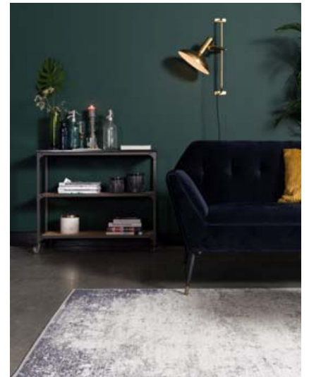
Motturnar frá Dutchbone koma í miklu úrvali.

„Það er okkur mikilvægt að viðskiptavinir okkar upplifi eitthvað nýtt og spennandi þegar þeir koma inn í verslunina.“