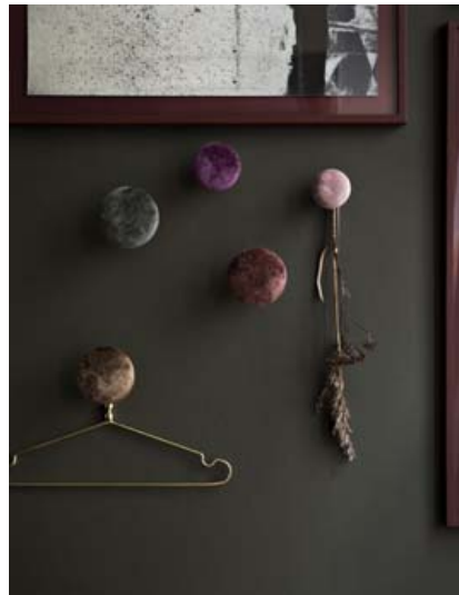
Flauelssnagarnir frá Cozy Living eru fallegir á vegg.