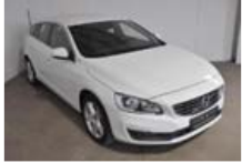
Volvo V60 D6 AWD Plug-In Affimikill, fjórhjóladrifin, lúxus Sænskur skutbílur 3.890.000 kr.