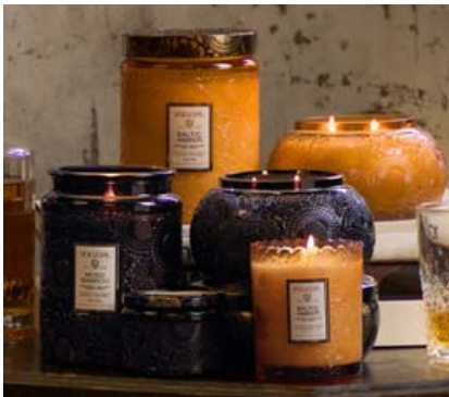
Ilmkertin frá VOLUSPA eru í sérflokkki þegar kemur að gæðum og fallegum umbúðum.