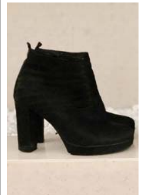
Skófíklar geta glaðst þar sem nóg verður á boðstólum við þeirra hæfi.