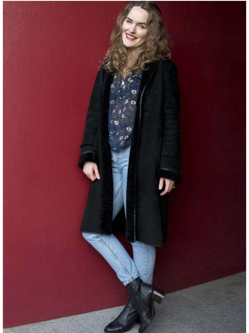
Heba í skinnkápunni yndislegu sem hún fékk frá mágkonu sinni og er í sérstöku upphaldi.