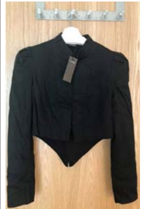
Litill svartur jakki sem passar við allt.