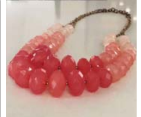
Bæði verður hægt að fá föt og fylgihluti á Geggjaða fatamarkaðinum.

Geggjaði fatamarkaðurinn er í hjarta miðbæjarinnar, í Grófinni eitt, beint á móti Fiskifélaginu og bóka-kaffihúsinu Iðu og hinum megin við götuna frá Borgarbókasafninu. Hann er opin frá 13-18 bæði laugardag og sunnudag. Hægt er að skoða fleiri myndir af vöruúrvalinu á Facebook-viðburðinum Geggjaður fatamarkaður X.