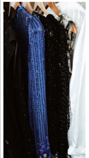
Á markaðinum kennir ýmissa grasa.