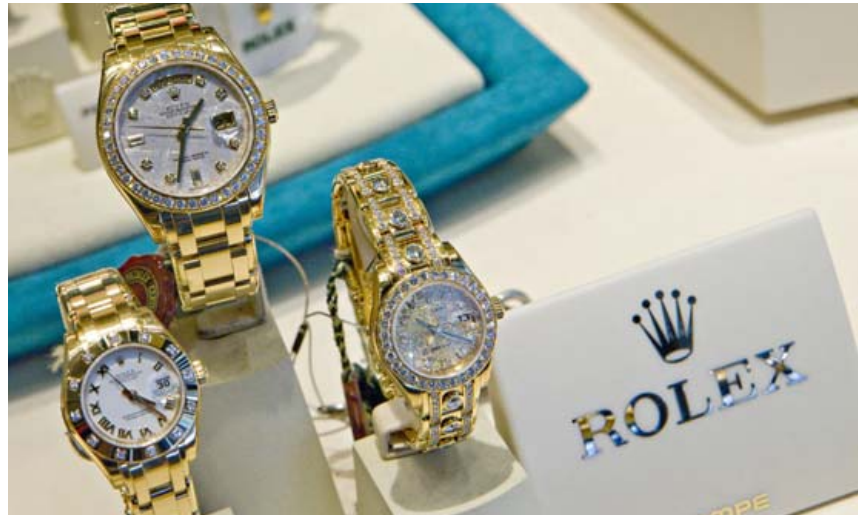
Á Singles' Day í ár seldist Rolex úr fyrir rúmlega 48 milljónir króna í netversluninni Secoo.