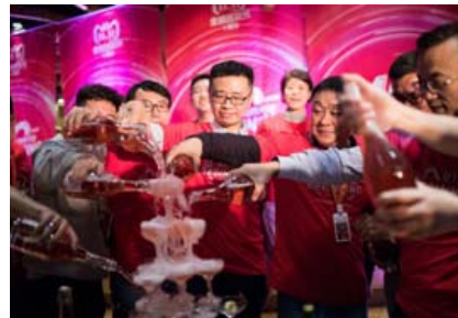
Starfsfólki Alibaba leiðist ekki velgengi Singles' Day, en fyrirtækið fann upp þennan mikla nettillboðsdeg sem verður sífellt stærri.

Í ár buðu nokkur fræg lúxusmerki upp á sérstakar vörur og tilboð á Singles' Day. Breska lúxusmerkið Burberry seldi til dæmis