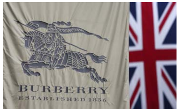
Burberry er eitt þeirra lúxusmerkja sem eru farin að taka þátt í Singles' Day og í ár framleiddi fyrirtækið sérstaka trefla í takmörkuðu upplagi í tilfærni dagsins.

ullartrefil sem var í takmörkuðu upplagi á 82 þúsund krónur í Tmall netversluninni. Treflarnir seldust upp á fyrsta degi forsöluinnar. Versace seldi hettupeysi í sömu vefverslun sem kostaði 50 þúsund krónur. Franska lúxusmerkið Chanel, sem hefur verið snobbað þegar kemur að netverslun, var með sérstakt söluáttak daginn fyrir Singles' Day og mörg önnur vestræn merki, eins og Yves Saint Laurent, Lancôme, Armani og Cle de Peau tóku líka þátt. Fjöldi kinnverskra netverslana selur nú líka alls kyns vestræn lúxusvörur og þátttaka þessara verslana gerði það að verkum að fleiri vestræn lúxusmerki voru hluti af Singles' Day.