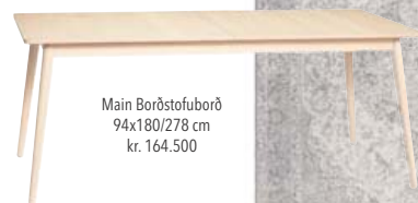
Main Borðstofuborð 94x180/278 cm kr. 164.500