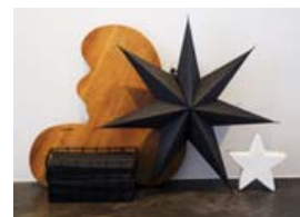
Svart og hvítt er ráðandi á heimili Hugrúnar en á stöku stað má sjá við.