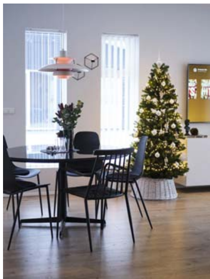
Borðstofuljósíð frá Louis Poulsen eftir Poul Henningsen er upphaldshlutur Hugrúnar og passar vel inn í heildar-stíl hennar sem er skandinavískur og minimalískur.