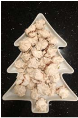
Piparlakkriskurl og kornflex passar vel í marengstoppa.