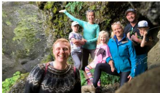
Fjölskyldan, fremst á myndinni, með vinum í Þórsmyrk í sumar.

Einnig er lögð áhersla á menntun en í haust fór fyrsta meistaranám-skeiðið um norðurslóðir af stað við skólann sem ég kenni ásamt Dr. John Holdren, sem er þekktur fyrir að hafa verið visindaráðgjafi Obama, fyrrverandi forseta Bandaríkjanna. Þema námskeiðsins er „nýsköpun og norðurslóðir“ en þörfin á nýsköpun er mikil þar sem við erum að takast á við nýjar áskoranir vegna loftslagsbreytinga. Þetta á við á mörgum sviðum, s.s. er varðar samvinnu, stefnumótun og nýtingu tækninýjunga í að takast á við málin á ábyrgan og sjálfbæran hátt.“