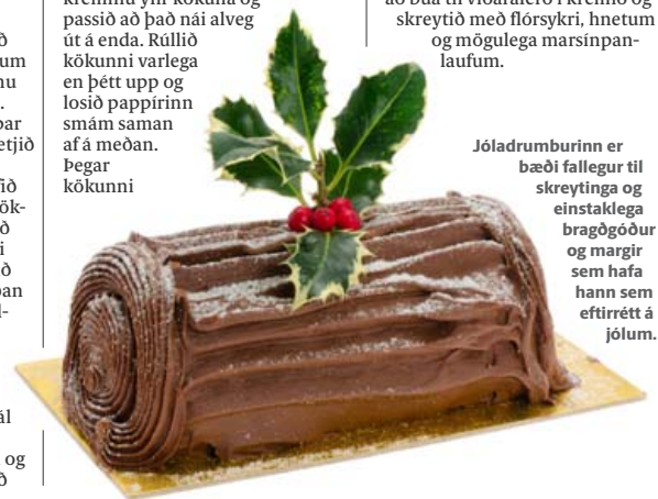
Jóladrumburinn er bæði fallegur til skreytinga og einstaklega bragðgóður og margir sem hafa hann sem eftirrétt á jólum.

hefur verið rúllað upp, snútið henni þá þannig að endinn á rúllunni snúi niður og setjið afganginn af kreminu yfir. Notið borðhnif til að búa til vidadarferð í kremið og skreytið með flórsykri, hnetum og mögulega marsinpanlaufum.