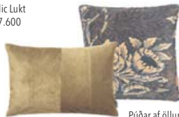
Púðar af öllum stærðum og gerðum..