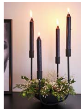
Aðventukransinn er svalur með svörtum kertum en grænar greinarnar koma með hlýleika á móti.

„Ég er bara nýlega flutt inn en hef lengi safnað að mér innbúi. Á til dæmis mikið af littala munum.“