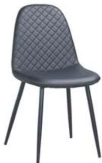
Aston Borðstofustóll kr. 19.800