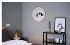
Svefnherbergið er í dökku litum og Hugrún er mjög ánægð með útkomuna. Hún bætir við gylltum skrautumunum til að skapa hlýleika.

Hugrún hefur gaman af að nota grænar plöntur til að skapa hlýleika á heimilinu.