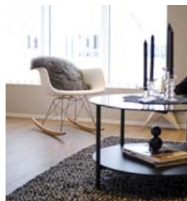
Hugrún hefur lengi safnað munum í búið þó hún sé nýflutt að heiman.