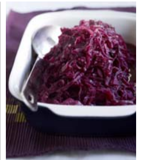
Heimagert rauðkál er best.

mót sem tekur að minnsta kosti 5 lítra. Blandið öllu kryddi (ekki salti og pipar) saman við sykurrinn. Setjið allt í eldfast mót, byrjið á rauðkáli, síðan smá salt og pipar, lauk og epli, síðast kemur kryddblandan. Gerið aftur alveg eins og endið á rauðkáli. Setjið vökva og smávægis smjörklipur hér og þar yfir. Setjið lok yfir og stingið fatinu í ofninn. Eldið í ofninum í nokkra klukkutíma eða þangað til rauðkálið er orðið alveg mjúkt. Hrærið í annað slag. Hitið ofninn í 150°C. Notið eldfast