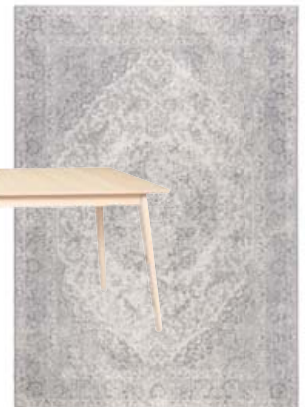
Ravi Gólfmotta 170x240 cm kr. 116.900