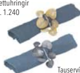
Tauservíttur kr. 990