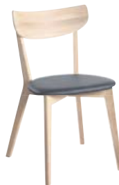
Ami Borðstofustóll kr. 18.500