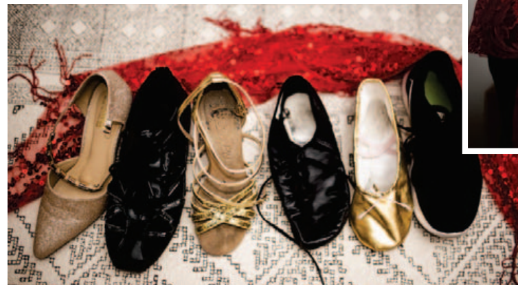
Dansskórnir eru mismunandi eftir því hvað á að dansa.