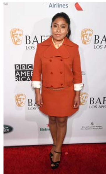
Glæsileg í appelsínugulri pilsdragt og bandahælum á rauða dreglinum.

og dýpka sannfæringu innfæddra Mexíkóka um að þeir geti þetta líka. Samt er hún ekki viss um að hún leiki meira. Að móta huga og hjórtu grunnskólabarna er auðveldara en að breyta rötgróinni hugsun fullorðinna, en þó er það einmitt það sem kvikmyndin Roma gerir.