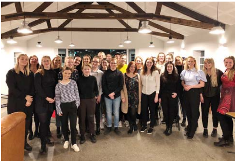
Þátttakendur og mentorar í lokahófi eftir 2. umferð programmsins haustið 2018.