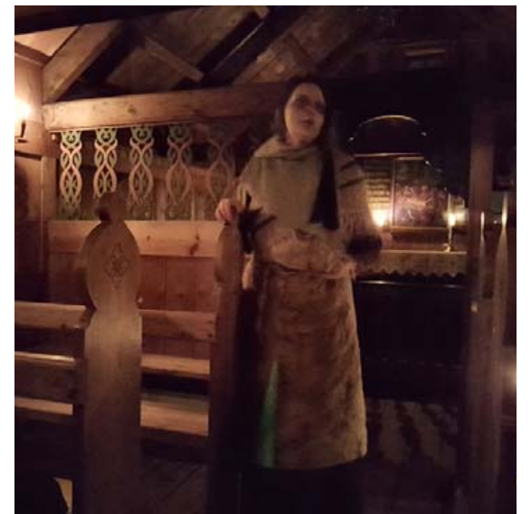
Sagt er að liðnir íbúar gangi aftur um nætur í safninu.

og kleinu í Dillonshúsi. Allir eru velkomnir og ókeypis aðgangur en fyrstir koma, fyrstir fá. Vegna vinsælda er nauðsynlegt að skrá sig í draugagöngurnar en þegar hafa borist margar umsóknir. Skráningu skal senda á leidsogumenn@reykjavik.is. Fyrstu tvær göngurnar verða kl. 19 og 19.30 og henta líka börnum, en fullorðins draugagöngur verða kl. 20, 20.30, 21.30 og 22.