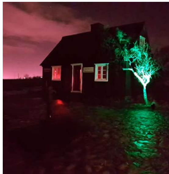
Árbæjarsafn tekur á sig kynjamyndir í myrkrinu.

„Spákonur þessar sjá lengra en nef þeirra nær og munu spá í spil fyrir gesti í Kornhúsinu. Viðburðurinn er vinsæll og því gætu gestir þurft að bíða í röð eftir að komast að,“ upplýsir Guðrún, en á neðri hæð Kornhússins gefst gestum kostur á að kanna sýninguna Hjáverkin sem fjallar um fjölbreytt störf kvenna á árunum 1900 til 1970.