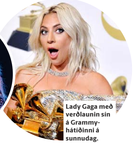
Lady Gaga með verðlaunin sín á Grammy-hátíðinni á sunnudag.