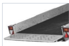
Aðeins 12° halli