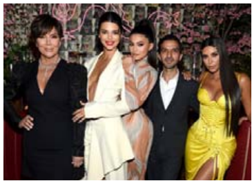
Kris Jenner, Kendall Jenner, Kylie Jenner og Kim Kardashian auglýsa rúmlega allt á samfélagsmiðlum.