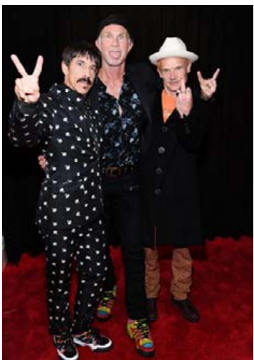
Anthony Kiedis, Chad Smith og Flea úr Red Hot Chili Peppers mættir hressir og kátir eins og þeim er einum lagið.