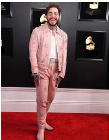
Post Malone skipti nokkrum sinnum um fót. Svona mætti kappinn til leiks, fagurbleikur og flottur.