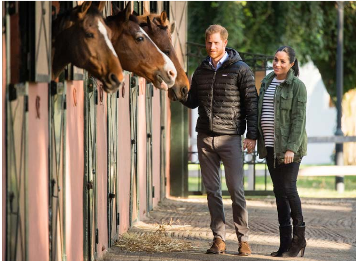
Sportklæðnaðurinn var tekinn fram þegar þau heimsóttu hestabúgarð en þar fer fram stuðningur við börn með sérþarfir.