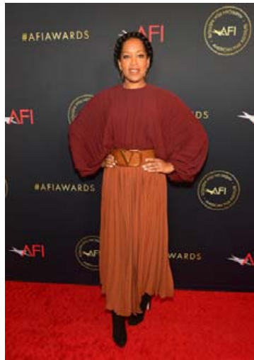
Regina King er alltaf glæsileg.

Skeifunni 8 • 108 Reykjavík • Sími: 517 6460 • www.belladonna.is