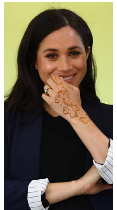
Henna-tattú sem Meghan fékk að gjöf í Marokkó sem á að færa ófæddu barni hennar lukku.