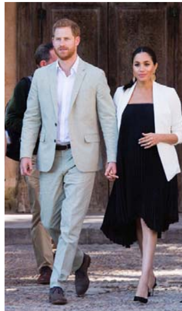
Svartur kjóll frá Loyd/Ford og hvítur jakki yfir. Meghan þykir alltaf einstaklega smekklega klædd og lætur óléttuna ekkert breyta því. Þarna eru þau hjón á leiðinni í heimsókn í Andalusian-garðinn í Marokkó.