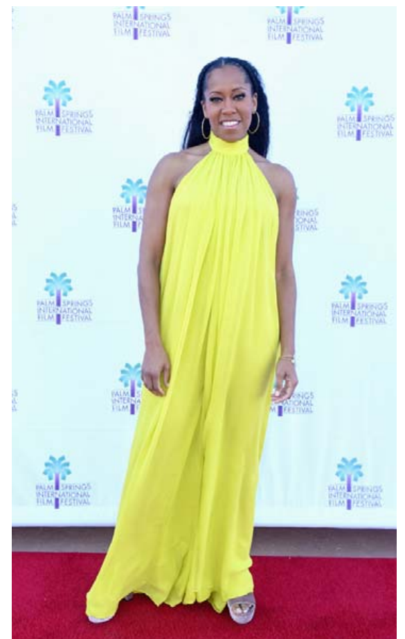
Sólarmegin í gulum kjól á kvikmyndahátíðinni Palm Springs International Film Festival í janúar 2019.