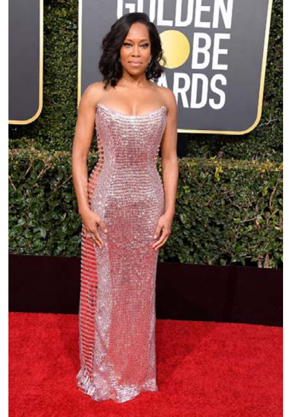
Í bleikum glimrandi frá Alberta Ferretti á Golden Globe-hátíðinni þar sem hún hlaut einnig verðlaun.