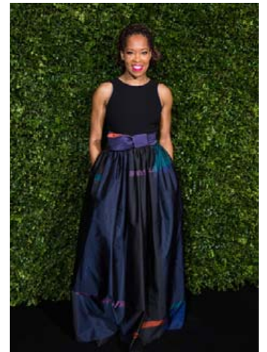
Í BAFTA-kvöldverði í byrjun febrúar.