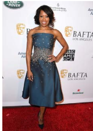
Í BAFTA-teboði í janúar.