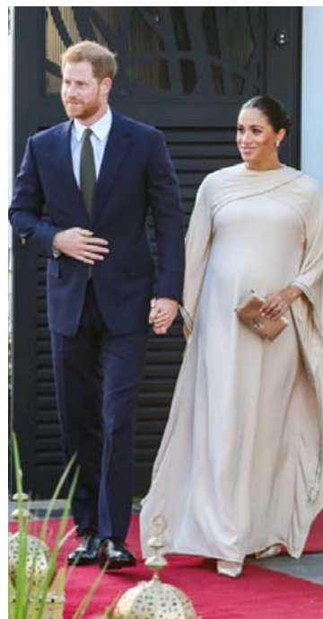
Meghan var í fallegum kjól frá Dior, skreyttum steinum þegar hún heimsótti sendiherra Bretlands í Marokkó.