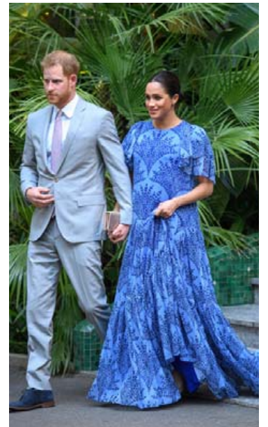
Hjónin voru bæði bláklædd þegar þau fóru í konunglega veislu hjá konungi Marokkó, Mohammed VI. Meghan var í kjól frá Carolina Herrera. Takið eftir bláu skónum hans sem eru í stíl við kjólinn hennar.