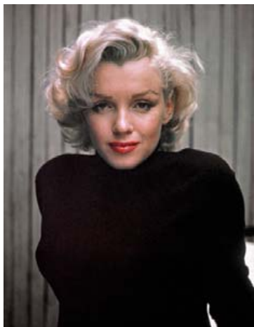
Mesta skvísa allra tíma.