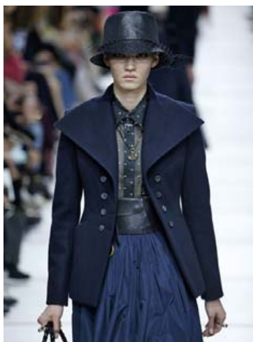
Svolitið Mary Poppins fatastill í vetrartísku Dior 2019-2020.

Til að láta lokkandi augun lita út fyrir að vera stór, áberandi og vel vakandi notaði Marilyn hvítan augnblyant á innri hvarmana, og sú tækni blifur svo sannarlega enn í dag.