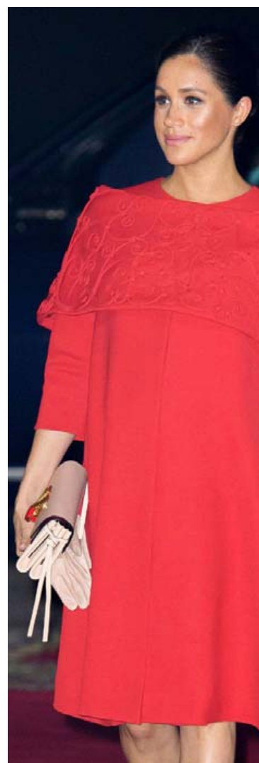
Í glæsilegum rauðum kjól frá Valentino þegar hún kom á flugvöllinn í Casablanca í Marokkó.

mystyle Holtasmára 1 201 Kópavogur (Hjartaverndarhúsið) Sími 571 5464