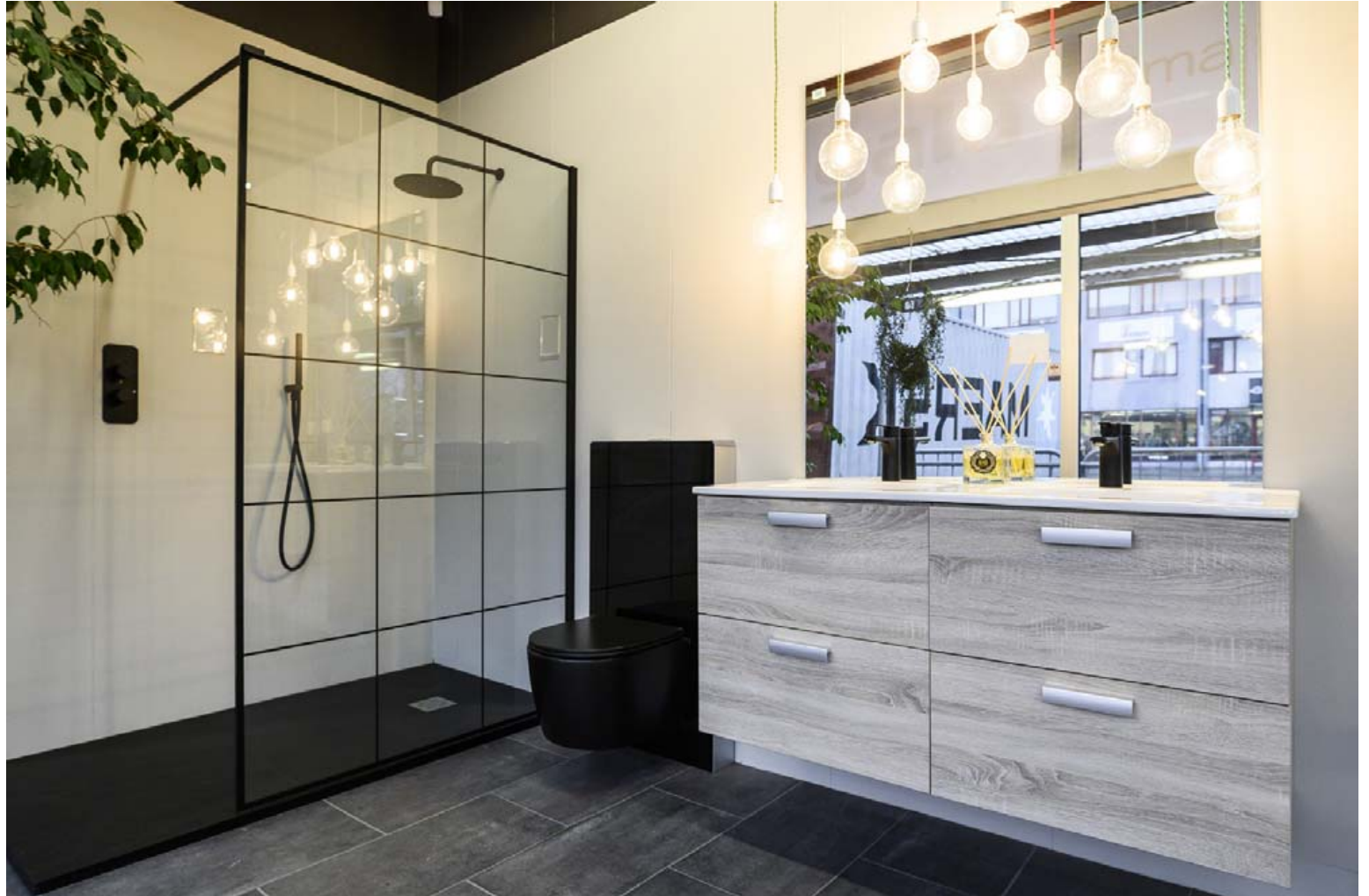
Þarna má sjá granítbotninn í sturtunni sem er svo vinsæll þessa dagana að ný sending kemur til landsins frá Spáni í hverri viku.

Spegillinn er með hátalara og sýnir hitastig og annað. Ljós í hillunum og eitthvað fleira. Ég hélt að ég myndi ekki selja einn einasta en hann rann út og er uppseldur.“ Það er vel þess virði að rúlla í Ármúla til Írisar og skoða úrvalið. Þar er vel tekið á móti öllum.