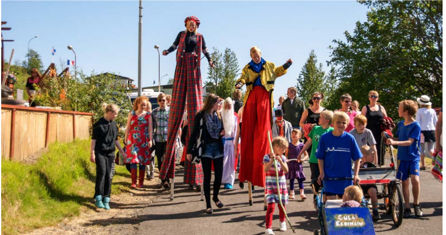
Ein af fáum aðalbækistöðvum frönsku sjómanna hér við land var á Fáskrúðsfirði. Er ætlað að þetta tímabil hafi staðið frá síðari hluta 19. aldar og þar til að síðustu skúturnar fóru héðan á seinni hluta fjórða áratugar tuttugustu aldar. Síðustu ár hafa Fáskrúðsfirðingar glaðst yfir þessum tengslum.