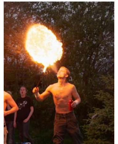
Tengsl Fáskrúðsfirðinga við Frakka urðu til þess að þann 18. ágúst 1991 var komið á vinabæjartengslum við bæinn Gravelines.