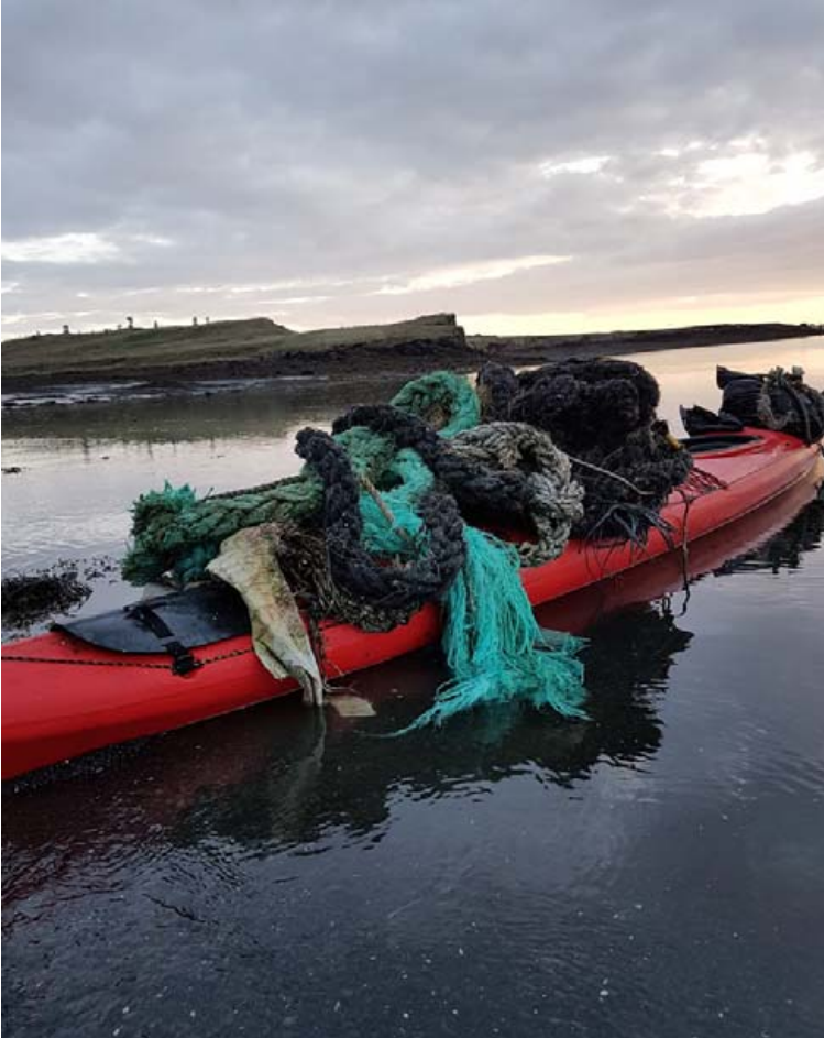
Magnið af rusli í fjörum landsins er hreint ótrúlegt. Hér getur að líta af- rakstur einnar af fjölmörgum plockferðum Örlygs síðastliðin tvö ár.

Sólveig Gísladóttir solveig@frettabladid.is